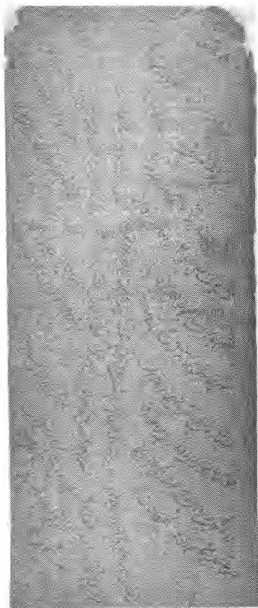
نمونه‌ی ده‌سخته‌ی شیعریک‌ی ( ۹۶ لی عاشق )