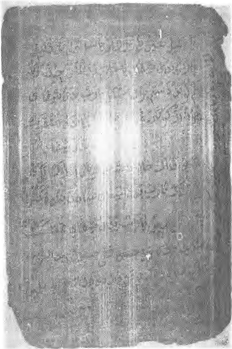
• نمونه‌ی لایه‌ری دوایی ده‌سخته‌ته‌ک‌هی ماموستای مدرس