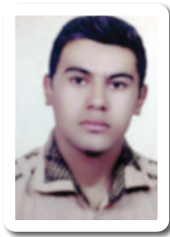
کاروان میراوی پیشمه‌رگه، چالاکى سیاسى و نه‌ده‌بى