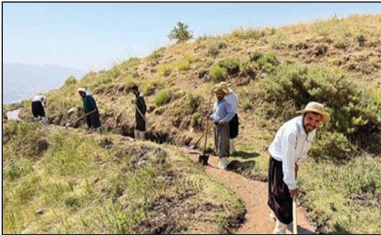
جوگه و جوّمالى جوگهى ئاو

دهلین: دهلیى ماينى ميڤگ خۆره، هينده چوست و چالاکه، ماينى ميڤگ خۆر، ئه و ماينهیه كه له ميڤگدا دهلهوهپى، گياو سهوزى ميڤگيش ههميشه پاك و ووزه دهر و گيا چاره، چونكه ميڤگ ههميشه شيندار و تهپه، سهوزايى به پيته. ميڤگ بهزورى له بههاراندا دهتهقى، ئاوى زور جوگهله دهبهستى، تا دهمه و هاوين و بههاريكى درهنگيش ههرشيى تهپى دهمينيت، ههركهسيك يا ئازهلېك چوست و چالاک و پيست جوان بيت دهلین: دهلیى ماينى ميڤگ خۆره، چونكه ماينى ميڤگ خۆر ههميشه بهزهوق و پيست جوان و به رهونهقه.