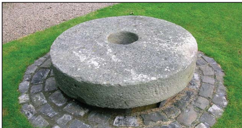
بهرداشیکی ئاشی ئاو

دهستار: دوو بهرداشی بچوکی دهستی ده توانریت بگویریتته وه، ساوه رو قهره خرمانی پیده هاردریت. بهرده کانی زورتر له سهر شیوهی بهرداش سهریه ک دهنرین، به لام قه باره یان بچو کتره، بهردی دهستار له جیی ئاوه که، به سورانه وهی پارچه داریک که دهچه قیته بهردی سهره وهی دهستاره که دهسوریت و پیی دهوتریت: دهسکی دهستار، کاتییک به دهست بهردی سهره وهی دهستاره که به هوی دهسکه وه دهسوریت دانه ویله که ده هارپیت، چونکه بهرده کان سواریه کتر بونه تا دانه ویله که ی ده کریتته نیوان بهردی سهره وه خواره وه بهارپیت، چ بو ساوه ر بیت یا قهره خرمان.