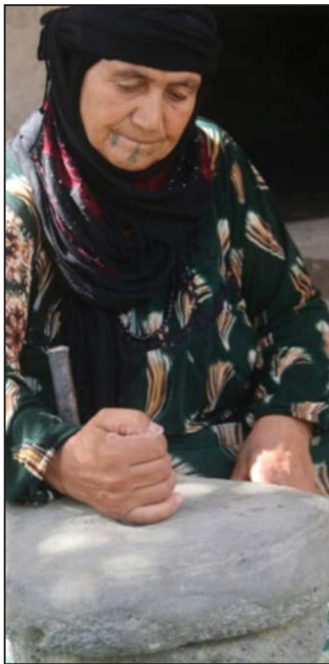
ژنه کوردیک دهستار به کار دهینیت.

له قور دړوستکراو گهرمه له زستانداو فینکه له هاویندا. به پیچه وانه وه ژووری له بلوک دړوست کراو که فمال کراو به گهچ له زستاندا سارده و له هاویندا گهرم، له ناچاریدا ناپوشی ته خته ی بو ده کریت بوگلدانه وه ی گهرمی و ساردی وهرزه کان.