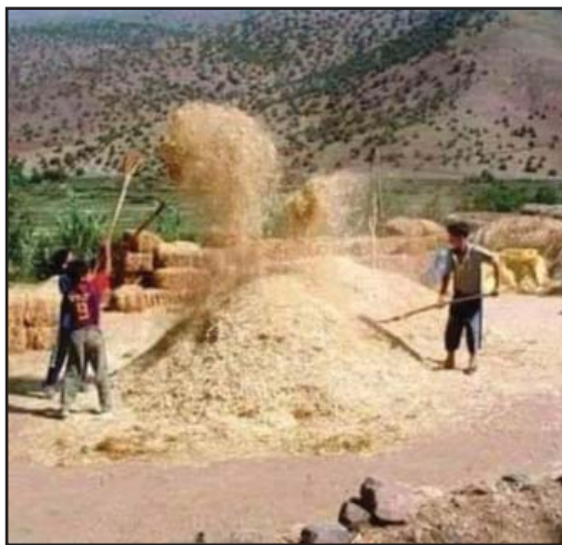
شه‌ن کردنی خه‌رمان دواى گيتره‌کردن.

خوناو، مانای جوراوجور دهدات به‌دهسته‌وه، به‌پیی ناوچه‌کان ده‌گوریت، وه‌ک له‌هه‌ندئ ناوچه‌دا به‌شه‌ونم ده‌لین خوناو. له‌ناوچه، زورکوستانه‌کاندا، که‌به‌فریکی زور ده‌باریت، خوناو ئاوی تواوه‌ی به‌فره، که‌دوایی یه‌ک ده‌گرن رووباری گه‌وره دروست ده‌که‌ن، تیژ ره‌وانه له‌لوتکه‌ی به‌رزی شاخه‌کانه‌وه به‌ره‌و هه‌لدیرو چه‌م و شیوه‌کان ده‌رۆن. له‌فه‌ره‌نگی هه‌نبانه بو‌رینه‌دا، خوناو، به‌مانای شه‌ونم، نمه‌مه باران، ئاوی شیلیم و ئاوی نوکاو و ئاوی ئاودانه‌وه‌ی قاورمه‌ش دیت.