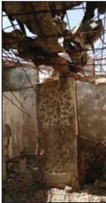
خانویه‌کی که‌لاوه‌ی کون

ژماره کهم دروست بون، به دهوری دهوله مهندهکاندا دهسورپینه وه و له بازنه‌ی داواکانیان دهرناچن، بژیوی ژیانیان له و پروانگه وه مه‌یسهر ده‌بیت، به کرده وه نه‌شیاوه‌کانیان نازناوی جورا و جور له خویمان ده‌نین. به کاره‌ینانی وشه‌کانی چه‌وره و چه‌کل و مه‌کل، هه‌رچی و په‌رچی، شرپشیت، هه‌له‌شه و په‌له‌شه، هه‌مویان له خانه‌ی سیفه‌ته خراپه‌کانی دانه پال مروّقا ده‌خولینه‌وه. به لام وشه‌کانی چه‌وره، چه‌کل و مه‌کل، به کاره‌ینانیه‌که متر بون، خه‌ریکه ده‌چنه خانه‌ی وشه فولکلوریه‌کانه‌وه. ئیمه لی‌ره‌دا وه‌ک نه‌فه‌وتان ئاماژیه‌یان پیده‌ده‌ین، تا له‌ئه‌رشیفی میژوودا تو‌مار بکریت و له‌ناونه‌چن. پیویسته ئاماژه به‌وه‌ش بده‌ین له پال ئه‌م سیفه‌ته نه‌شیاوانه‌دا سیفه‌تی باشیش هه‌ن ده‌درینه پال مروّقه‌کان.