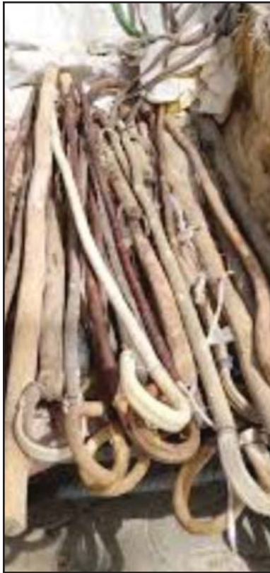
شیوه ساده و که له پوریه که ی گوجان.

پیگرتنه، که له وهرزی به هاردا کهش خوښ ده بیټ، خه لک ده چنه ناو سه وزایی و دهشت و دهر، مندالیښ چالاک ده بیټ و حه زی به که شی دهشت و دهره. به تایبه تی مندالیک به دریژی زیستان له ماله وه بوه، حه زی له کهش گورینه سه ره تای پی گرتنیته ده لین: پی بگره وهرزی به هاره، بچو نیو گول و گولزارو گزویا بو یاریکردن له به هاردا، که جیهانی سه وز پوښ کردوه. به گشتی نه گهر پیړه وکه و داره داره هه مان ته مه نی پیگرتنی مندال نه بیټ. جیاوازیه کی نه وتو له نیوان داره داره و پیړه وکه دا نییه.