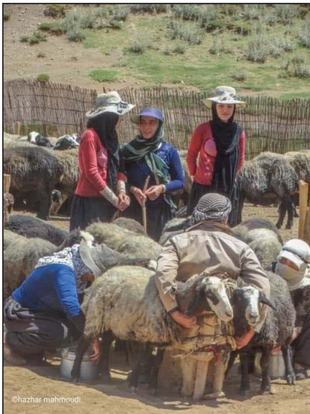
بیری و سه‌ربیری

چه‌ور ده‌کریٔ ده‌نرٔته سهر دومه‌ل یان زیبکه‌ی گه‌وره، شه‌و تابه‌یانی ده‌به‌ستری، ده‌بی شوینه‌که گهرم دابپوشری، ئه‌گهر دومه‌له‌که گه‌یبت، ده‌یته‌قینی و چل و پیسی راده‌کیشیتته دهره‌وه، چه‌ورکردنه‌که زیاتر بو ئه‌وه‌یه نیوه‌نمه‌که‌که نه‌نوسیتته پیسته‌که‌وه، که‌دوایی نیوه‌نمه‌که‌که‌ت لادا توکی پیسته‌که راناکیشیت، نیوه‌نمه‌ک ئیستا به‌کار هینانی نه‌ماوه، به‌لام له‌کاتی خویدا پوئیکی کاریگه‌ری له‌ته‌قینی دوومه‌ل و خه‌یاره‌و زیبکه‌ی گه‌وره‌دا هه‌بووه.