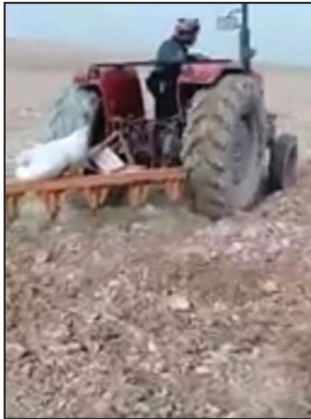
شۆو وەرد برین

دهشته کە ی گەرمیان کاکى بە کاکى چونکە تۆى لىى ئاوا بىت خاکى کەواتە کاکى بە کاکى سىفەتیکە دەدریتە پال دەشتى گەرمیان کە زۆرتەر هەردەو هەلەت و شىوو دول و بەرزو نزمیە. گەرمیان هەندى ناوچەى لە دۆلى گەورەو چالایى قولى هەزار بە هەزار پیک دیت. هەندى شوینی تریشى هەیه تەختاییە، بەلام بەگشتى کە لە بەرزاییە کەو بۆ قولایى دەشتى گەرمیان دەروانى دیمەنى سەرنج پراکیتشت لادروست دەکات، بەوہى هەلبەزو دابەزى زۆرە، جى جى تەختو جى جى شىوو ودۆلە. کاکى بەکاکیش، سىفەتیکە دەدریتە پال ئەو زەویانەى کە ناوبەناو و پچر پچر لەیەک دەچن و نیوان پارچە لەیەک چوہکان جیاوازە لە پارچە لەیەک نە چوہکان و دابراون لە یەکتى. زۆرتى رووبەرى تەختایی بى داروو دەوہنى بالا کردوہ.