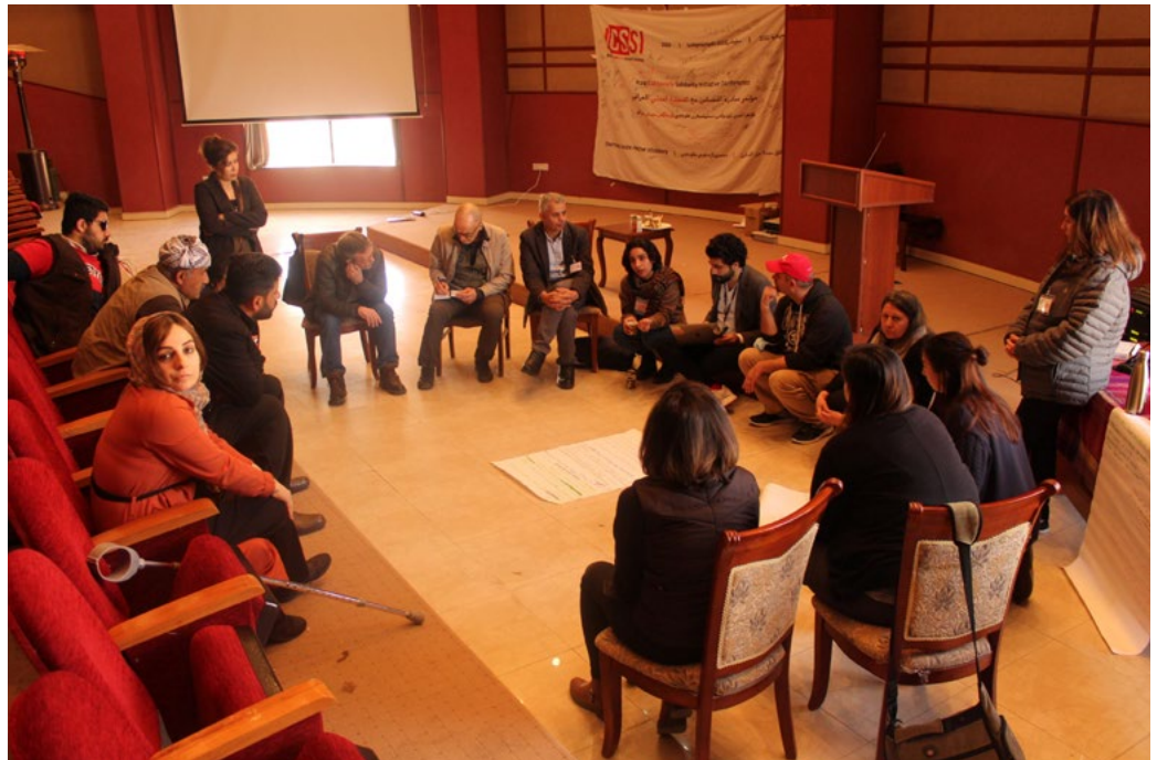
اجتماع الناشطين مع العوائل

النتائج التي قُدمت في هذا التقرير تعتمد بشكل أساسي على المقابلات التي أجراها أعضاء فرق صناع السلام المجتمعي (CPT) مع ناجين من الهجمات والأفراد والعائلات المتضررة والسلطات المحلية خلال عام 2022، والتي تم استكمالها وتأكيدتها من خلال تحليل وسائل الإعلام والتقارير التنظيمية والمؤسسية المتاحة للجمهور. تم استخراج المتغيرات ذات الصلة من المقابلات والتقارير الأخرى وترميزها في جدولين متصلين ببعضهما البعض، الأول يسرد ويصف الحوادث التي تم فيها قتل وإصابة المدنيين، والثاني يسرد تلك الخسائر التي يمكن الحصول فيها على بعض البيانات الشخصية أو الديموغرافية لهم. تحتوي مجموعة بيانات الحوادث (الملحق 2) على صف واحد لكل حادث موثق. تمثل الأعمدة المتغيرات المسجلة، بما في ذلك تاريخ الحادث ووقته، والموقع، والحد الأدنى والحد الأقصى لعدد القتلى والجرحى، والأسلحة المستخدمة. ويُسجّل الحد الأدنى لعدد القتلى أو الجرحى على أنه صفر عندما يكون هناك عدم اليقين بشأن (أ) الوضع المدني أو العسكري للضحية، و(ب) إمكانية العد المزدوج لنفس الضحية في حادثين مسجلين بشكل منفصل، و(ج) ما إذا كانت القوات المسلحة التركية قد تسببت في الضرر. عندما يوجد عدم يقين أو خلاف بين المصادر حول عدد