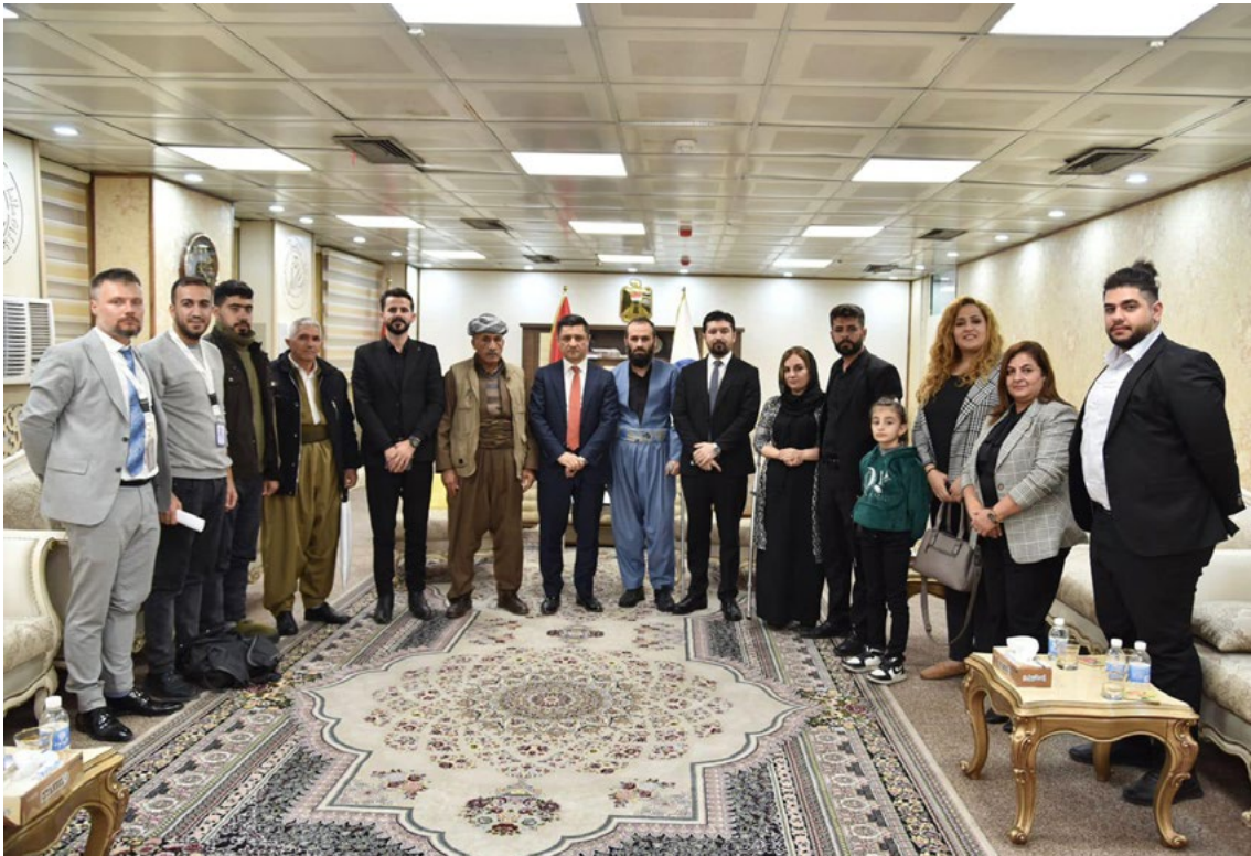
وفد من حملة انهوا القصف عبر الحدود يجتمع مع وزير العدل العراقي في بغداد في 28 تشرين الثاني 2022.

تم تنفيذ عمليات عسكرية متعددة خلال العام، مما أدى إلى مقتل 18 شخصاً أو أكثر، وإصابة أكثر من 50. وعلى الرغم من أن وسائل الإعلام أفادت بأنه تم قتل وجرح مدنيين وأفراد من الأجنحة المسلحة لأحزاب المعارضة، إلا أن مؤلفي هذا التقرير لم يتمكنوا من تأكيد هوية ووضع الضحايا المدنيين أو الناجين. وفقاً