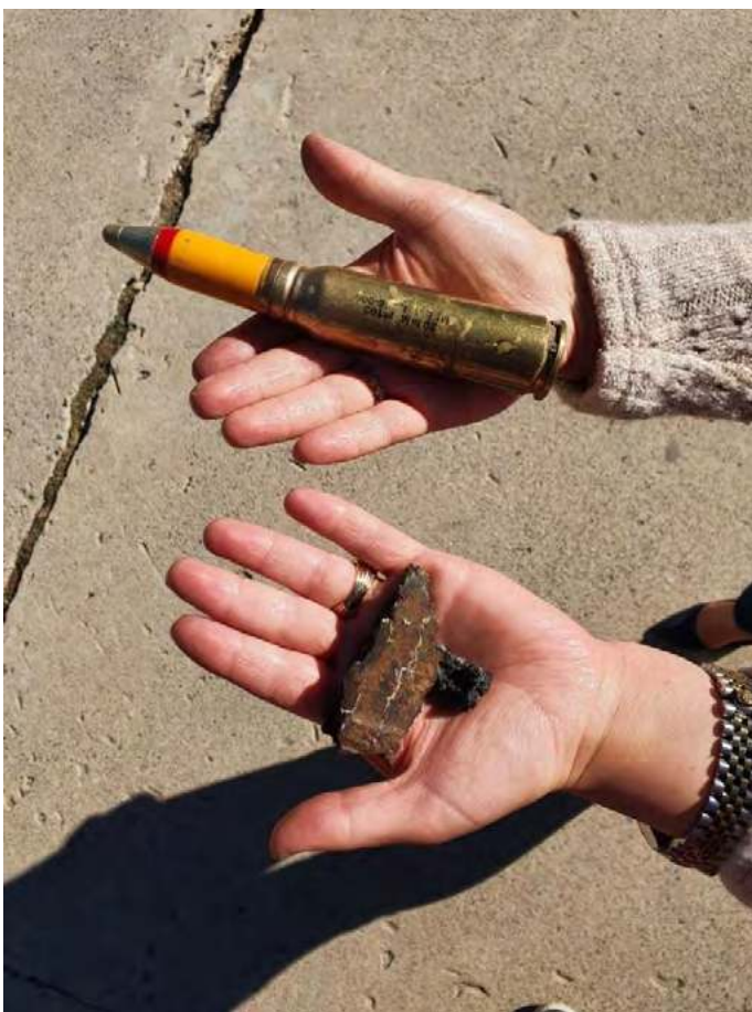
مامۆستايەك، پارچەيەكى بۆردوومان و گولەيەكى نەتەقيو كە پاشماوھى ھيرشەكانى توركيان بۆسەر گوندى ھرورى نيشاندەدات. تشرينى دووھى ۲۰۲۱.

لەپال كوشتن و برينداركردى ھاوالاتيانى مەدەنى باكورى عيراق، بۆردوومانەكانى سوپاي توركيە و داگيركارى ناوچەكانى سەر سنور بوونەتە ھۆى زيانى ماددى، ويړانبوونى خانو، لەناوچوونى كاسپى و تيكچوون و ويړانبوونى ئەو كيلگانەى كە بۆ كشتوكال و لەوھراندى ئاژەل بەكاردەھيندرين. ئەم ھيرش و ئۆپەراسيۆنە، بوونەتە ھۆى چۆلبوونى لانى كەم ۵۰۰ گوند و كۆچكردى گوندنشينان بەرەو شارەكان و دروستبوونى قەيرانى مروپى.