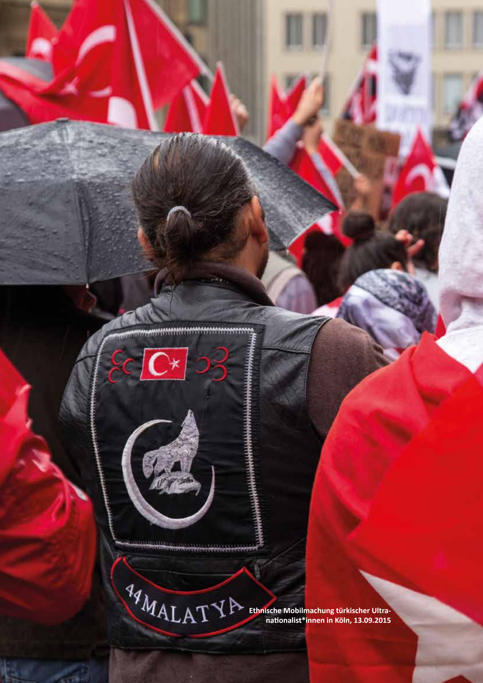
Ethnische Mobilmachung türkischer Ultra-nationalist*innen in Köln, 13.09.2015