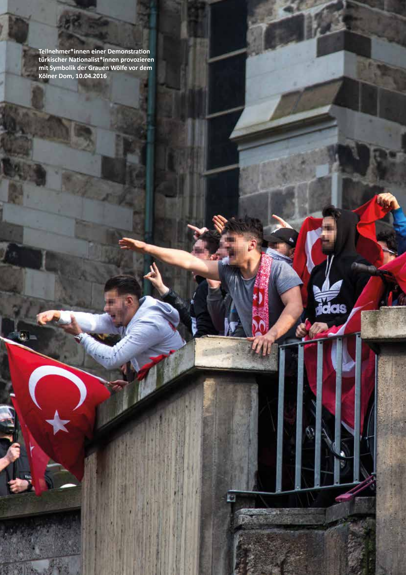
Teilnehmer*innen einer Demonstration türkischer Nationalist*innen provozieren mit Symbolik der Grauen Wölfe vor dem Kölner Dom, 10.04.2016