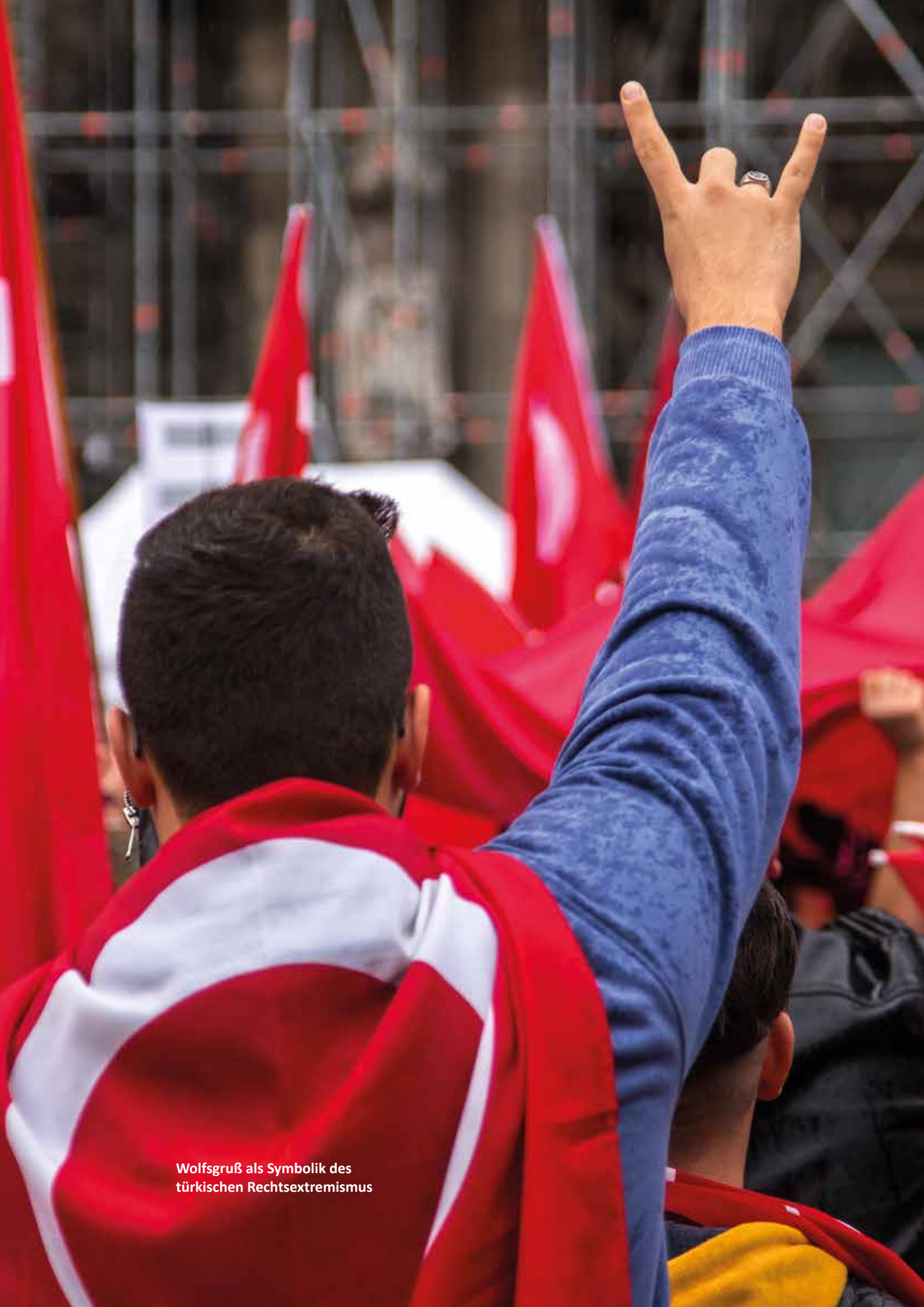
Wolfsgruß als Symbolik des türkischen Rechtsextremismus