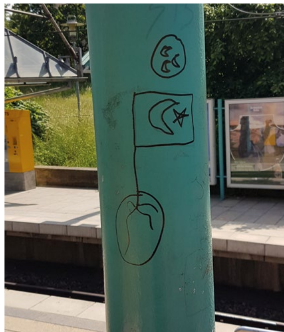
Schmiererei an einer Stuttgarter U-Bahn-Haltestelle. Die drei Halbmonde sollen die Einheit der Turkvölker (Reich Turan) symbolisieren und werden unter anderem von der extrem rechten türkischen Partei MHP verwendet.

In Baden-Württemberg unterteilte sich die Organisation der ADÜTDF bis 2022 in drei Regionen: den Großraum Stuttgart, den Bodenseeraum und