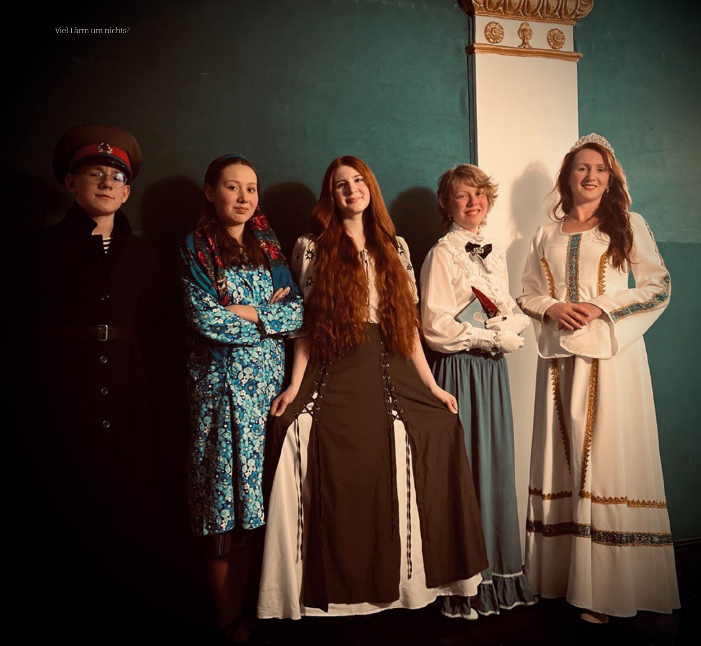
Auftritt der Jugendtheatergruppe „Meine Leute“ beim Internationalen Schul- und Jugendfestival im Deutschen Staatstheater Temeswar/Timișoara, Rumänien.