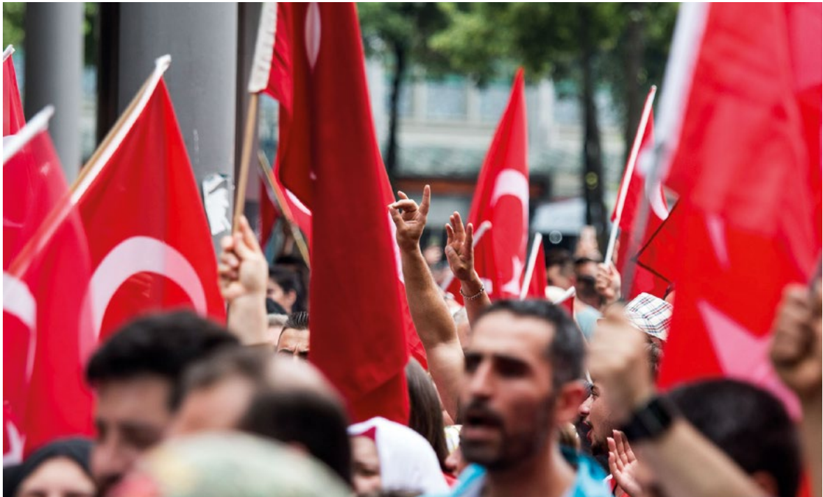
Ein*e Teilnehmer*in einer türkisch-nationalistischen Demonstration in Mannheim am 24. Juli 2016 zeigt den Wolfsgruß der Grauen Wölfe (Bozkurtlar).