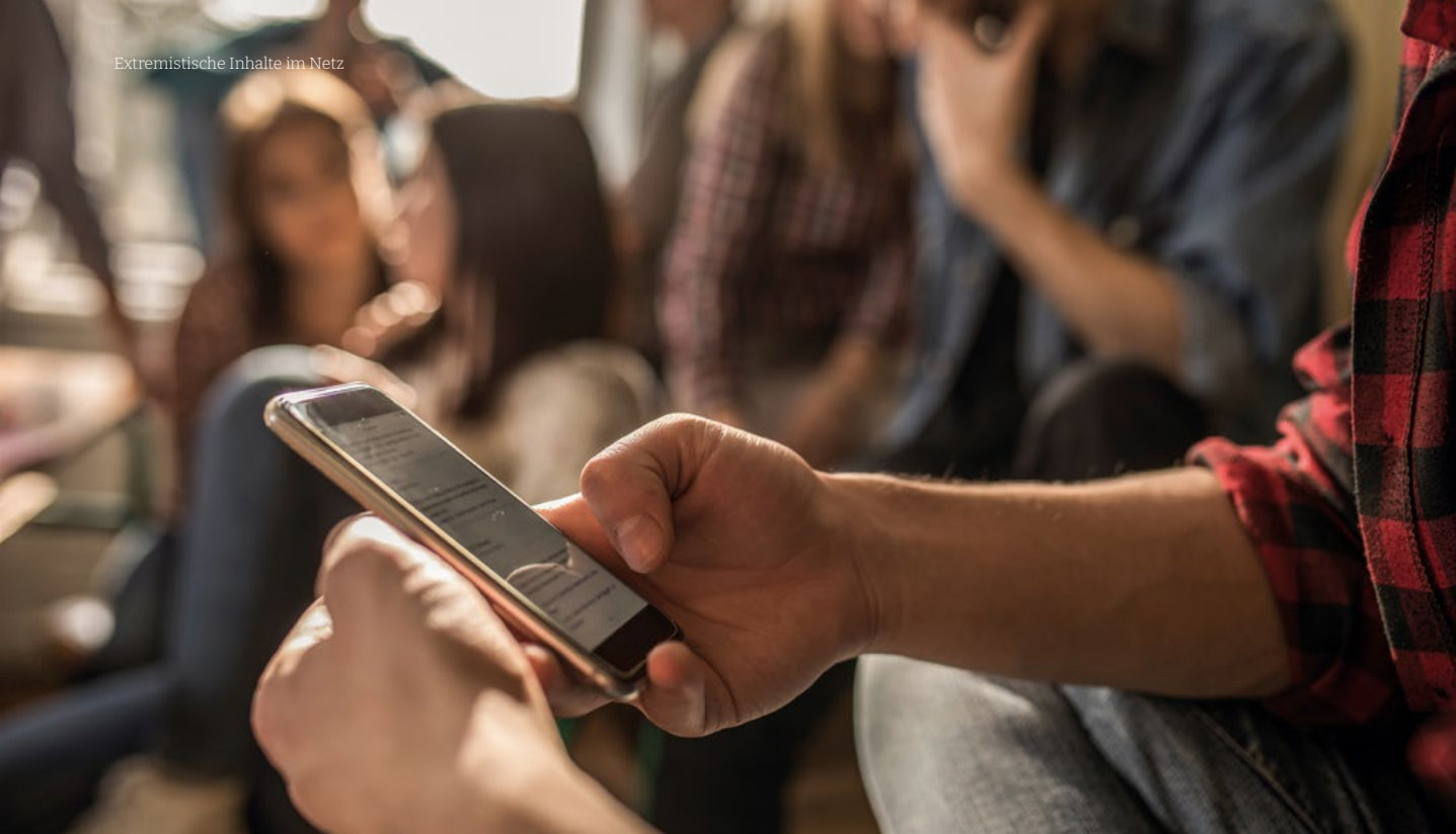
Radikalisierung durch Online-Medien? (Symbolbild)

Internet auch in Radikalisierungsprozessen eine wichtige Rolle. Es ist allerdings nicht zu trennen von den vielschichtigen Bedürfnissen, Erfahrungen und sozialen Interaktionen, die den Alltag von Jugendlichen und jungen Erwachsenen prägen. Das Internet ist keine separate Sphäre, sondern durchdringt die verschiedenen Facetten jugendlicher Lebenswelten.