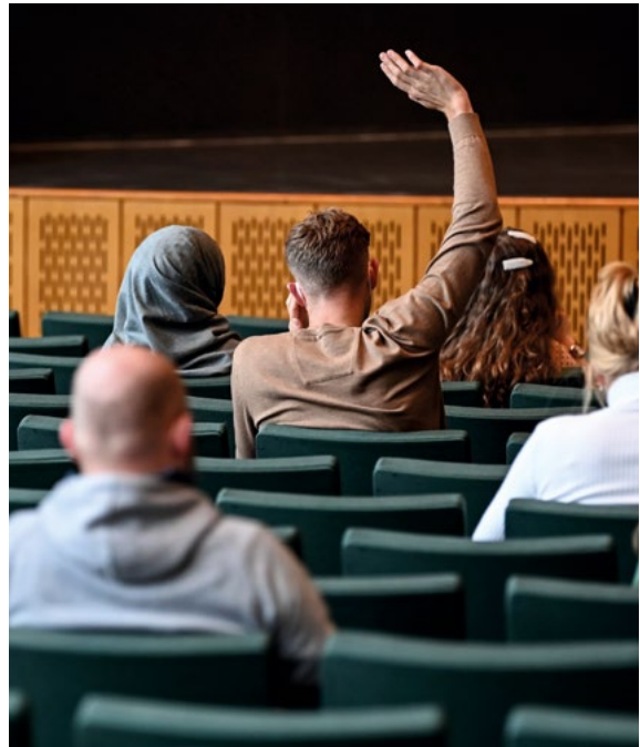
Studierende sitzen im Hörsaal einer Universität. (Symbolbild)

Türkei sowie ihre migrationsbedingte Fortsetzung in Deutschland thematisieren (vgl. Arslan 2009 und Bozay 2009). So ist rassismuskritisch ausgerichtete Soziale Arbeit herausgefordert, dieses Wissensrepertoire in ihrem Arbeitsalltag durch praktische Methoden zu implementieren. Werden eine Bewältigung und Abschwächung der rassistischen Denk- und Handlungsformen angestrebt, indem den Jugendlichen demokratische