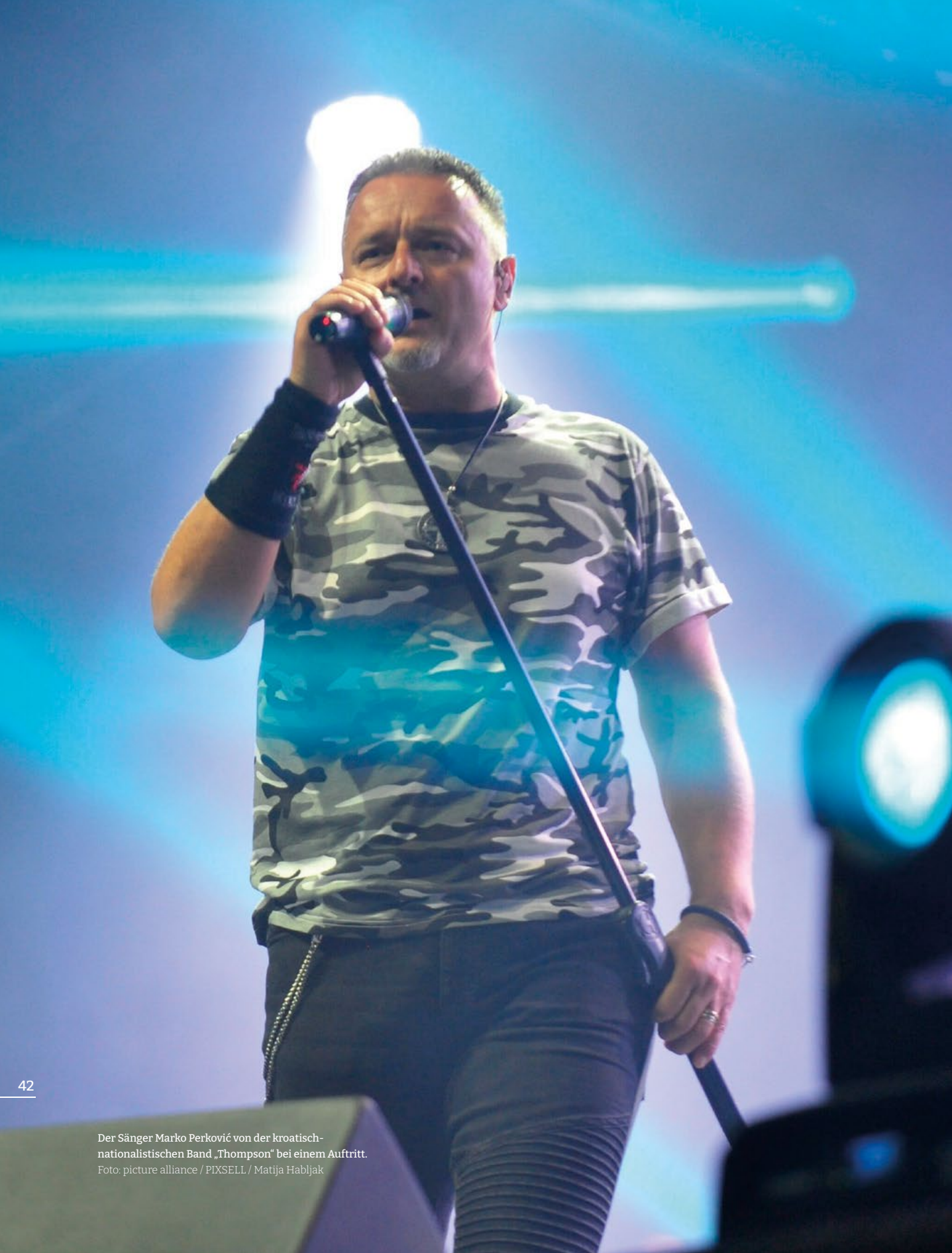
Der Sänger Marko Perković von der kroatisch-nationalistischen Band „Thompson“ bei einem Auftritt.