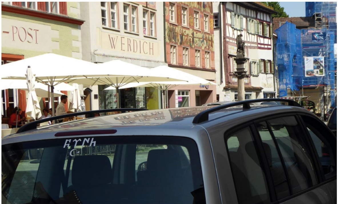
Auf der Heckscheibe eines Autos in Wangen im Allgäu ist das Wort „Türke“ in alttürkischer Schrift aufgeklebt. Diese Orkhon-Runen werden häufig von Grauen Wölfen verwendet.

In der parteipolitischen Geschichte des türkischen Rechtsextremismus nimmt die MHP eine wichtige Rolle ein. Sie bildet die zentrale Basis für die Graue-Wölfe-Bewegung. Die MHP entstand als nationalistische Massenpartei in den 60er-Jahren während des Kalten Krieges. Ihr ideologisches Fundament ist der „idealistische Nationalismus“ (Ülkücü Milliyetçilik) mit ausgeprägtem Rassismus → , Antisemitismus → und einer antidemokrati-