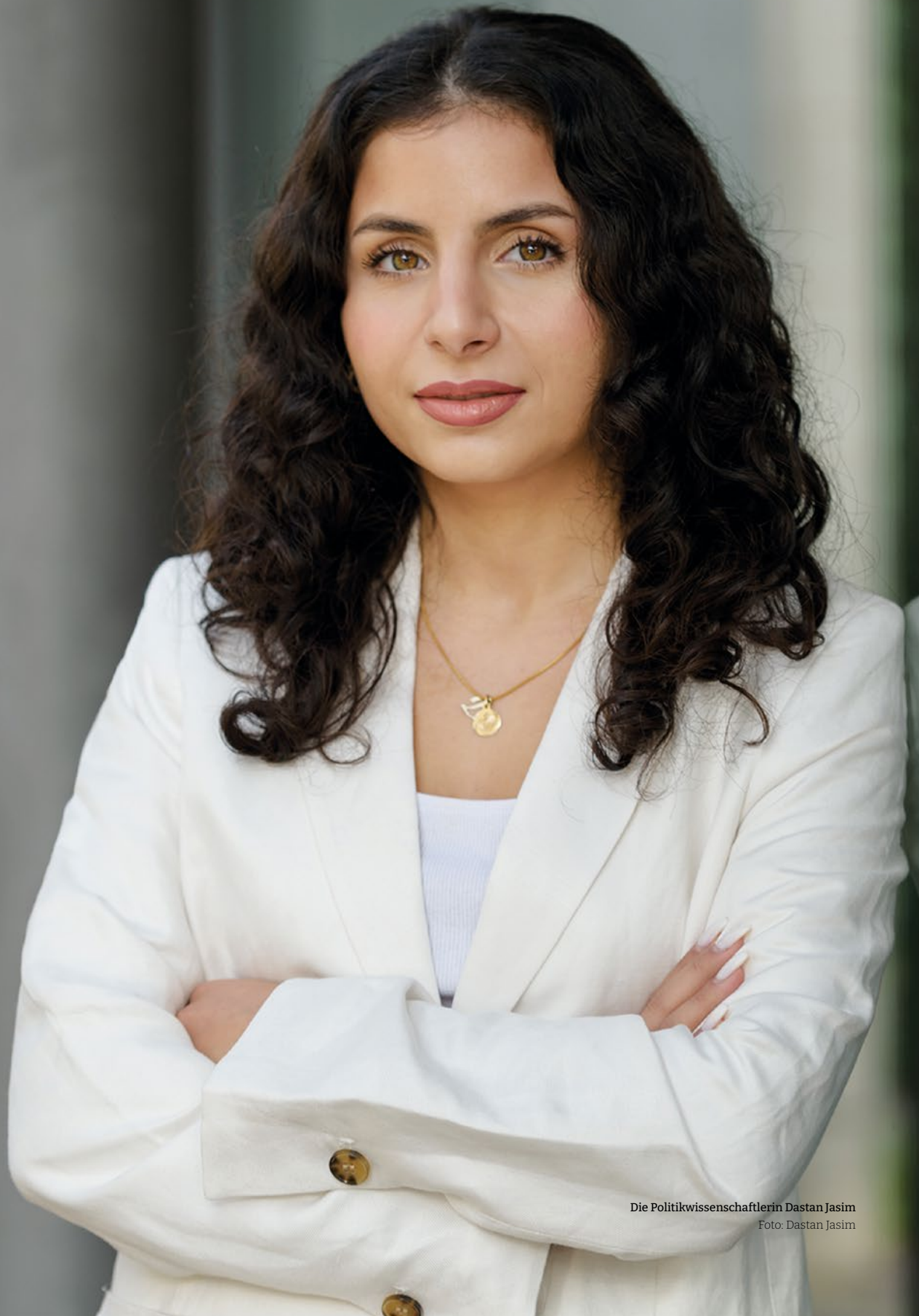
Die Politikwissenschaftlerin Dastan Jasim Foto: Dastan Jasim