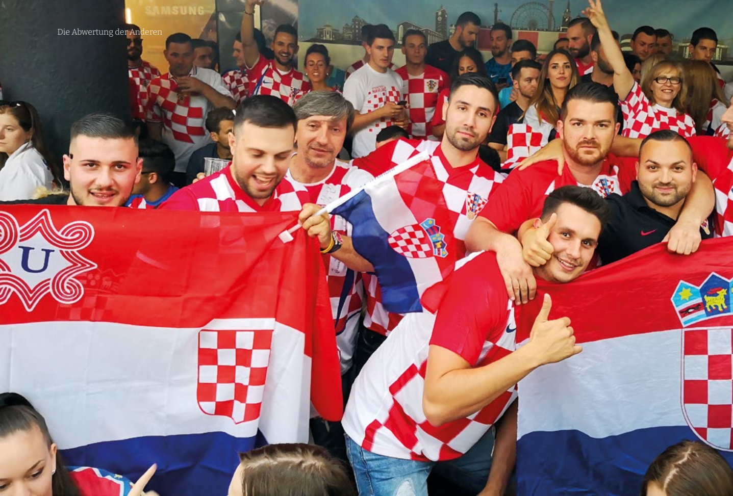
Kroatische Fußballfans schwenken in Stuttgart zur WM 2018 die Ustaša-Flagge. Sie ist am charakteristischen U erkennbar. Bei dem Wappen mit einem ersten weißen Feld handelt es sich um ein historisches Wappen, welches jedoch aus Gründen der Abgrenzung zum Ustaša-Staat nicht mehr offiziell gebraucht wird.