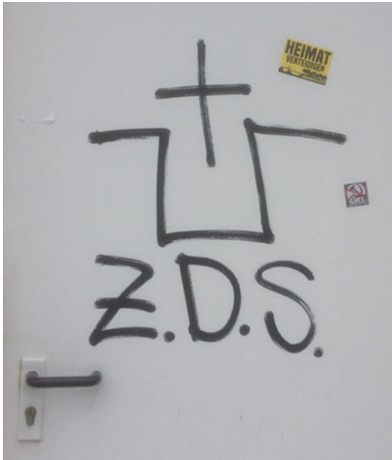
Oft als Schmiererei zu sehen: Das Ustaša-U mit einem Kreuz darüber. Die Abkürzung Z.D.S. steht für „Za dom spremni!“ („Für die Heimat bereit!“), dem Gruß der faschistischen Ustaša.