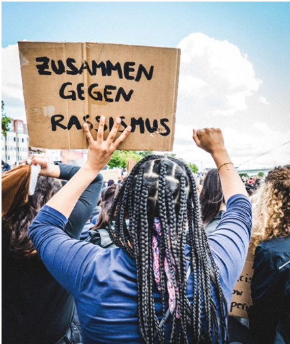
Protest gegen Rassismus

An dieser Stelle ist es wichtig zu erwähnen, was wir unter Rassismus verstehen. Rassismus ist ein machtvolleres, soziales, strukturierendes Phänomen, welches Menschen aufgrund ihres Äußeren, ihres Namens, ihrer (vermeintlichen) Kultur, Herkunft oder Religion abwertet und damit Zugänge zu gesellschaftlichen Ressourcen erschwert oder verhindert. Wohnraum ist hier ein Beispiel, Gesundheitsvorsorge oder Bildung sind weitere Bereiche.