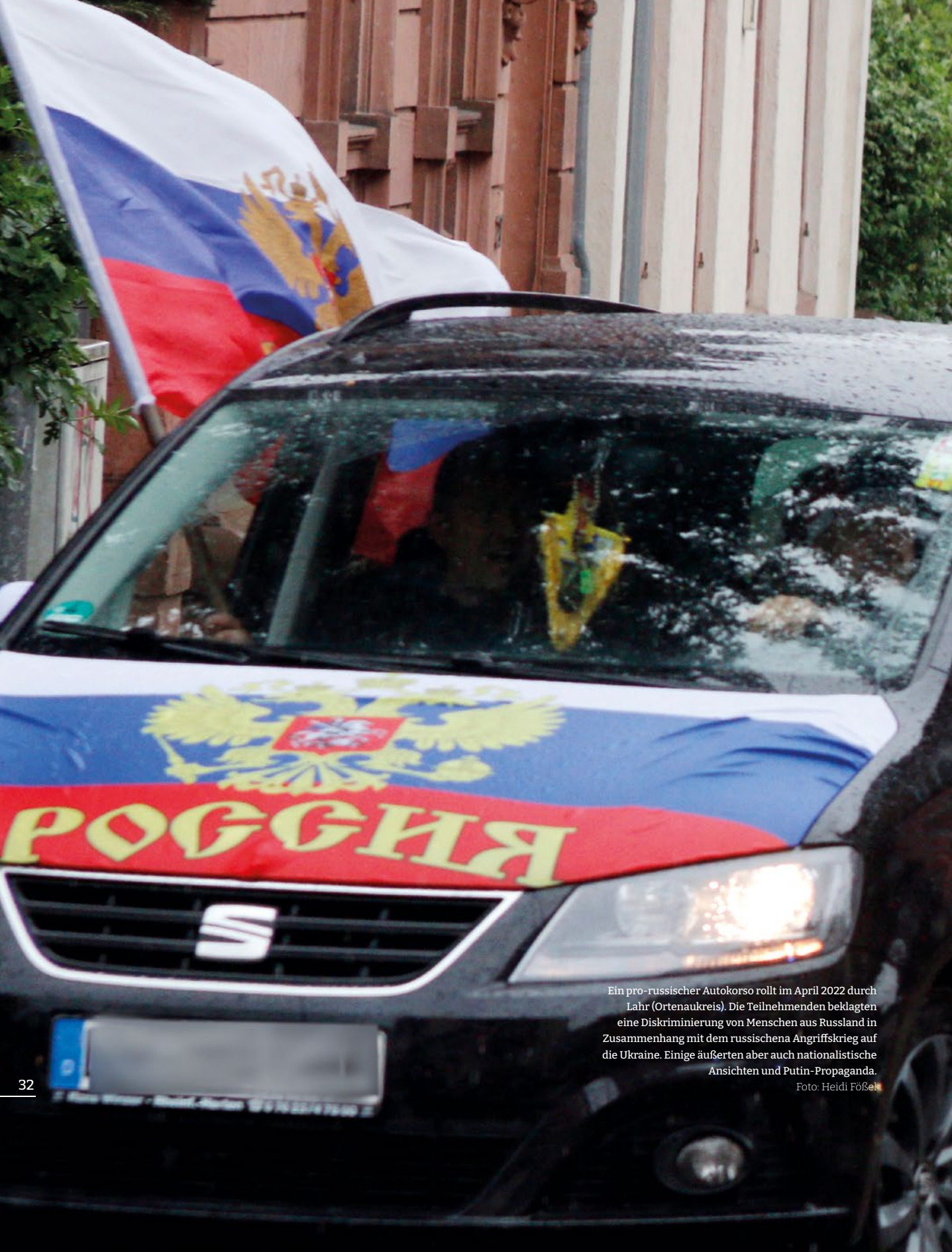
Ein pro-russischer Autokorso rollt im April 2022 durch Lahr (Ortenaukreis). Die Teilnehmenden beklagten eine Diskriminierung von Menschen aus Russland in Zusammenhang mit dem russischen Angriffskrieg auf die Ukraine. Einige äußerten aber auch nationalistische Ansichten und Putin-Propaganda.