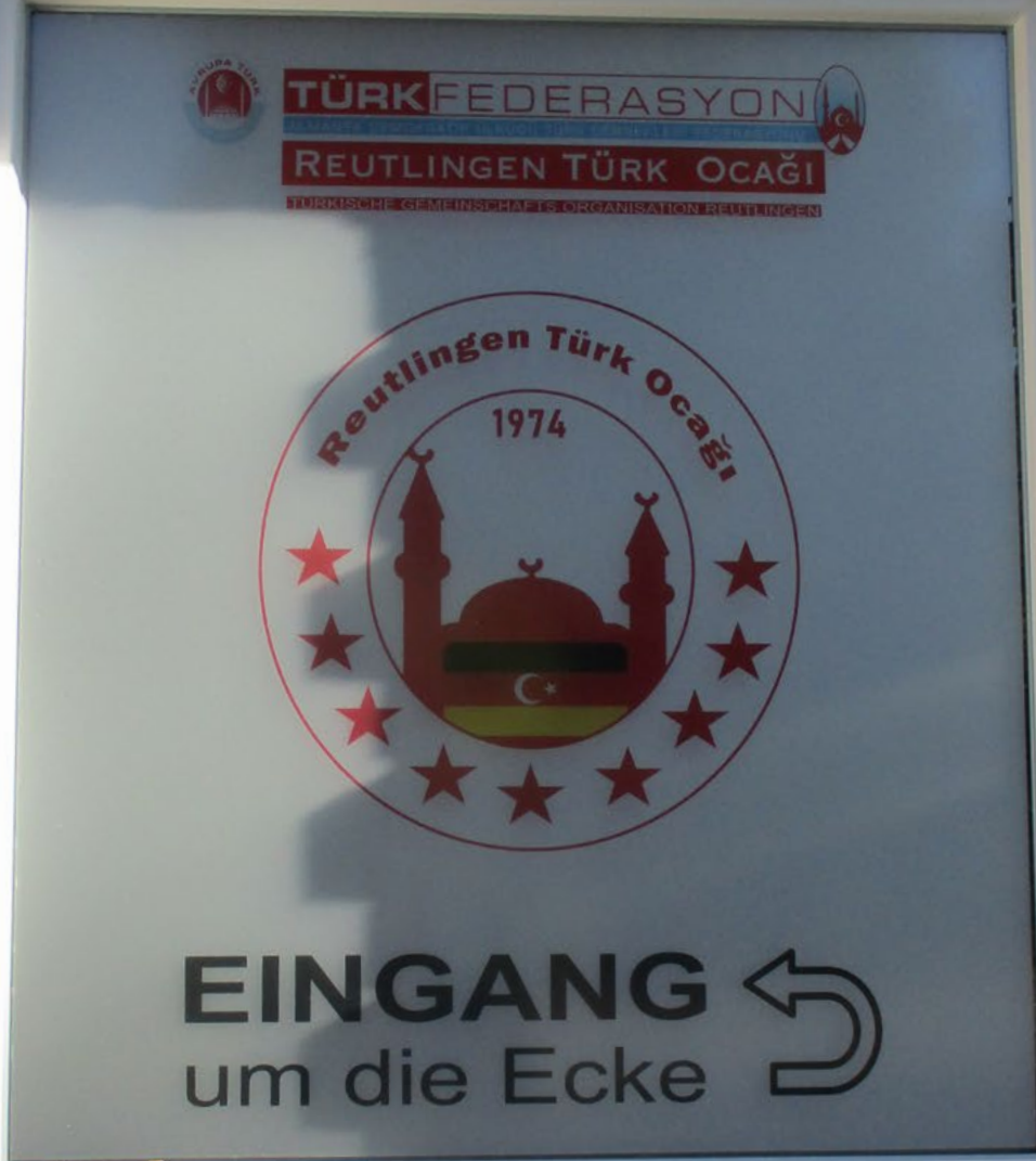
Sitz des Reutlinger Ablegers der ultranationalistischen „Föderation der Türkisch-Demokratischen Idealistenvereine in Deutschland“