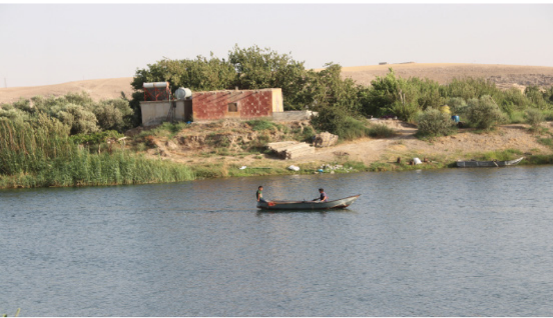
قرية جزيرة السد-الطبقة 2023 ، سبتمبر