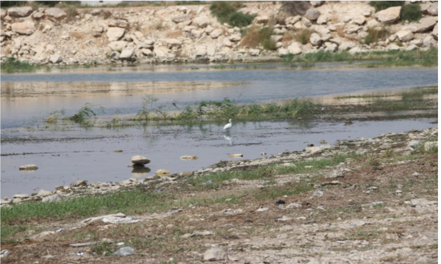
جسر قرقوزاق-منبج سبتمبر 2023

ففي فصل الصيف سيزيد معدل التبخر وتزداد الحاجة إلى المياه، سواء للشرب أو الري، وسيدق ناقوس الخطر، لأن الوضع سيئ، إذ لم يبقَ إلا القليل، وتصل المياه إلى المنسوب الميت في سد تشرين، أي توقف السد وتوقف إنتاج الطاقة الكهربائية وتوقف مضخات الري والشرب، وهذه كارثة إنسانية مقبلة.