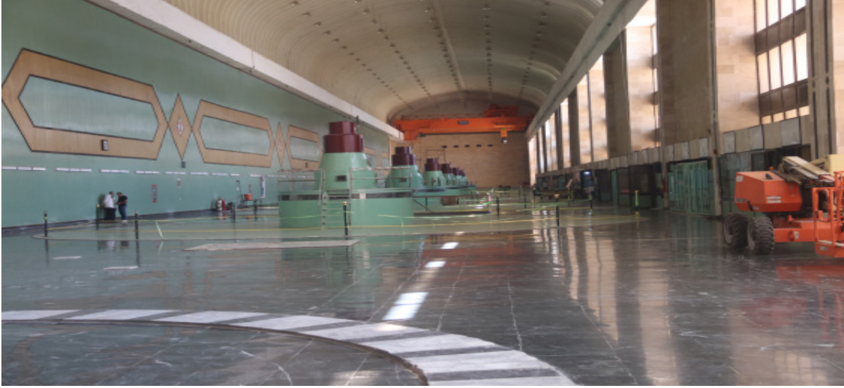
عنفات سد تشرين-منبج سبتمبر 2023

وفي محطة الكهرباء التابعة لسد الفرات، التي تضم 8 مجموعات توليد، تم إخراج 4 منها بشكل نهائي بسبب الأعمال التخريبية، بينما تم إعادة تشغيل 4 منها. ونظراً للوارد المائي الضئيل من الجانب التركي، يتم تشغيل مجموعة واحدة أو مجموعتين فقط بطاقة متدنية. وبسبب هذا التحدي، تصل القدرة الفعلية لكل مجموعة إلى 110 ميغاواط ساعي. وفي الوقت الحالي، يتم تشغيل مجموعة واحدة أو مجموعتين بقدرة تتراوح بين 40 و 50 ميغاواط ساعي.