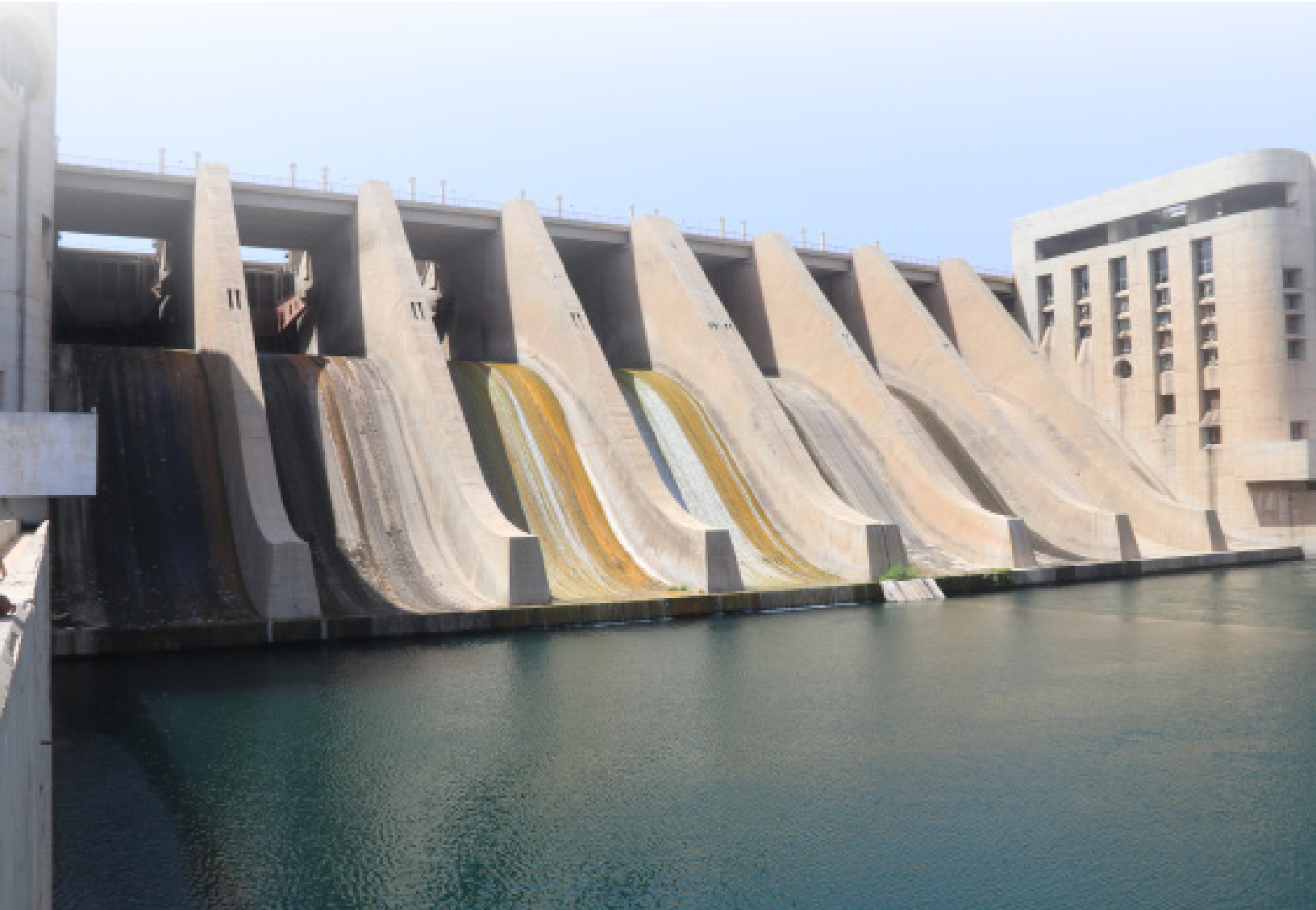
سد الفرات، الطبقة، سبتمبر 2023