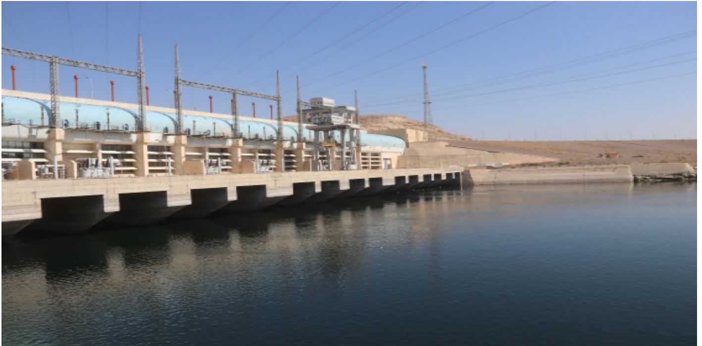
سد تشرين-منبج سبتمبر 2023

منذ ما يقارب أكثر من (30) شهراً بشكل متواصل، تقوم الدولة التركية بحبس مياه نهر الفرات، لتصل المياه إلى مستوى قياسي، حيث تم استنفاد كافة مخازن البحيرات في سابقة لم تحدث في تاريخ جريان النهر منذ بناء السدود، وعملياً وصل إلى المنسوب الذي في بعض الأماكن يتطلب إيقاف سد التشرين تماماً، حيث خرجت أغلب محطات الضخ عن الخدمة، سواء كانت محطات الضخ الخاصة بمياه الشرب أو مياه الري أو السدود التي قد توقف عملها أكثر من مرة، نتيجة انخفاض الوارد واستنفاد كامل لخزان البحيرات، سواء كان في بحيرة سد تشرين أو في بحيرة سد الفرات.