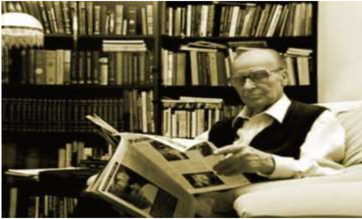
ساته کانی پشوساتی گه شت به مه عریفه تدا