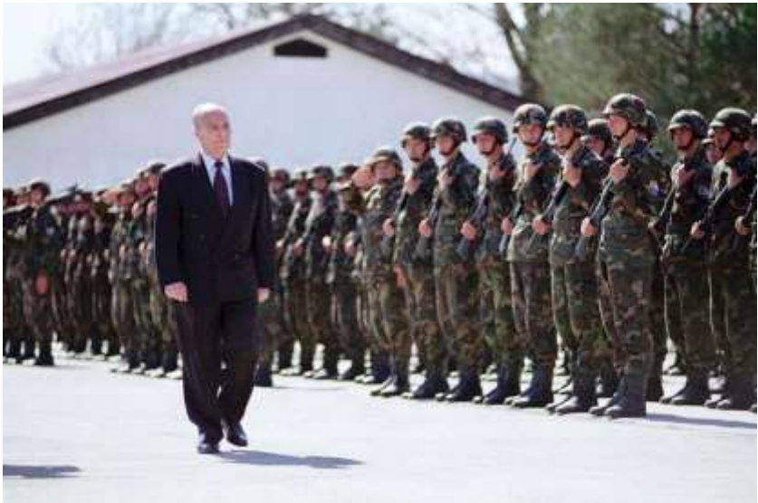
سهرکردهی ولاتیک له قونایی پیلانگییرانی سهردهمی مؤدیرنه دا