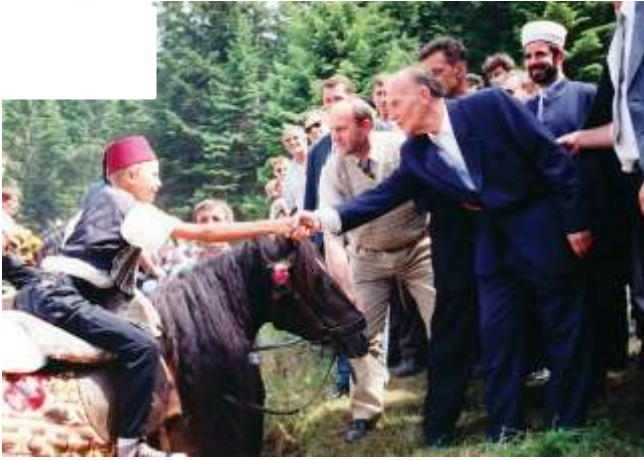
هاندانی پیاوانی سبهینی