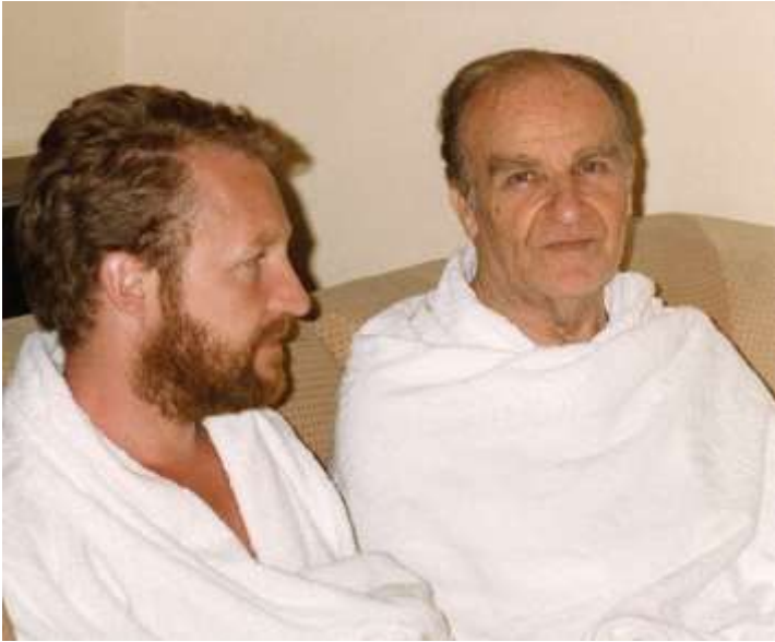
لهوهرزی پاك بونه‌وهی روحی به‌فرین