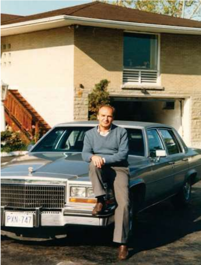
خاکی بون و سیمای پیپون