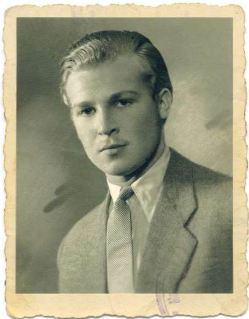
لاويہ تی لہ خزمہ تی باوہر و گہ لدا