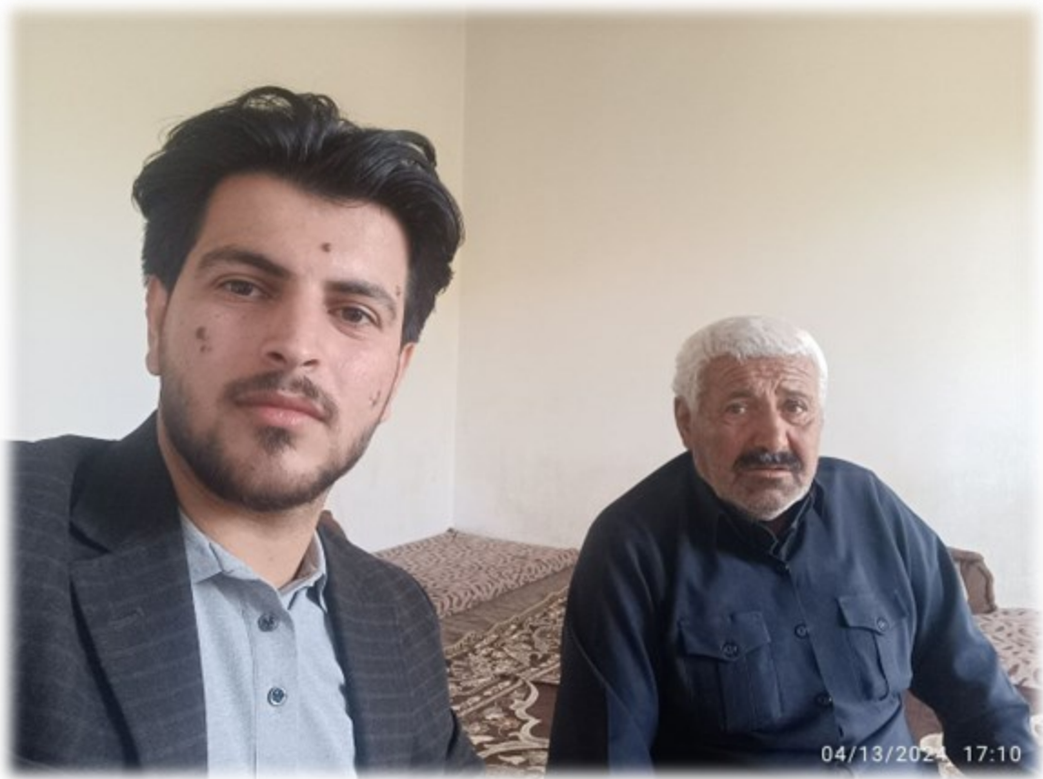
تویژه لهگهڵ مام (خدری برادۆستی) نامیڕژهنی جوتزهله