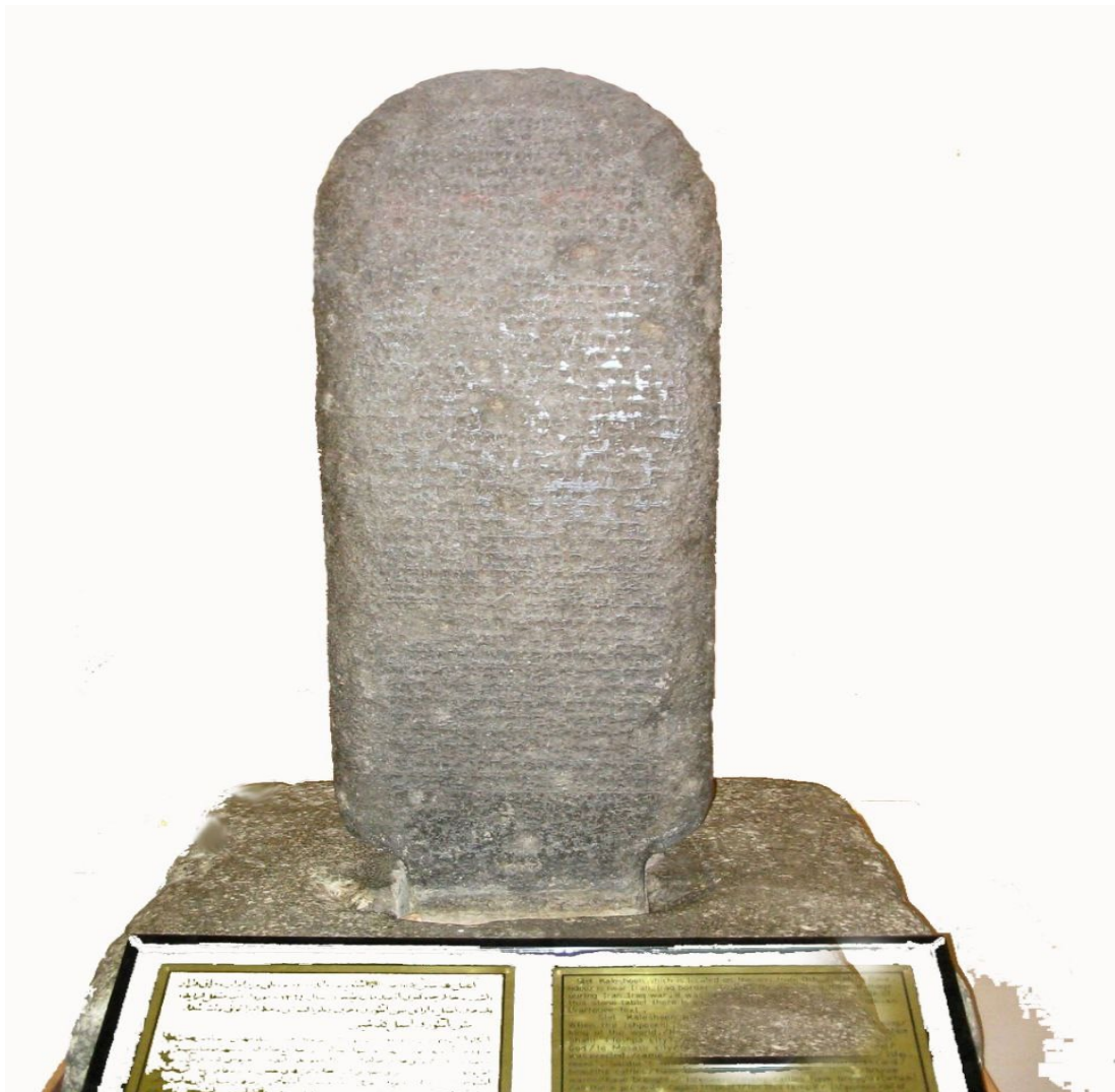
وینه‌ی به‌ردی کیله‌شین