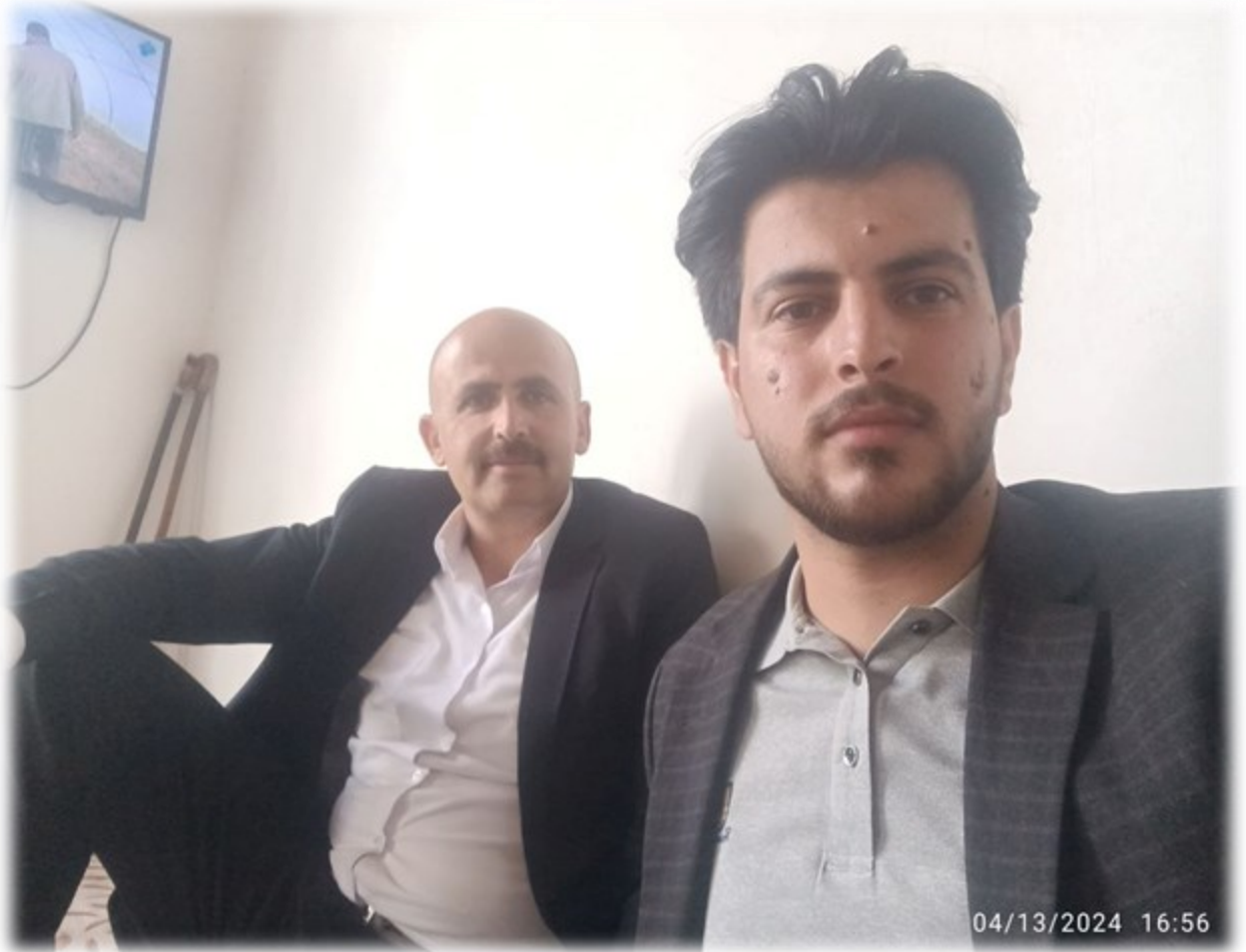
وینہی توپژہر لہگہل ماموستا (جابر برادوستی)