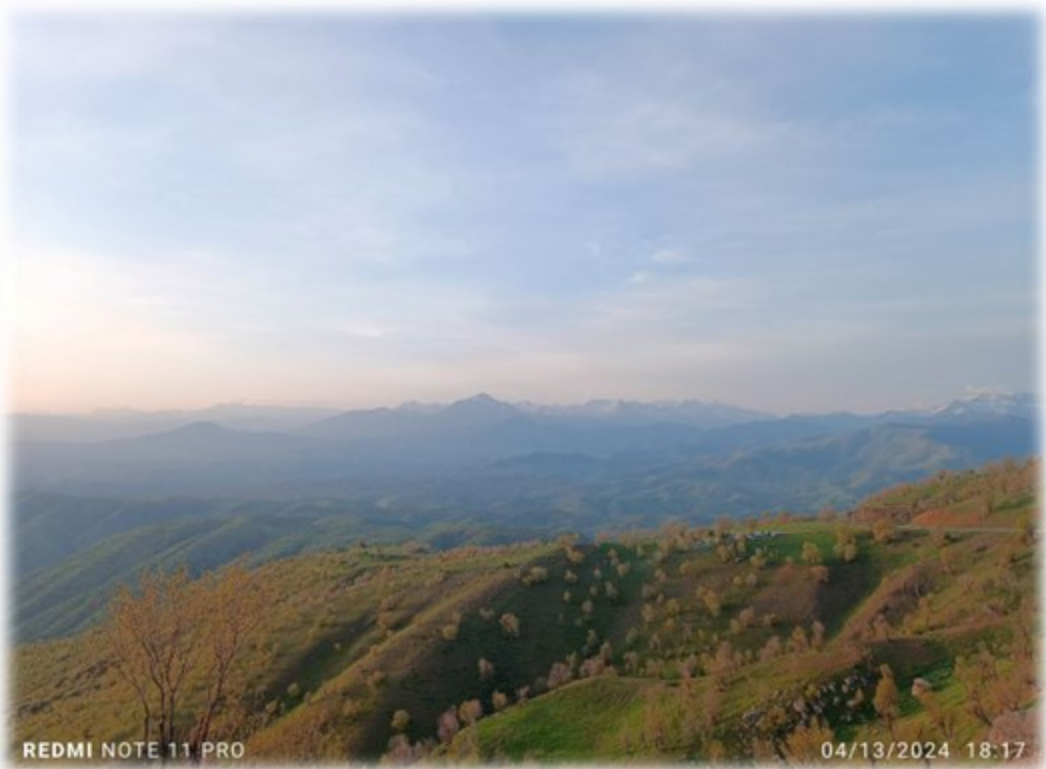
سروشتی دهقەری برادۆست