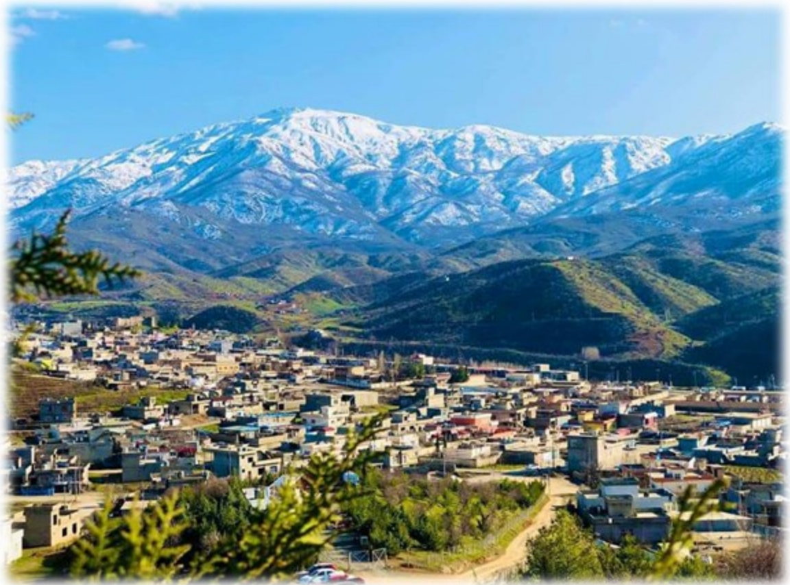
دهقەری برادۆست / سیدەکان