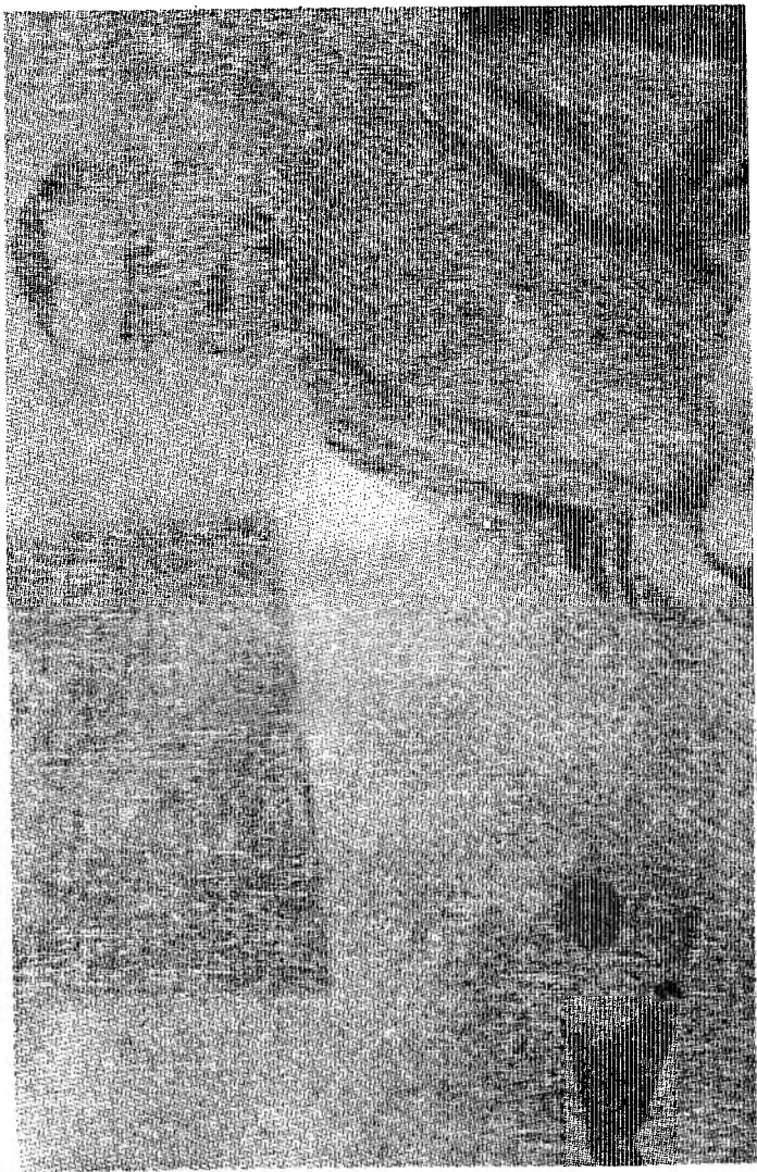
KADI MUHAMMED İran Kürdistan Demokrat Partisi (İ-KDP)'nin ilk başkanı