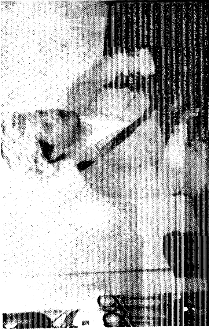
MESUT BARZANI Mustafa Barzani'nin ođlu ve halen I-KDP'nin genel başkanı