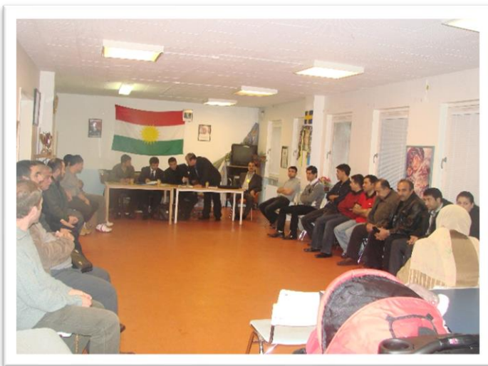
كۆبوونه وهى كۆمىته و كه رتى ئىسكلوستونا