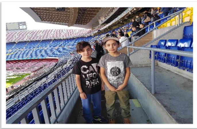
هاویر و هاوژیر له یاریگای کامپ نوو، بهرشلونه