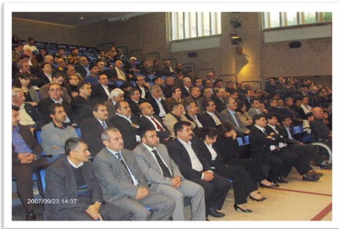
کۆبۆنۆهۆی مه کتهبی رێکخستن و کۆمیته