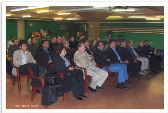
کۆبۆنۆهۆی مه کتهب رێکخستن و کۆمیته و کهرتی مالمۆ و به شیک له رێکخستنه کان