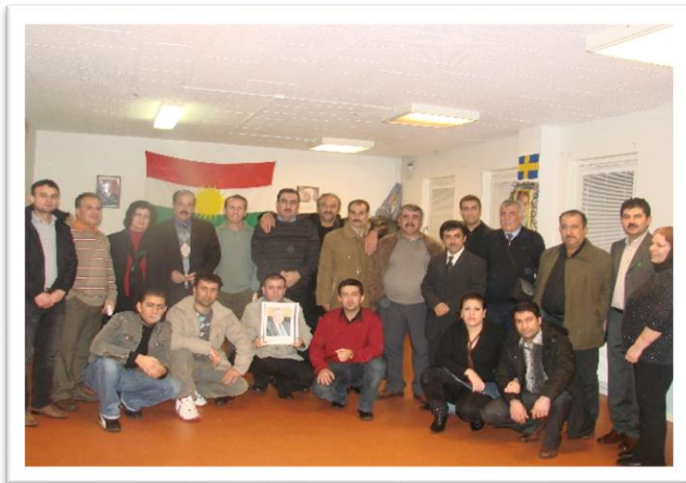
هه‌فالانی کهرتی ئیسکلیستونا