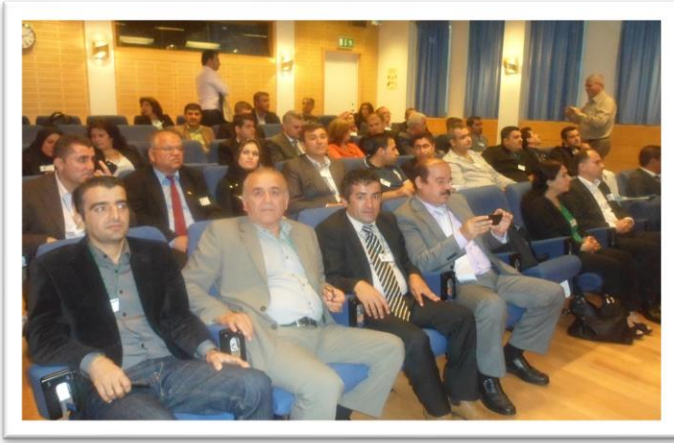
له گهڻ ژماره يه ک هاوړئ، سويد.