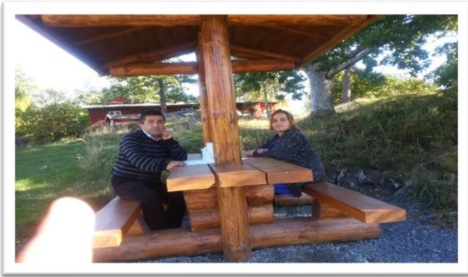
سه‌یرانگای کالبیری سوید، خۆم و گه‌لاویژ