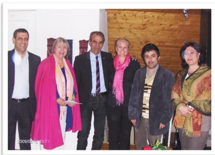
کاندیدانی پارته جیاوازه کانی سوید