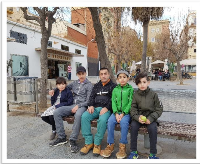
له راسته‌وه: هاوژیر، هاویر، هاویر، ریبن، دیتی