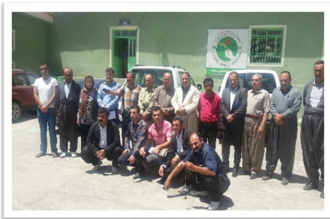
کۆمیتە ی ماوەت