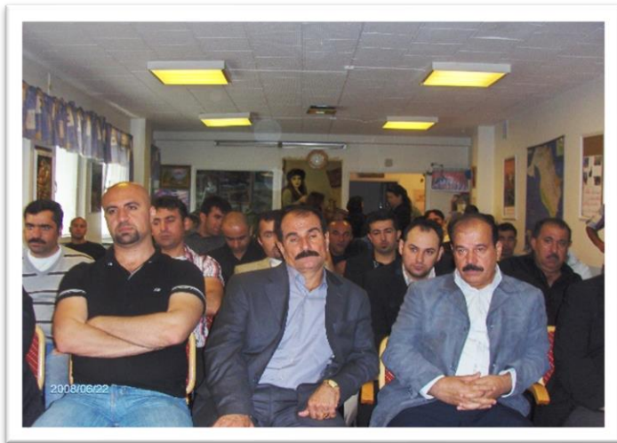
کۆبوونه وه مان له گهڵ کهرتی ئیسکلیستونا