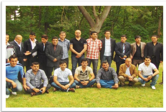
هه قالانی کۆمیته و لینشیۆپینگ و نۆرشۆپینگ