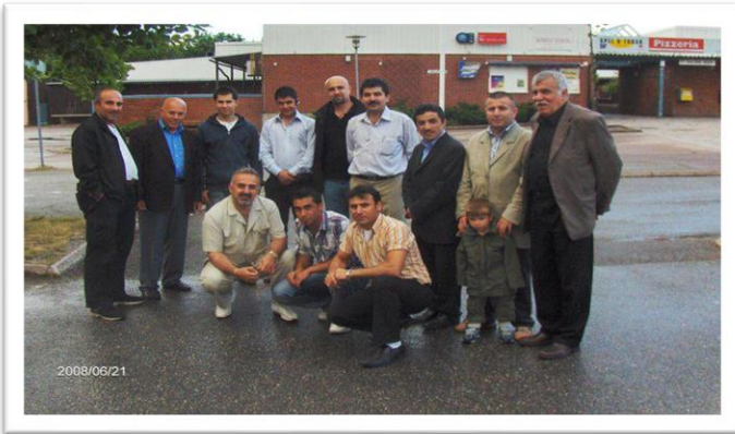
له گهڻ ژماره يه ک هاوړئ، ئيسکليستونا، سويد