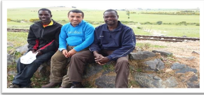
سادانی ناشیونال پارک له ولاتی تانزانیا