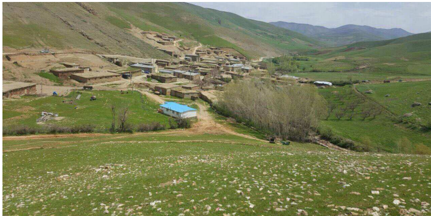
گوندی یارانالی، شوینی له دایک بونی فاتیحی شاعیر