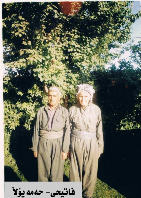
فاتیجی - جه‌مه پولا