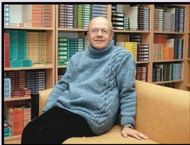
نووسینی نیسماعیل بیشکچی *