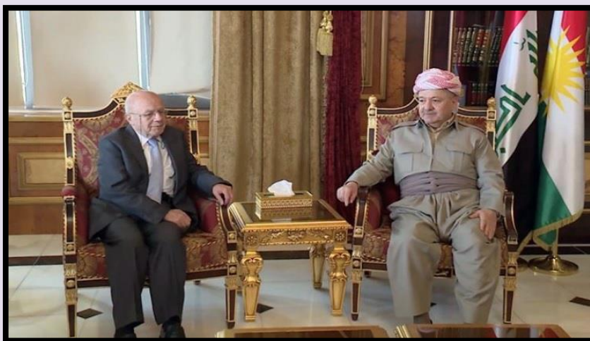
دیداریکی سەرۆک بارزانی لەگەڵ نیسماعیل بێشکچی

تێروانیی شا لەبارەى کوردەووە بەو شیۆهیه بوو: "کورد با لە دژی عێراق بن بەلام هەرگیز با سەرنەکەون". هەر بۆیهش ئەو هاوکارییه کەم و بچووکانەى لە ئیسرائیلەووە بۆ کورد دەهاتن، لەبەر ئێران بە تەواوی نەدەگەیشتنە دەستی کورد. من لەو باوەردام کە ئەمە کاریگەرییهکی گەورەى لەسەر خەڵک و شۆرشى ئیلوول دروست کرد.