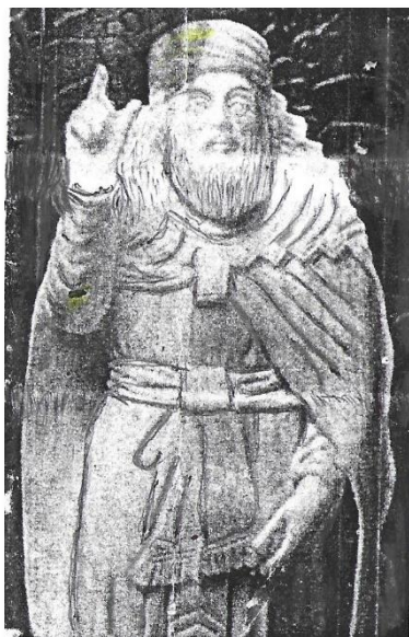
وینه‌ی ( زه‌رده‌شت ) په‌یامبه‌ری دیری‌نی کورد

یونانی وهك زانیومانه به‌ریزتان له‌سەر ریگهی باوهری یه‌کتا په‌رستین و ته‌نیا یه‌زدانی گه‌وره ده‌په‌رستن و دژی هه‌مو هاوبه‌ش دروستکردنیکن بو‌یه‌زدانی مه‌زن و هه‌ر بو‌چه‌سپاندنی ئه‌م باوهره‌ پیرۆزەتان ته‌شریفتان هیناوه‌ بو‌ ئی‌رانی گه‌وره و سه‌رجه‌م وولاتانی سه‌ر ڤووی زه‌وی , به‌وپه‌ری شانازیوه‌ ده‌ئیم خۆم و هۆزه‌که‌م و ئه‌و خه‌ڵکانه‌ی له‌ته‌که‌مان , له‌ باب و با‌پیرا‌نمانه‌وه‌ هه‌ر له‌سه‌ر ئه‌م ئاین و باوهره‌ پیرۆزه‌ین یه‌کتا‌په‌رست بو‌ینه و هه‌ر یه‌کتا‌په‌رست ده‌مینین تا ئه‌و رۆژه‌ی یه‌زدانی مه‌زن کو‌تا به‌م گیتییه‌ دینیّت , جگه‌ له‌ یه‌زدانی مه‌زن که‌سی دیکه‌ به‌ په‌روه‌ردگار و خوا نازانین , به‌ریز جه‌نابی ( ئه‌سکه‌نده‌ر ) ی مه‌قدونی , ئاینه‌که‌ی ئی‌مه‌ و په‌یامبه‌ره‌که‌مان ( یوشا زه‌رده‌شت ) جه‌رام و قه‌ده‌غه‌ی کردوه‌ لی‌مان دژ به‌ یه‌کتا‌په‌رستان بجه‌نگین له‌هه‌موو کات و سه‌رده‌می‌کدا قه‌ده‌غه‌یه‌ .