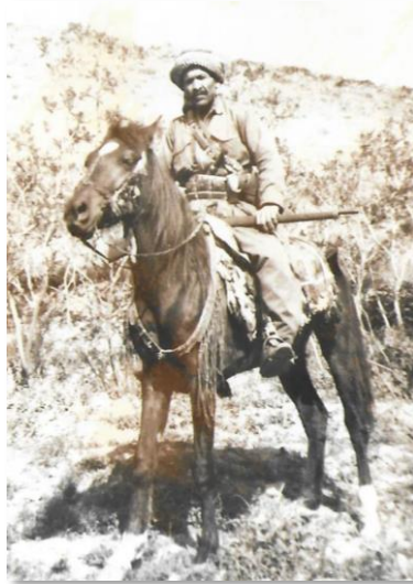
ویینه ی حاجی علی رهزا فتاح زهنگه نه

سوارچاکی کورد نه وه ی ( نه وشيروان ) به چکه شیړه که ی ماچۆی زمان