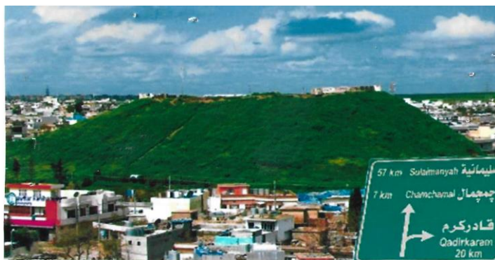
وینه ی قه لای دیرینی چه مچه مال ( قه لای سپی حه سار )

رژیمی عیراق چه مچه مائمان به جی هیشت , نهو کارانهی که نهو ماوهی سهرهوه دا نه نجامیانم داوه به گویرهی نهو نوسراوهی ناراستهی شارهوانی که رکوکم کردوه پیش چهند مانگیك له به جیهیشتنی چه مچه مال نوسراوه , نه مهی خوارهوه به لگه نامه که یه ده یخه مه رو , خوی گه وره ناگاداره نه مه م بو میژوو نویسه بو خوهه لکیشان نیه .