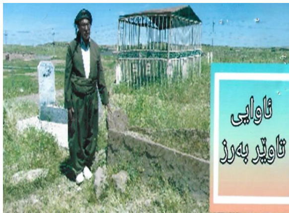
وینه ی گوندی ( تاویر بهرز ) و گۆری پیرۆزی بابام رمزا فتاح أحمد زنگنه

هه رچه نده کۆچکردنمان له سه ره تاوه له ( سائه ی ) ده وه بۆ گوندی ( تاویر بهرز ) زۆر به قورسی به سه ر سه رجه م نه ندامانی خیزانه که ماندا تیپه ری و زۆریش دئشکاو بوین لهو کیشه که نه نجام دهره که ی له خۆمان بو ناچار به کوچکردنی به کۆمه ئمانی کرد