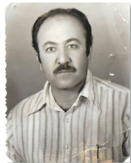
وینه ی عومەر حاجی علی زنگنه

سه رۆکی شاره وانی چه مچه مال سا ئی ۱۹۷۱ ز