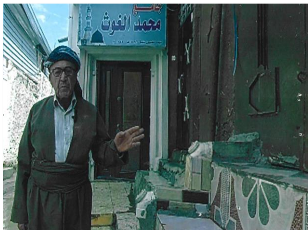
وینە ی خویندنگه و مزگه وتی ( الغوثیه )