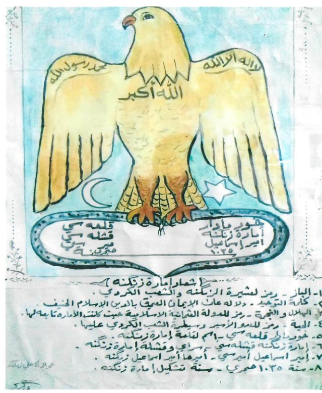
لوگوئی نه ماره تی زهنگه نه سالی ۱۰۳۵ هجری