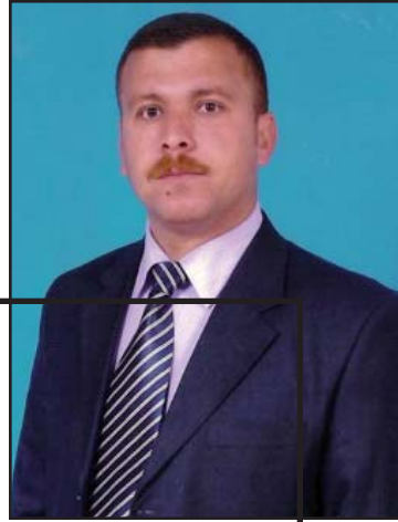
تاریق سایب پهمزان سەرۆکی لیژنهی تییپه میلیه کانی ته قتهق

پیشبرکینی به له مهوانی له زبني بچوک ته خامدا بۆ سالانیک له زانکۆی سلیمانی کۆلیژی په وهردهی وهرزشی باسی ده کرایه وه.