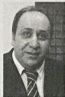
خه سره و پیربال

سالانیکه خه ریکی لیکولینه وه و دوزینه وه ی چهند سه رچاوه و به لگه نامه و کتیبی گرنگم