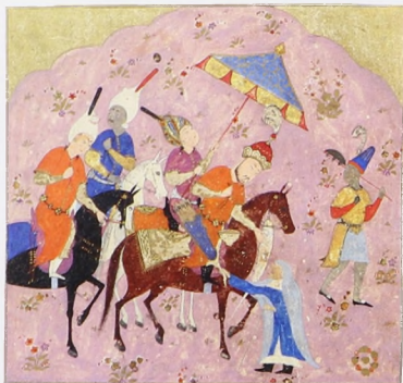
Шах Санджар и старуха. Миниатюра из рукописи «Хамсе» Низами

Появление названия Курдистан отнесено историками к XII столетию и правлению сельджукского султана Санджара (1117–1157), приказом которого Курдистаном была поименована область (вилайет), переданная в управление султанскому племяннику. Этот исторический факт вместе с описанием вилайета Курдистан и его шестнадцати районов приведен в сочинении персидского историографа Хамдаллаха Мустауфи Казвини «Нузхат ал-кулуб» («Услада сердец»), завершеном около 1340 года.