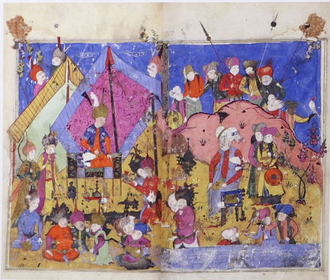
Иллюстрации к «Шараф-наме»

Описание Шараф-хана не содержит перечня конкретных названий исторически сложившихся курдских областей. Автор поведал нам лишь об обширности, протяженности страны проживания курдов, которая, в его видении, простиралась от Индийского океана до Азербайджана. Для него было главным собрать в ней воедино всех курдов, независимо от их вероисповедания,