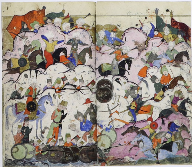
Иллюстрации к «Шараф-наме»