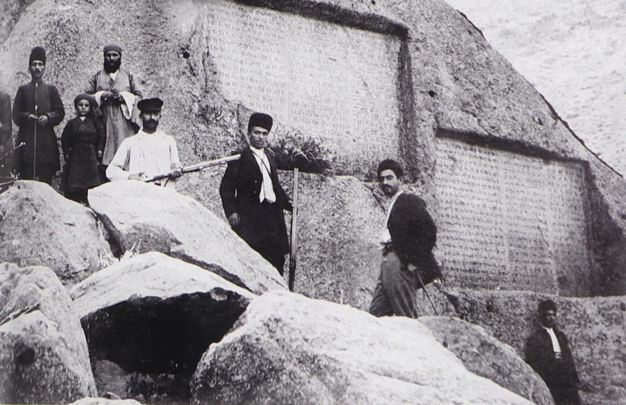
Гянджنامه. Клинописная надпись времен Дария в окрестностях Хамадана