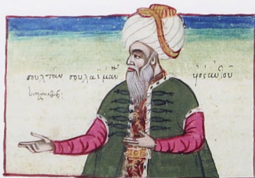
Сулейман I. Миниатюра из рукописи

В 1555 году в городе Амасья султан Сулейман I «продиктовал» шаху Тахмаспу I условия первого перемирия и проведения турецко-персидской границы, которая прошла по Курдистану и рассклала его надвое. Трактат о границе был подписан султаном Мурадом IV и шахом Сефи I в августе 1639 года в курдском округе Зохаб: она прошла по исконно курдским землям и обрела страну курдов на унижительный статус политической разделенности.