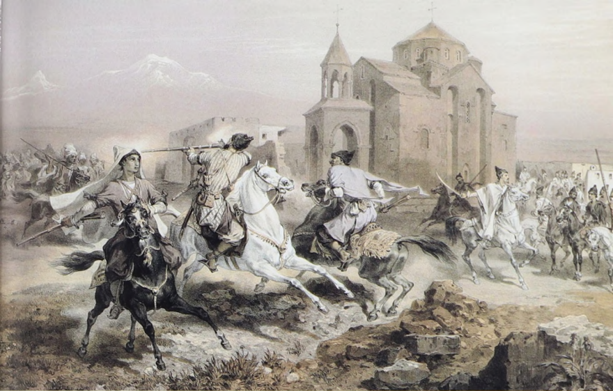
Перестрелка персов и курдов на Кавказе. 1847 г. Художник Г. Г. Гагарин