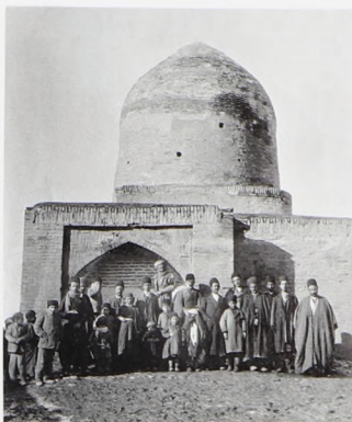
Гробница Эсфири и Мордехая. Хамдан

Распространение ислама в Курдистане было связано с большими трудностями. Навязать религию такому народу, как курдский, который в процессе своей непростой истории сумел выработать стойкий иммунитет к любым влияниям и воздействиям извне, весьма проблематично. Поэтому, вероятнее всего, те, кто предпочли сохранить верность езидской вере, продолжали ее исповедовать, несмотря на все преследования, но большая часть курдов приняла ислам. И это неудивительно, поскольку, как и все религии мирового масштаба, ислам обладал могучей притягательной силой, и приобщение к миру ислама стало фактором, определившим всю последующую историю курдов.