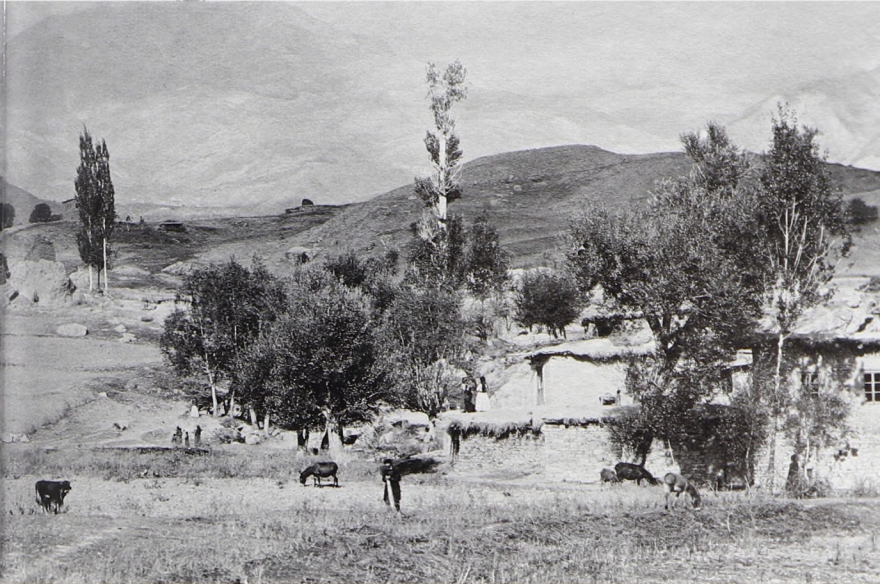
Селение в Тиари