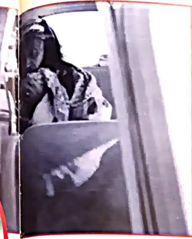
Bediüzzaman Konya dönüşünde, bir fotoğraf.