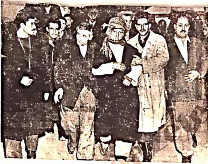
80 lik ihtiyar Salt Nursi dün koltukla Ağır Ceza Mahkemesine getirilirken