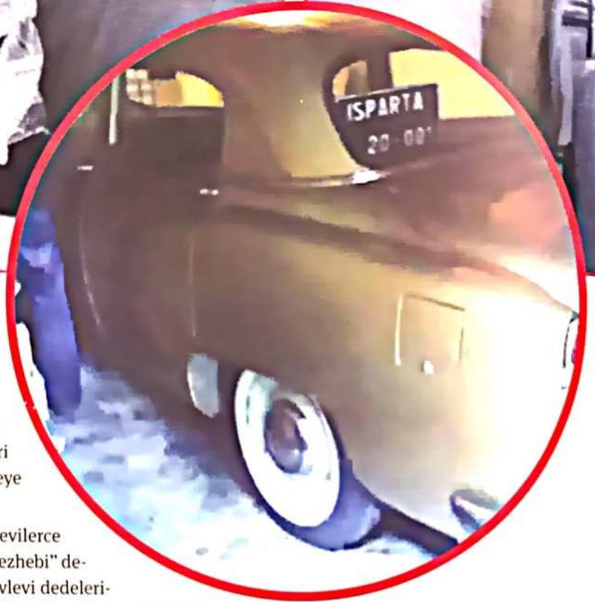
Ustadın Isparta 20-001 plakalı arabası.

Halidi şeyhleri Konya'da Mevlevilerce hakir görüldü ve Halidilik "Kürt mezhebi" denilerek karalanmaya çalışıldı. Mevlevi dedelerine göre Halidilik "bilgisiz ve cahillerin" tarikâtıydı. Kitapları ve öğretileri yoktu. Buna karşılık Kürt din adamları başta Kürtçe dini elyazmaları, Arapçayı öğretmek amacıyla yazılmış Kürtçe terkipleri ve Nûbihara Biçûkan gibi eserleri çoğaltma yoluna gittiler. 3 Mevlevi şeyhleriyle bir çeşit kültür yarışına giren Halidiler, belli başlı Kürt klasiklerini ellerinden geldiğince çoğaltmaya çalıştılar. Öyle ki Şerefname 'nin bazı nüshalarını bile Konya'da bulmak mümkündür. Bütün bu çalışmalarına rağmen, Halidiler Konya'nın Kürt köylerinde etkili olamadılar. Konya'nın yerli Kürtlerinin, Halidilerden pek etkilenmediklerinin başlıca kanıtı hemen hepsinin Haneфи olmasıdır. Elbette bunun çeşitli nedenleri vardır. Başta şunu belirtmek gerekir: Konya'nın yerli Kürtleri daha çok şehre uzak köylerde yaşadıkları için, Halidi şeyhleriyle diyalogları ya hiç olmamış ya da çok az olmuştur. Keza, Halidi medreselerinde eğitim dilinin Kürtçe olması se-