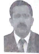
فه‌رشاد حه‌مه‌ه F. D. M. H.

سه‌ره‌ئێدانی داعش له‌عێراوێ داگیرکردنی ژماره‌یه‌ك شاری سوخته‌نشین له‌ژۆی ٩ حوزه‌برانی ٢٠١٤، وه‌رچه‌رخانیگی میژوویی گرنگ بوو له‌رووی سیاسی و نه‌می و ته‌نانه‌ت کومه‌لایه‌تی شه‌وه‌ پرۆسه‌ی به‌ره‌مه‌پێنایی نه‌وتیش له‌که‌رکوک پشکی خۆی له‌م کاریگه‌رییه‌ به‌رکەوتو به‌زەقرو ئاشکرا پێوه‌ی دیاره‌. بۆ ئێشک خه‌ستنه‌ سه‌ره‌و کاریگه‌رییه‌، سه‌ره‌تا له‌قوتاغی پێش هاتنی داعش ده‌وتین.