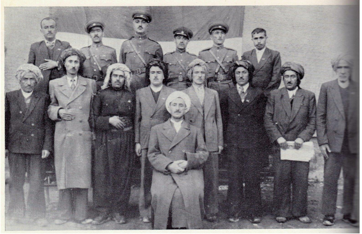
Kadı Mohammed ve Cumhuriyet'in liderleri