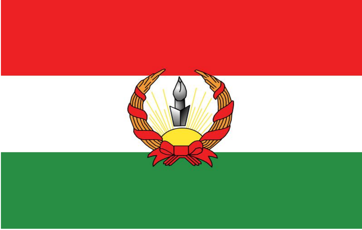
Mahabad Cumhuriyeti'nin Bayrađı