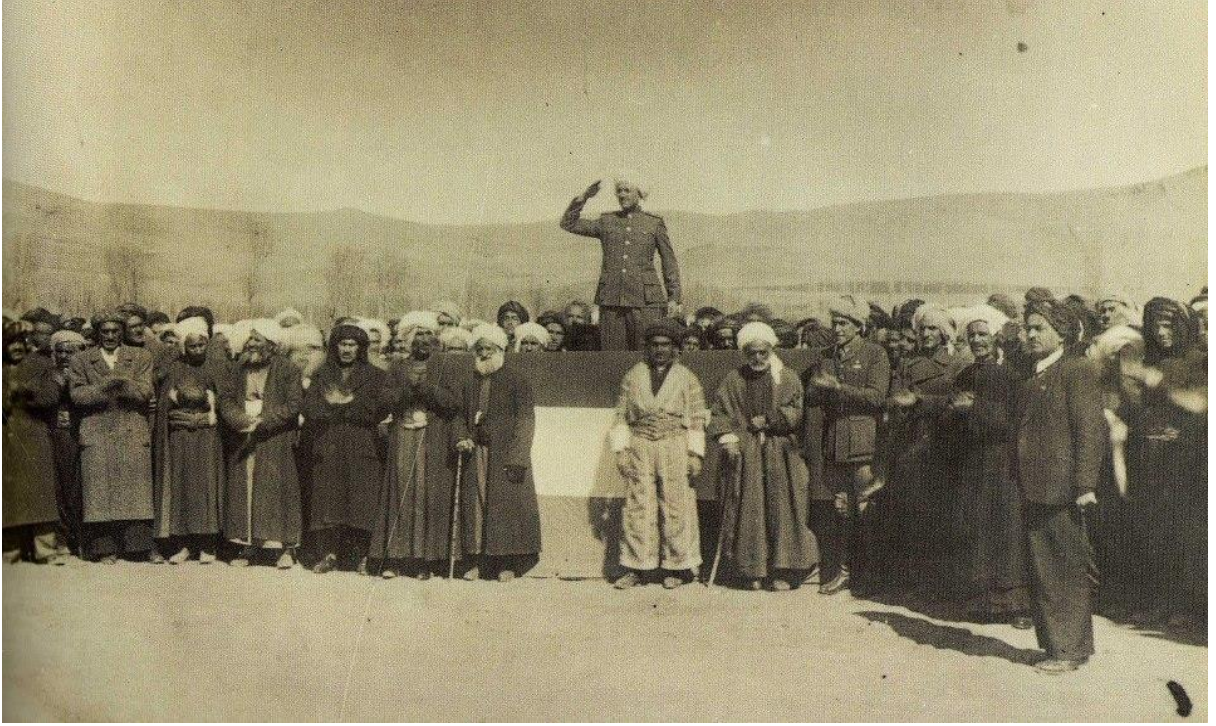
22 Ocak 1946 Cumhuriyet'in ilanı