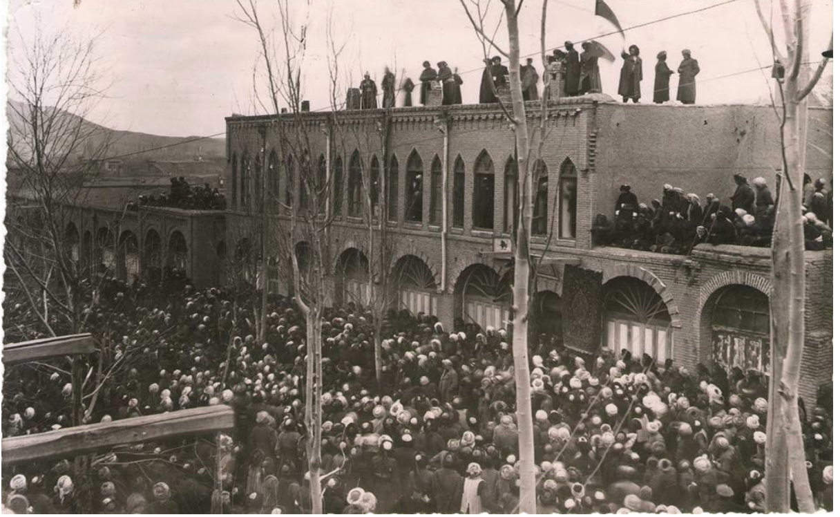
Mahabad'da Kürdistan bayrağı dikilmesi