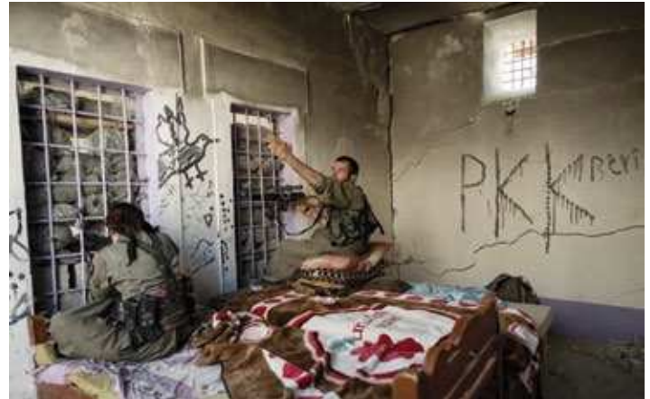
Zwei Scharfschützen einer zur PKK gehörigen Einheit nehmen IS-Kämpfer ins Visier, die sich nur wenige Meter entfernt auf der anderen Straßenseite verschanzen. Seite 46: Mitglieder einer jesidischen Peschmerga-Einheit, die im Sindschar gegen den IS kämpft.

waffe den Kandil bombardierte. Dies wiederum veranlasste die PKK-Führung, die PJAK dazu zu zwingen, ihre Feindseligkeiten einzustellen.