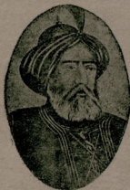
سلطان صلاح الدین ایوبی حضرتی

و تکریمه تصادف اولوناماقده در . نهایت کورد مطالبته کی اساساتک حقیقته اولان موافقتی ارا ئه امله روس ارکان حربیه سی طرفندن تنظیم اولونوب صورت محرمانه ده بعض رجاله توزیع اولتان رساله دن بعض اقسام اقتباس ایده جکزر . شریف ( مابعدی وار )