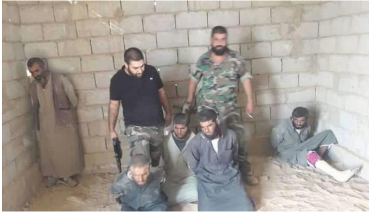
Dêrezor..hêzên rêjîmê duyên kor û 3yên din dikuje 8 .

payebilindên wê ve bi dilekî gerim hat qebûlkin. Niştecihên Dêrezorê, Cizîrê ji xwe re weke cihekî ewleh dît û Rêveberiya Xweser li Rojava-Bakurê Sûriyê alfarî baş bi wan re kir û parastina wan kir. Li hemberî vê jî, rêjîmê nikarîbû xwe li ser erebên sune ferz bike, ji ber ku hevpeyman bi Îran û mîlîsên wê yên nijadperest re girê dabû û gelek destdirêjî li ser mafên mirovan kiribû, destdirêjîyên rêjîmê gihaştibûn tawanên şer.