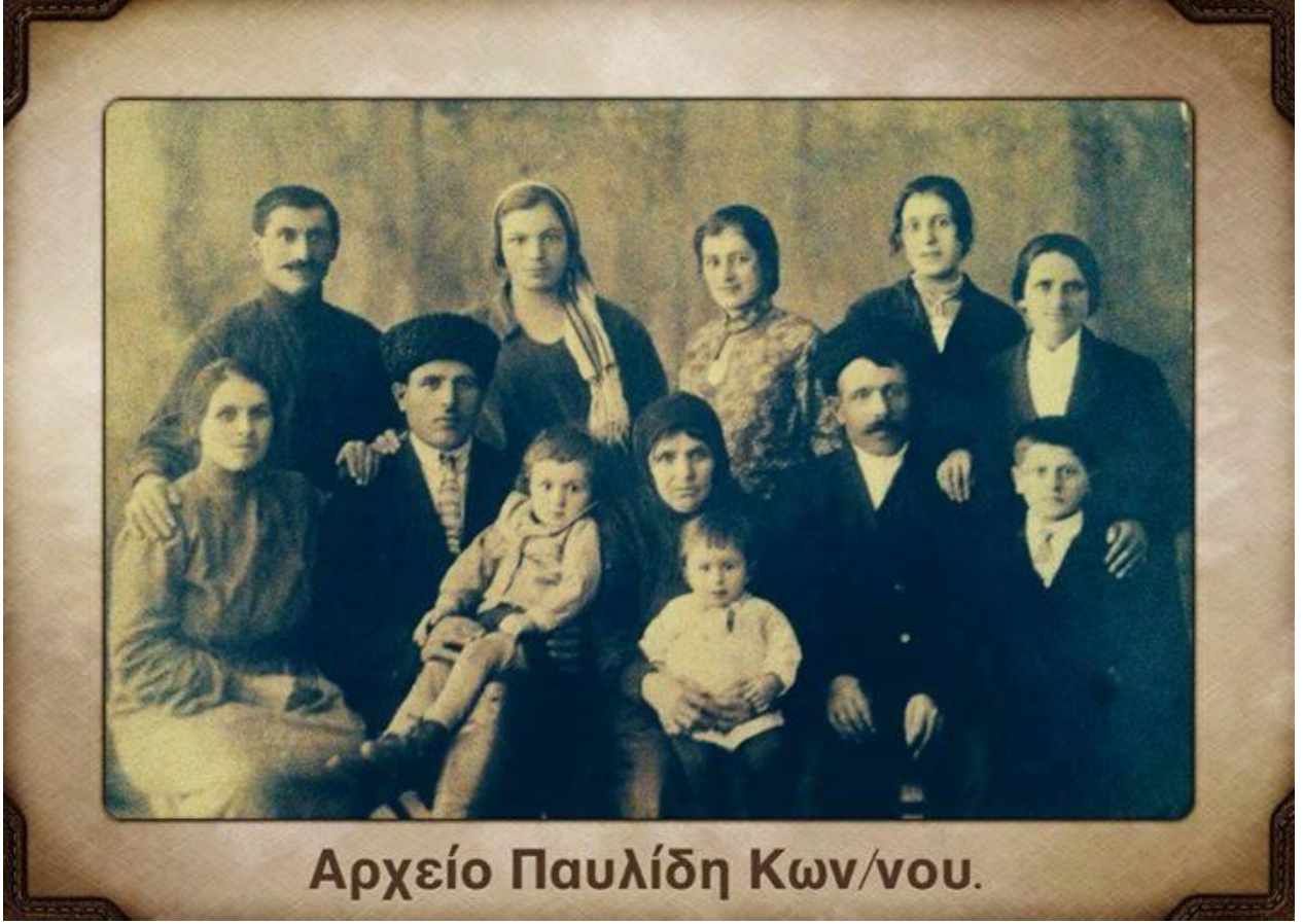
Karslı bir Rum aile

Beni dinlediğiniz için çok teşekkür ederim.