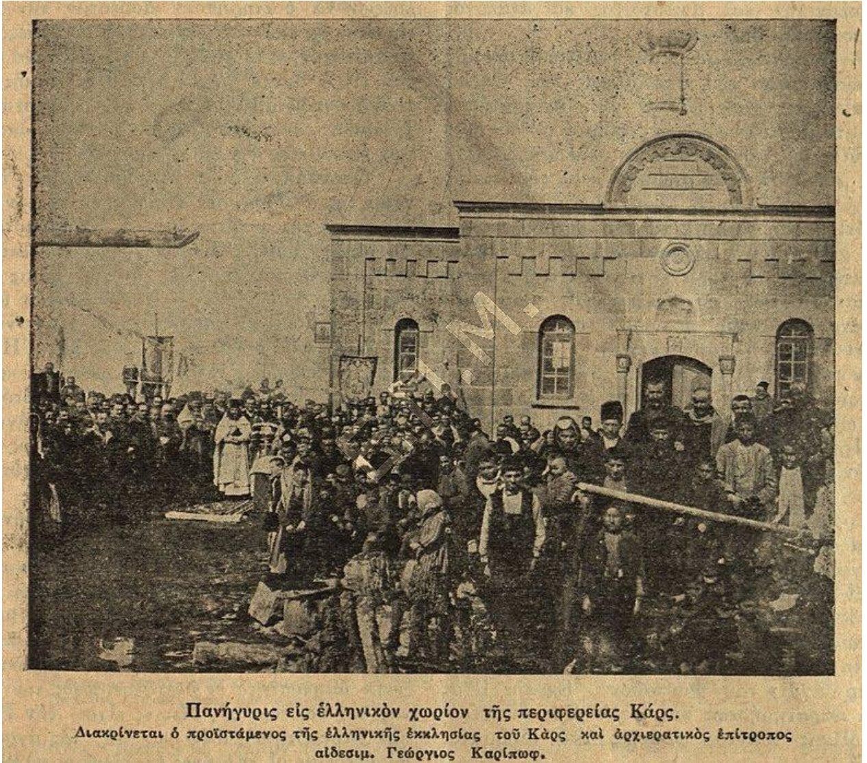
Kars bölgesinde bir Rum köyünde şenlik