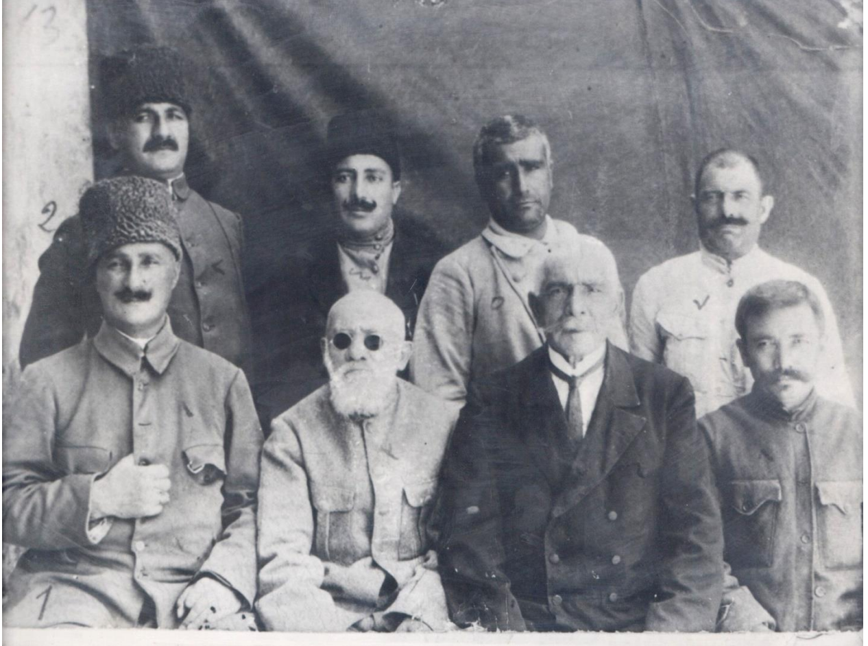
Cenub-i Garbi Kafkas yöneticileri Malta'da

Bu arada konumuz açısından önem arz eden birkaç resmi sizinle paylaşmak isterim: