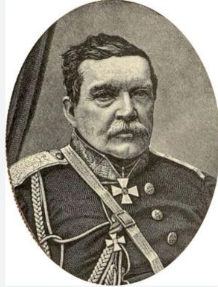
N. N. Muravyov-Karsskiy. http://1825.ru/viewtopic.php?id=835&p=4

Osmanlı-Rus muharebeleri devam ederken Osmanlı Kürdistanı'nda bir direniş patlak vermek üzereydi. Henüz 1847 yılında meydana gelen Mir Bedirhan direnişinde kuzenine ihanet eden ve Bâb-ı Âli yönetimiyle işbirliği yapan Yezdanşêr, o tarihten itibaren deyim yerindeyse bir "idarî caize" peşindeydi. 15 Lakin arzu ettiği makama ulaşamayan Kürt Yezdanşêr, bir süredir yerel düzeyde Osmanlı yöneticileriyle ciddi münakaşalar da yaşamaktaydı. 16 Türk ordusuna asker tedarik etmesine rağmen gerekli ilgiyi görmemiş ve maaşı kesildiği gerekçesiyle Kasım 1854'te etkili bir kıyım başlatmıştı. 17 Muhtelif Kürt aşiretlerinin destek verdiği direniş Botan, Hakkâri, Van, Bitlis ve Musul'a kadar geniş bir sahaya yayılmıştı. 18 Yezdanşêr, bölgedeki nüfuzunu tahkim etmek için Rus ordusuyla da bazı münasebetler geliştirmeye çalışmıştı. Bu çerçevede hem Beyazıt'taki