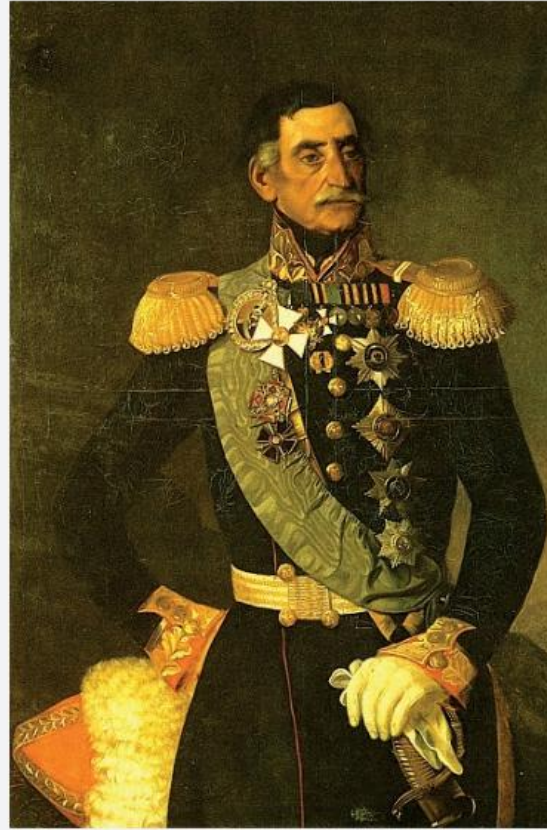
V. O. Bebutov. http://lemur59.runode9227

Osmanlı sahasında meskûn Kürt aşiretlerinin vaziyet-i umumiyesine bakıldığında ise savaşın hemen başında Osmanlı Devleti'nin safında "kerhen" yer aldıkları gözlenmektedir. 7 Özellikle 1830'lu ve 1840'lı yıllarda Osmanlı yönetiminin Kürt coğrafyasında gerçekleştirdiği merkezîyetçi "tenkil" politikası, Kürt halkında olumsuz bir izlenim bırakmış ve aşiretlerin Bâb-ı Âli ile olan bağıni nerdeyse koparmıştı. 8 Cemaldini, Milan, Bezikî, Zilan, Canukî gibi Kürt aşiretleri bu ruh hali içinde savaşa girmişti. 1853 yılı kasım-aralık aylarında Başgedikler mevkiinde hâsıl olan muharebeler, Kürt aşiretlerinin tutumunu değiştirmişti. Kars'a bağlı Başgedikler'de V. O. Bebutov komutasındaki Rus ordusu, Ahmet Paşa emrindeki Osmanlı birliklerini yenilgiye uğratmış; 9 Cemaldini, Milan ve Bezikî gibi aşiretler Rus cenahına geçiş yapmıştı. 10