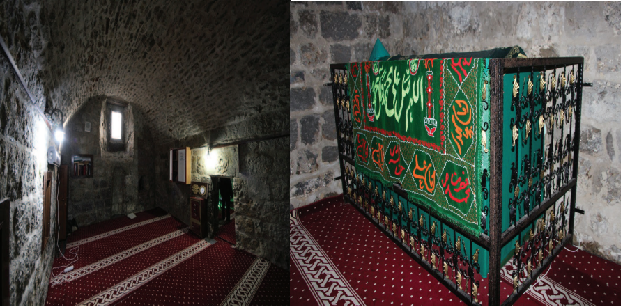
Resim 4. Şeyhü'l-Garib Zâviyesi'nin İç Mekânı ve Şeyhü'l-Garib Mezar Sandukası, Zülfıye Koçak, 2021.