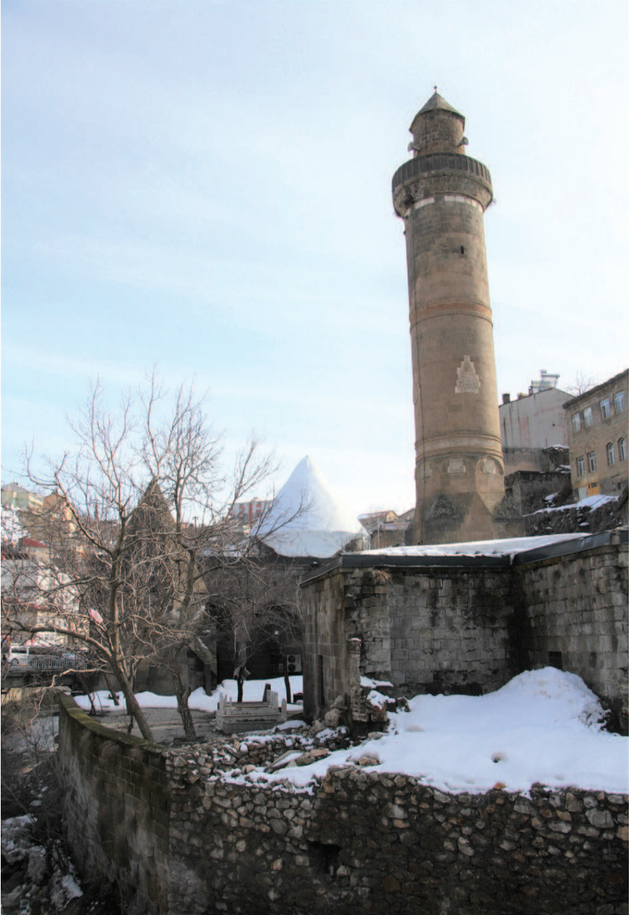
Resim 6. Şerefiye Külliyesi, Zülfiye Koçak, 2021.