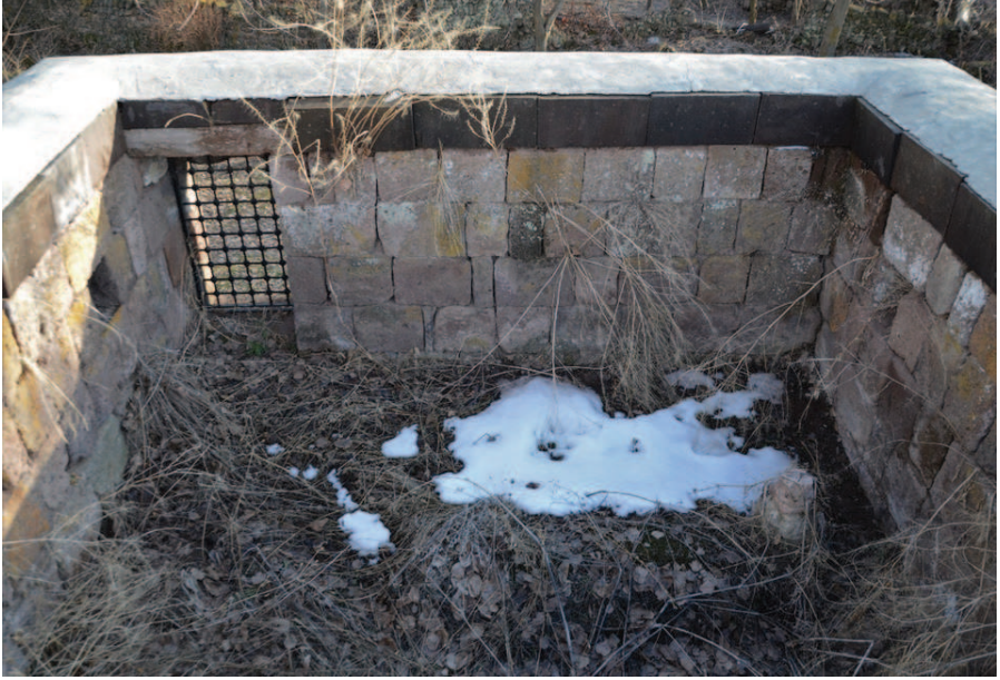
Resim 9. Şeyh Mehmed Sencerhiz'in Mezarı , Zülfıye Koçak, 2021.