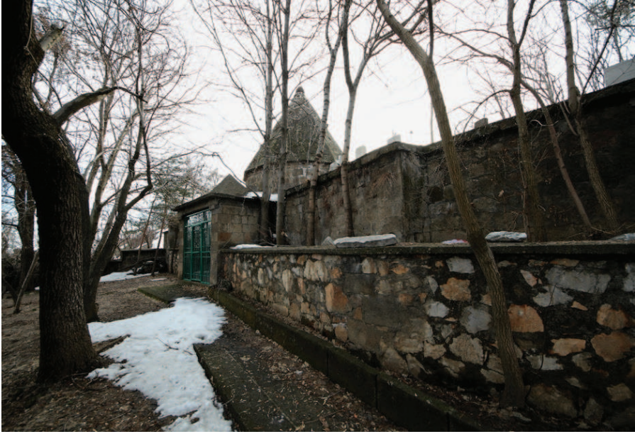
Resim 8. Şeyh Ebu Tahir-i Bidlîsî'nin Türbesinin Bulunduğu Yer , Zülfiye Koçak, 2021.