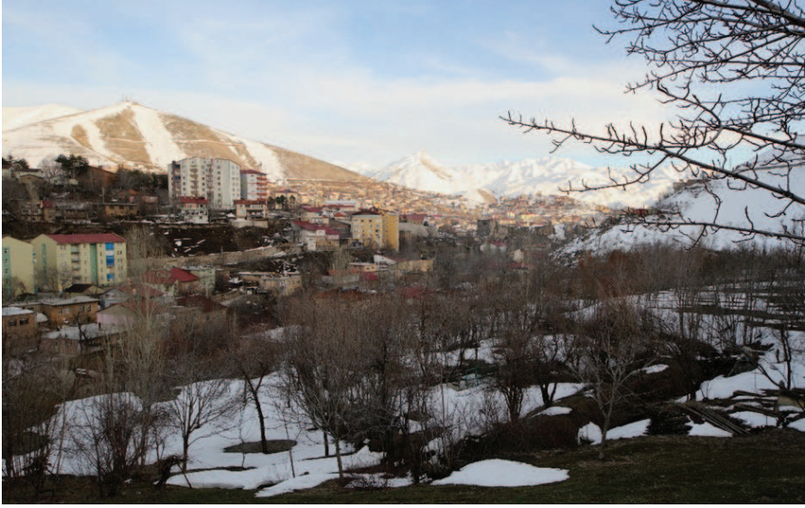
Resim 7. Şeyh İsa Mezarının Bulunduğu Bölge , Zülfiye Koçak, 2021.