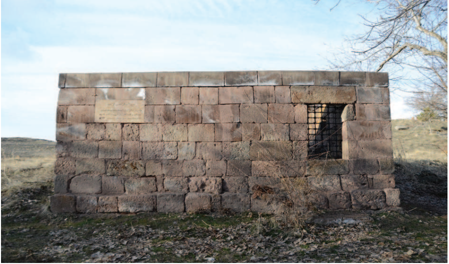
Resim 10. Şeyh Mehmed Sencerhiz'in Mezarı , Zülfıye Koçak, 2021.