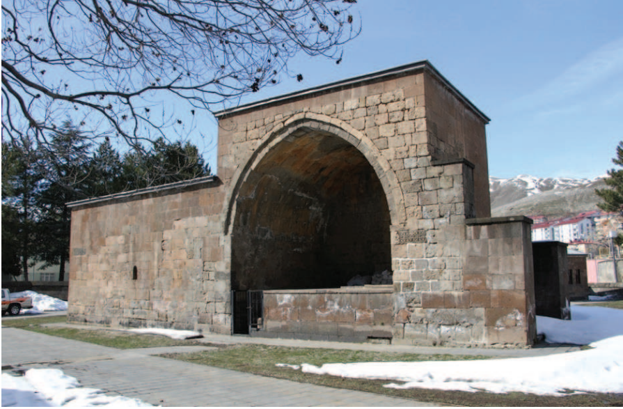
Resim 1. Emir Şemsüddin Zâviyesi, Zülfiye Koçak, 2021.