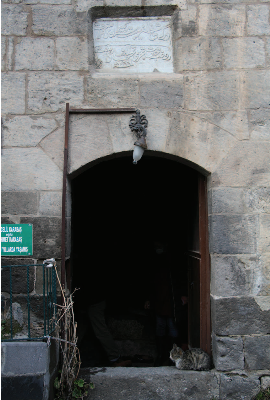
Resim 5. Şeyhü'l-Garib Zâviyesi'nin Giriş Kapısı ve Kapı Üzerindeki Kitabesi, Zülfiye Koçak, 2021.