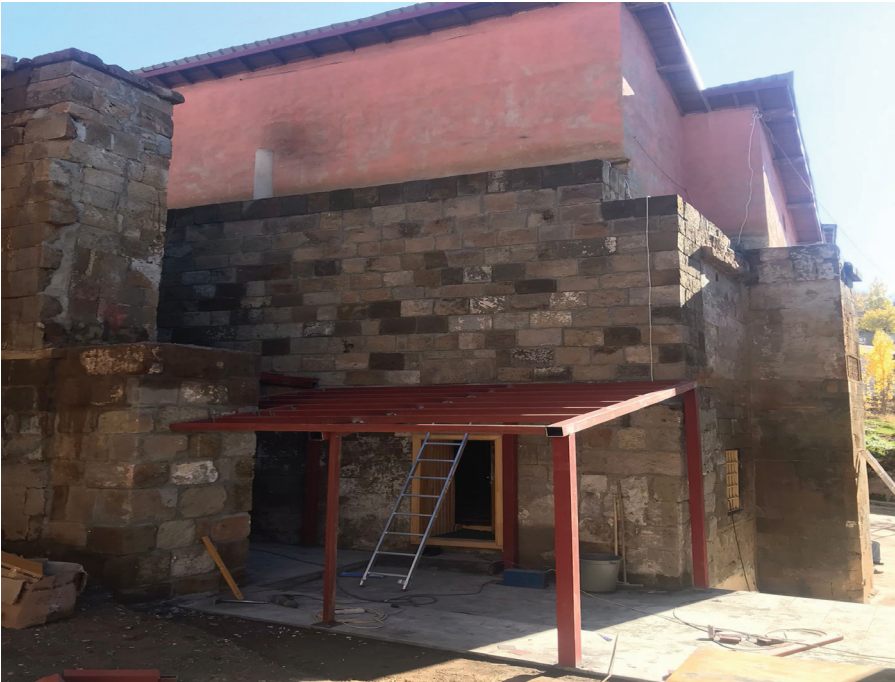
Resim 2. Seyyid İbrahim Camisi Olarak Anılan Cami, Zülfiye Koçak, 2021.