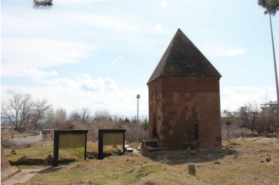
Resim 12. Şeyh Necmeddin Hevayî Türbesi , Zülfiye Koçak, 2021.