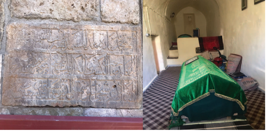
Resim 3. Seyyid İbrahim Camisinin Kitabesi ve Cami İçindeki Seyyid İbrahim Mezar Sandukası, Zülfıye Koçak, 2021.