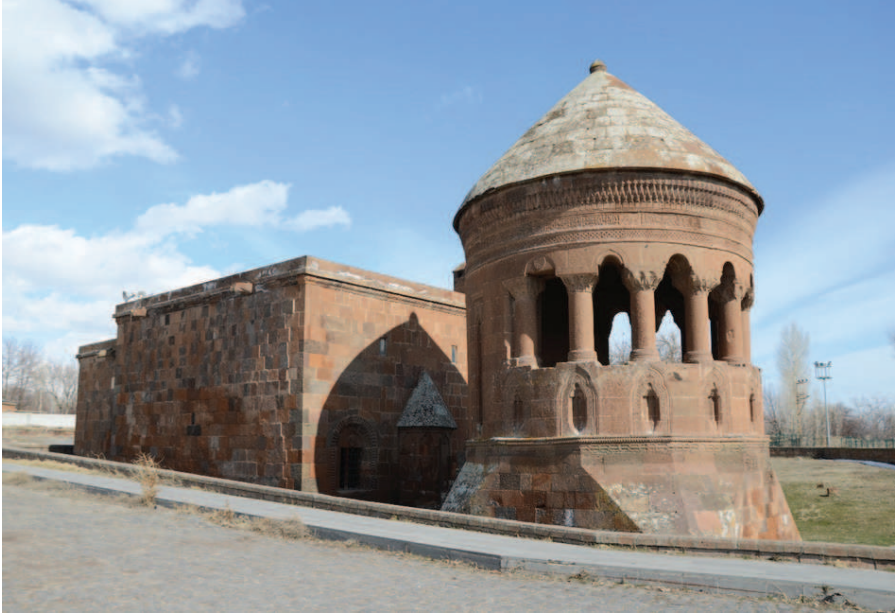
Resim 11. Bayındır Kümbeti ve Günümüzde Cami Olarak Kullanılan Yapı , Zülfiye Koçak, 2021.