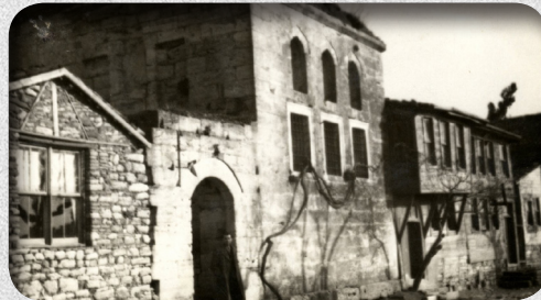
مدرسه‌سیا مهلا نیدریسی بسدلیسی

ب فی رهنگی قزلباش نهچار بوون کو دوورپیچئ ل سهر ئامهئ رابکهن و بهرف میردینئ فهکیشن، و ل گولانا ۱۵۱۶ شهري قوچهسار روودا کو بئیکجاری ههبوونا قزلباشان ل کوردستانئ بداوی ئینا (۲۹) و ئهفه بهرهههمن خهباتا بهدلیسی ژیو ئیکگرتنا چهپهري کوردان و نئزیکرنا وان ژ دهولتهتا ئوسمانی بوو.