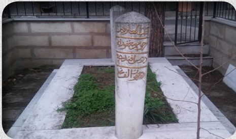
ک یلییا گوزی مهلا نیدریسی بسدلیسی

جهت نامائز یه کو ن دهسپتیکت همر ئیک ژ شان سهرهلدانان ب تهنا سهرئ خوه بوون و همماهنگی و ههفکاری دناشهررا واندا کییم بوو لهورا نهشیان بهردهوامیئ ب خوراگریئ بهدن.