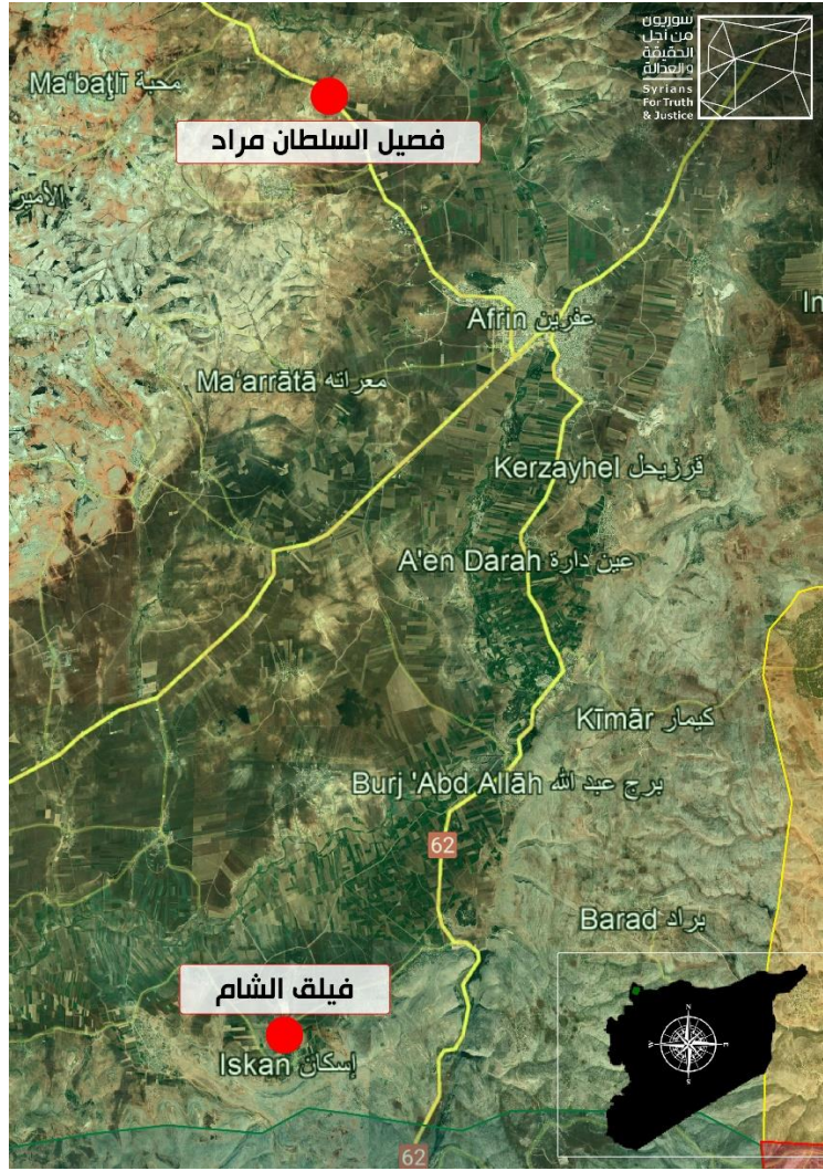
صورة رقم (2) - خارطة تُظهر بعض أماكن الاحتجاز التي استطاع الشهود تحديدها خارج مدينة عفرين.