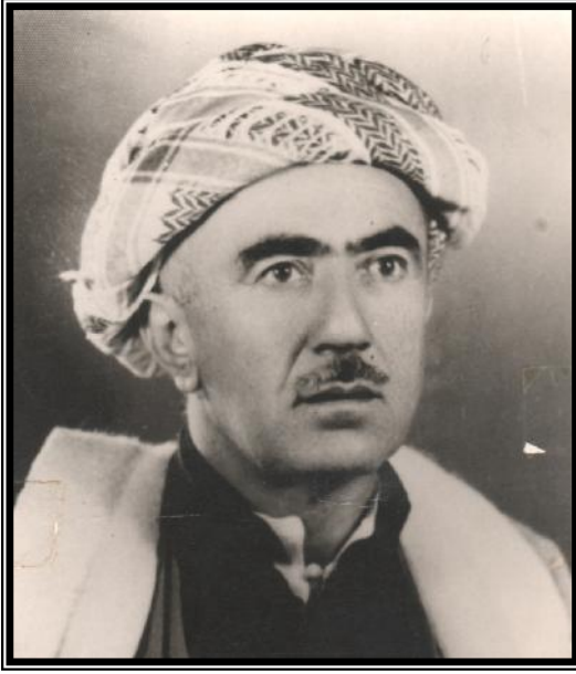
شيخ خورشيد بارزاني آخر شيوخ بارزان ١٩٨٣/٧/٢١