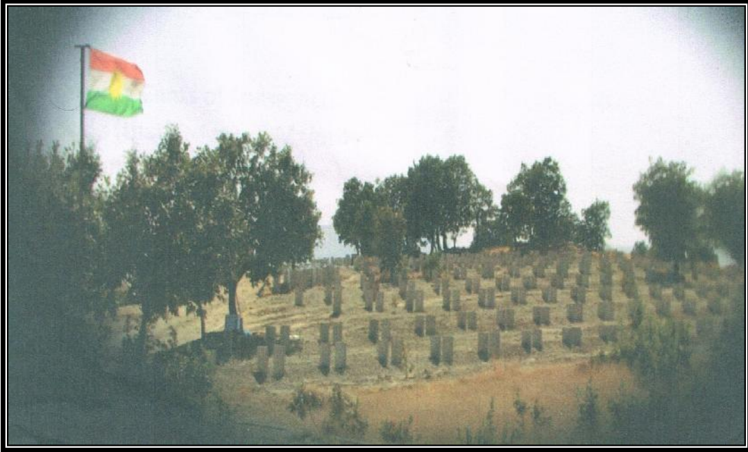
مقبرة مجموعة من البارزانيين المباديين جماعياً ملان / بارزان