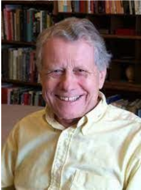
چارلس تیلی کومہناسی نھریکی