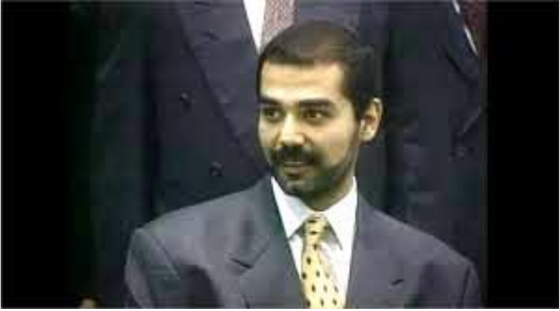
عوده‌ی سه‌دام حسینی