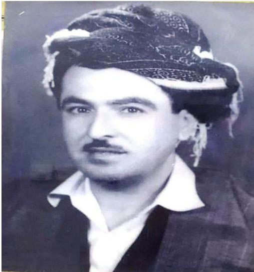
حسین ناغای سورچی نهجامگیریی : پوختهو ناسۆکان