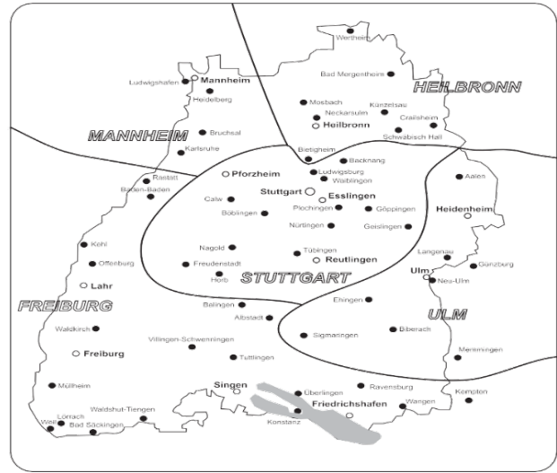
Verfassungsschutz Baden-Württemberg 1

için belirleyici rol oynarken, her bir bölge, sorumlu bir kişi tarafından yönetilmektedir. Bölgesel yönetici seviyesindeki kişiler, sabit bir adresi bulunmayan ve herhangi bir profesyonel faaliyet içinde görünmeyen düzenli ve tecrübeli yöneticilerdir. Örgütteki katı hiyerarşik yapıya sıkı sıkıya hizmet etmeleri adına, bu kişilerin aile bağlarının kuvvetlenmesine izin verilmemektedir.