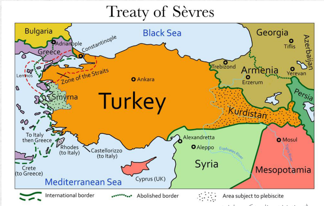
سىقەر نەخشەى ناوچەكەى دارشتەو

پرووی داوہ. ئەم دابەشکردنە ناغادیلانە بووہ و بنەمای چەند تاوانیکى گەرەى سېرنەوہى نەتەوہى کورد بوو لە بۆتەى ئەو دەولەت-نەتەوانەى کوردستانیان بەسەردا دابەش کرا. بەرژەوہەندىيە ئابووریيەکان وایان لە ولاتانى زلھیز کرد چاوپۆشى بکەن لەو ھەموو کۆمەلکۆژیيانەى بەرامبەر بە گەلى کورد کران.