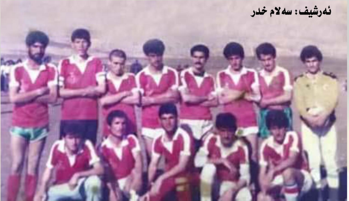
نهرشیف: سه لام خدر

سلیمان حمهده قادر محمهده نه حمهده هومهر نوری نه حمهده خدر عه بدولپرهمان نه حمهده رهسول ئیبراهیم نه حمهده رهسول حمهده حسین خدر مه حموده محمهده نه حمهده عه لی محمهده محمهده