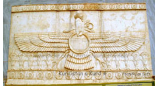
Xwedayê rojê Ahûra-Mezda