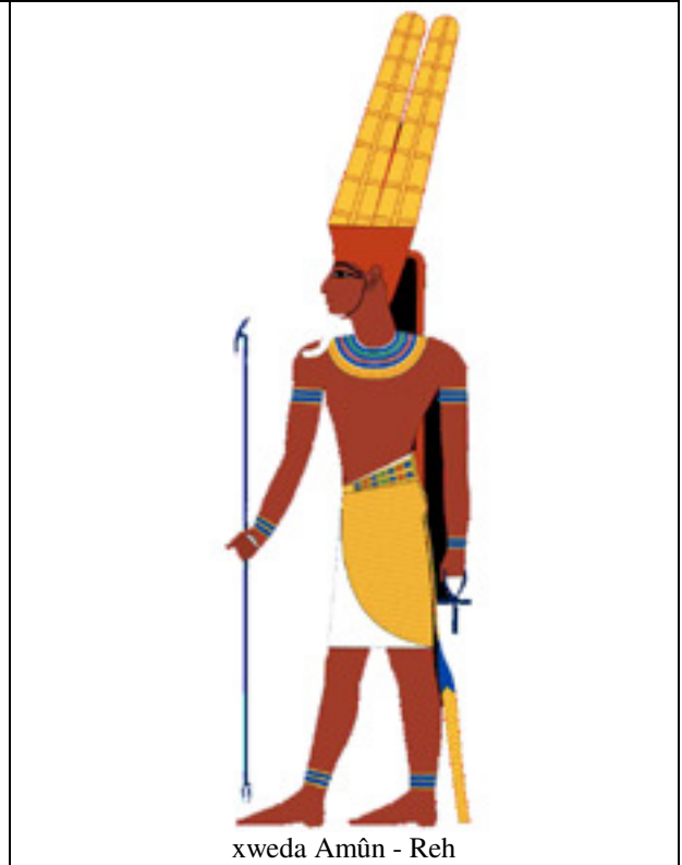
xweda Amûn - Reh

Ev bû - pir bi kurtahî - rah û damarên ayîna Atûnî û ayîna Zerdeştî di kûraniya dîrokê da. Tenha ma ku em ji pêra li peywendî û bandora van herdu ayînan li ser hev bikolin.