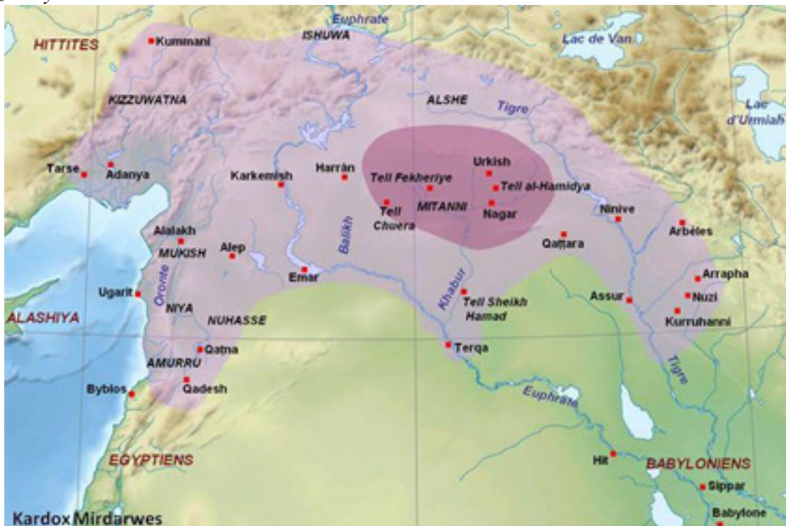
(Erdnîgariya kelîja Horî)

herêmeke gewre ye li Başûrê Kurdistanê, û peyva "xûr" jî di navê bajarê kurdî "Xûrem-Abad" da maye; yanê bajarê rojê; û her wisa di navê herêma "Hewreman = Xûraman" da jî maye. Heya vê rojê jî gelê vê herêmê ji alîgirên ayîna "Kakayî" ya şemsanî ne; wek şaxek ji şaxên Yezdaniyê 2 .