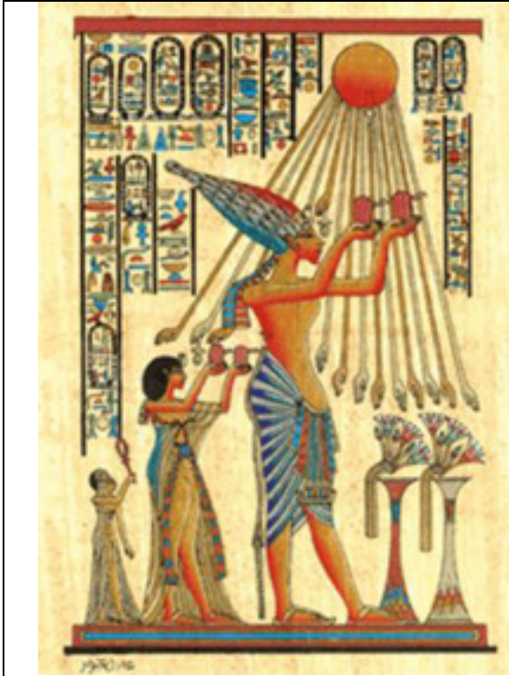
pêşkêşkirina qurbaniyan ji xweda Atûn ra