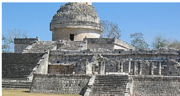
چیچان ئیتزا گرنگترین شار بوو له‌ باکوری ناوچه‌ی مایا

هه‌ندێ جاری زیندانیه‌کان ئه‌شکه‌نجه ده‌دران و ناچاریان ده‌کردن یاری تۆپی پێ بکه‌ن و دواتر ده‌یانکردن به‌ قوربانی. هه‌ندێ جاریش جه‌نگی گه‌وره‌تر روویداوه که بووته هۆی ئه‌وه‌ی شارێکی به‌هێز داگیر بکری‌ت. مایاکان شانازیان به‌ شه‌ره‌کانیانوه ده‌کرد. پاشا و جه‌نگاوه‌ره‌کان سه‌رکه‌وته‌کانیان له‌سه‌ر شوپنه‌واره به‌ردینه‌کان تۆمار کردووه ، که تا ئه‌مپروۆش شوپنه‌واره‌کانیان ماونه‌ته‌وه.