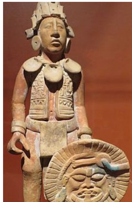
جه‌ینا ئایلاند فیگورین نو‌ینه‌رایه‌تی جه‌نگاوه‌ریکی سه‌رده‌می کلاسیک ده‌کات