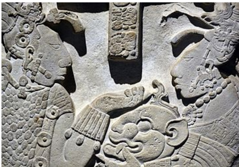
ورده کاری لینیٹیل ۲۶ ی یه خچیلان

نجواس، كوبان). له ههردوو سهدهی (۸-۹)ی زاینی دا بهر بهره شارستانییه تی مایای کلاسیک به ره و شوږبوونه وه و نه مان نه چوو ئه مهش به هۆی کۆچ کردنی خه لکه که ی له و شارانه ی که وتوونه ته ده شته ناوخۆیییه کان، ئه مهش به هۆی شهرو شوږی ناوخۆیی و که می ئه و به ره مانه ی له زهویه کشتوکالییه کان ده ستیان ئه که وت وه به شی نه ئه کردن، هه ندیک به لگه هه ن که برسیتی و شوږش و یاخی بوون له چینی فه رمان په وا و ده وله مهنده کان له چه ند شوینیکی ولاته که سه ری هه لدا. ئیسپانییه کان له سالی (۱۵۲۰ز) په لاماری ئیمپراتوریای مایایه کانیا ن داو توانیا ن ده ست بگرن به سه ر زه وییه کانیا ندا، هه رچه نده بو ږیگری کردن له داگیرکردنی ولاته که یان له لایه ن ئیسپانییه کان، گه لی مایا به رگریکی بی وینه یان کرد، به لام تا سالی (۱۶۹۷ز) توانیا ن خو یان ږا بگرن که ئه وه ش شانشین ئه ترا بوو. دواتر له به رامبه ر هیزه کانی ئیسپانی دا تیکشان وه به ته وا وه یه تی ده ستیان به سه ر ولاته که دا گرت.