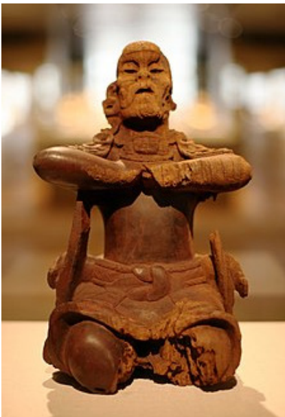
په یکه ری داری کلاسیکی زوو

مایاکان ههچهنده ههچ ئامرازیکی کانزاییان نه بوو، به لام کارکه ریکی شاره زا بوون و شتی بوماوه دریژیان دروست کردووه، ههروه ها کاره هونه ریه کانیا ن جگه له ئیسک و فلینت و جه می، له به ردی بیناکانیا ن - دیواره کان و ده رگاگان و پلیکانه کانیا نیش نه خشان دووه. قوربانگا فیداییه کانی خویان و نیشانه کانی دادگای توپه کانیا ن هه لکوئیوه له هه مووشیا نه وه مؤنومیتیا ن بو پاشاکانیا ن و جه نگاوه ره کانیا ن نه خشان د و سه رکه وتنه کانیا ن تو مار کردوون. ههروه ها مایاکان له سیرامیکه کان شاره زا بوون، که زور شیوه و قه باره ی جیاوازیان دروست کردووه. کوپ و کاسه و قاپ و قاچاغ و گوئدانه کان زور جار به وردی رازیترابوونه وه به تابلویان نه خشان دنی جوانه وه. مایاکان ههروه ها په یکه ری ورد و واقیعیان له شیوه ی خه لک و ئاژه لدا دروست کرد.