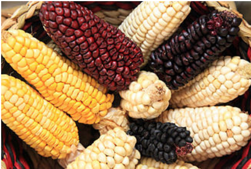
گه‌مه‌شامی به‌شیکى سه‌ره‌کی خۆراکی مایاکان بوو

بیبه‌ریان وه‌ک خواردنیکى به‌تام بو‌ پاشا و قه‌شه‌کانیان ئاماده‌کردووه، پاقله‌ی کاکاویش لای ئه‌وان زۆر به‌ نرخ بووه، به‌شێوه‌یه‌ک که‌ زۆر جار له‌بری پاره‌ به‌کاریان هێناوه. مایاکان تۆویان له‌ چالیکدا چاندووه که‌ به‌ داریکى نووک تیژ هه‌لیان نه‌که‌ند، دواتر گه‌شه‌یان به‌ سیسته‌می کشتوکالی دا، هه‌روه‌ها په‌نینیان بو‌ به‌ره‌مه‌ کشتوکاله‌کان به‌کارهێناوه.