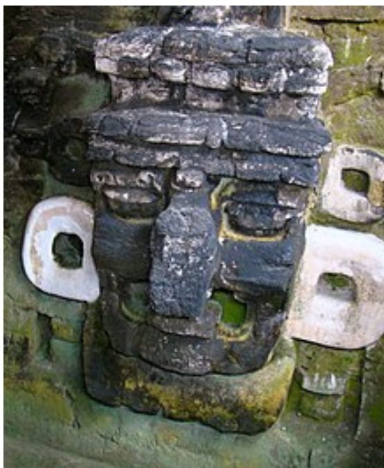
ماسکی سنوکیو ۳۳ پازاندنه‌وه‌ی ژیرخانه‌وه‌ی کلاسیکی سه‌ره‌تایی تیکال په‌رستگا