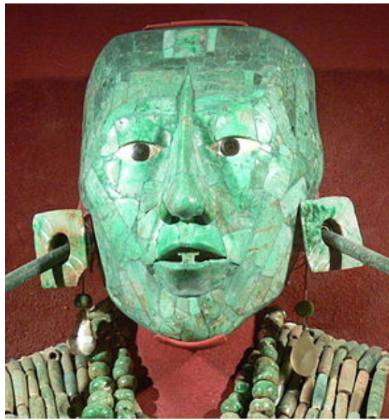
ده مامکی خوشی یه دی پاشای که یینه بیج جانه ئاب و پاکال