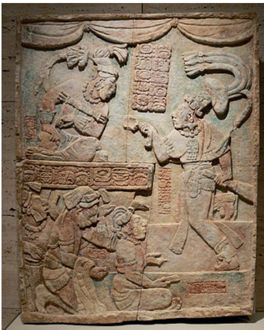
په‌یکه‌رتاشی سه‌رده‌می کلاسیکی مایشکردنی دیله‌کانی پیش فه‌رمانه‌وای ئیتزامن‌اج ب ئە‌لعلامی سییه‌م له‌یاکسچیلان

هه‌روه‌ها مایاکان به‌پادشاکانی خو‌یان ئە‌گوت (کۆلاه‌و) که به‌واتای فه‌رمانه‌وایی گه‌وره و پیرو‌ز دیت، وه‌ پادشاکانیان ده‌سه‌لاتی سیاسی و ئاینیان هه‌بووه. ئە‌م پاشایانه له‌سه‌ره‌تاوه له‌ریوره‌سمیکدا له‌لایه‌ن ئە‌نجومه‌تیک‌ی تایبه‌ته‌وه هه‌لته‌بژێردران، به‌لام به‌تیه‌ربوونی کات ئە‌و ریوره‌سمه‌ نه‌ما و به‌ته‌واوی ده‌سه‌لات که‌وته ده‌ست پیاوانی ئاینی و قه‌شه‌کانه‌وه، تا‌وای لیهات قه‌شه‌کان خو‌شیان ئە‌بوون له‌پادشا.