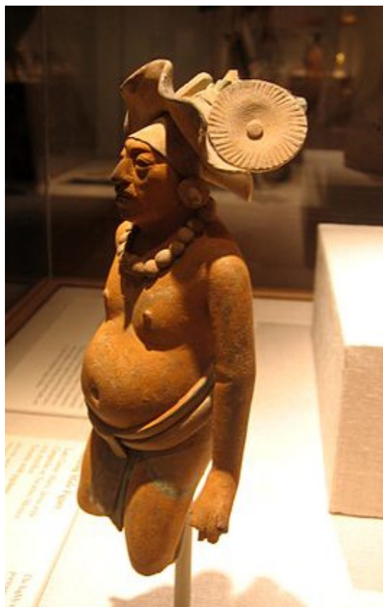
پهیکه‌ری سیرامیک له دوورگه‌ی جهینا، ۸۰۰-۶۵۰