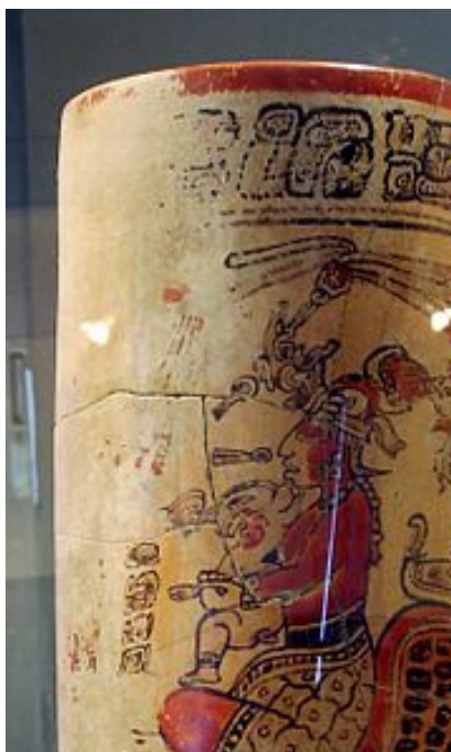
که‌شتی سیرامیکی په‌نگراو له ساکوله‌وه