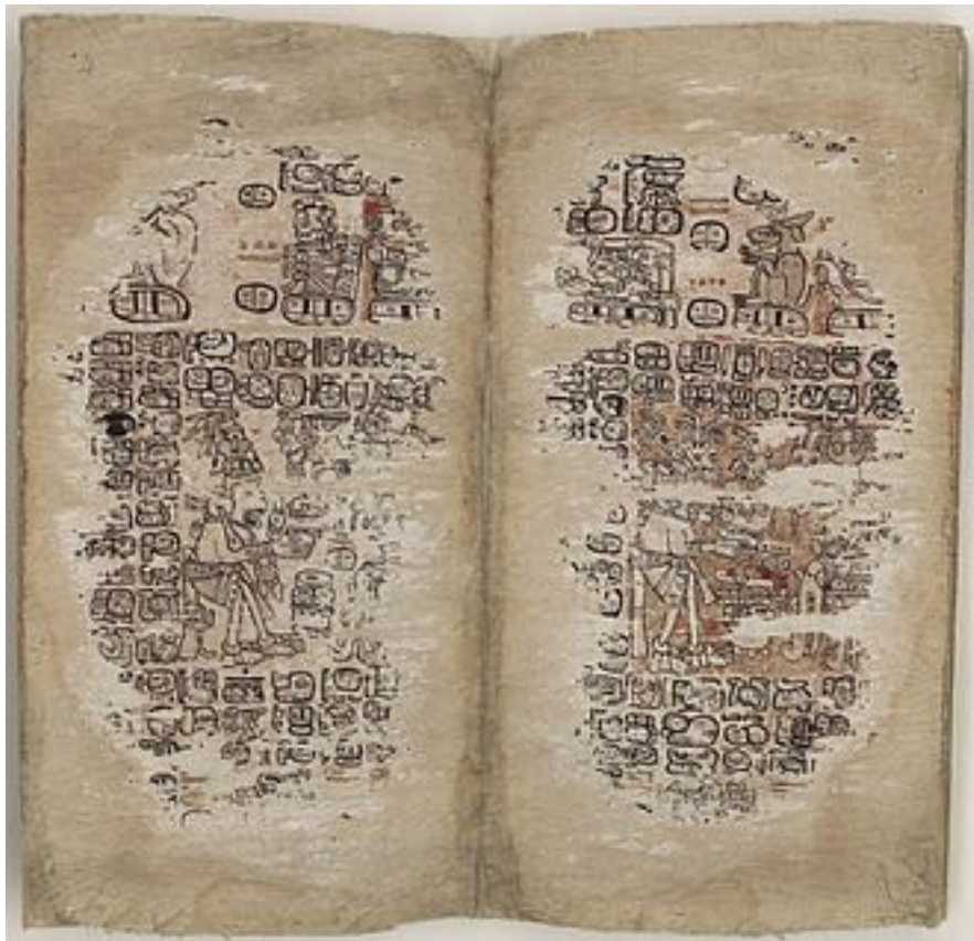
لاپه ره کانی سه رده می پۆست کلاسیکی پاریس کۆدیکس، به کتیک له چه ند کتیبکی مایا له بووندا

مایا کۆنه کان ههروه کو میسریه کان سیسته میکی نووسینی ئالۆزبان به کارهیناوه که به وشه (هیرۆگلفنی) چوووه که تیبینییه کانیان و حساباته فهله کی و پۆژمیر و میژوو وه ره چه له کی نه ته وهی خۆیان پی نووسیوووه، وه ههروه ها تیکه لایک بووه له هیما و وینه و نیشانهی ته واوی نواندوووه وه خویندراوه ته وه. ئه و نووسینانهش له سه ره گۆزه و قاپه گلینه کانیان ئه نه خشانده وه یاخود له سه ره ئه و کتیب و نووسراوانه ی که له سه ره تویکلی دار دروستیان ئه کرد.