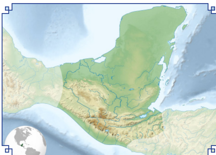
شوینی شارستانی تی مایا له سه ر نه خشه

به لām ئەوه ناگه یه نیت که هه ولی ئە نثرۆپۆلۆجسته کان بو ناسینیان بۆ سوود بوو بیت، به لکو که م تا کوریک توانیویانه په رده له سه ر لایه نیککی ژیا نی ئەم شارستانی ته هه لده نه وه.