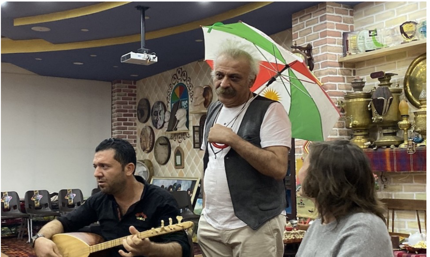
چركاندن: دەپقەد شووك