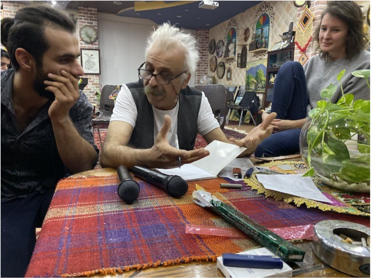
چركانندن: دهيقڭد شووك

هؤنراوهكانى سه رهتاي هاوسؤزى و هاوخه ميبهكى تاييه تيان لى دهچؤرپيته وه، كه چى ناوه راستى نه وه دهكان به شيعرى «۱۹۹۳» داكوكى له دادپه ره وه ريبى كومه لايه تى كردوه: