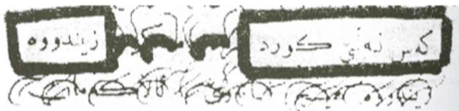
كەس نەئى كورد مردووه كورد زیندووه

نزيكى پيربال و هونهري شنيوهكاري به شنيوازي ديكهيش پزاوهتهوه ناو هونراوهكانيهوه. ناوبهناو ئامبازي دهستنوس بووه و داهينانه خورسكهكهي له سرينهوهي شيعري كورديدا رسكاندوه؛ دژناسيوناليزمه راديكالهكيشي له شيعري سروودي نيشتماني «ئهي رهقيبا»ي دلداردا خوي نواندوه، دوابهتي ههلياچيوه و شوناسي كوردايهتي تيدا ئاوهژوو كردوهتهوه.