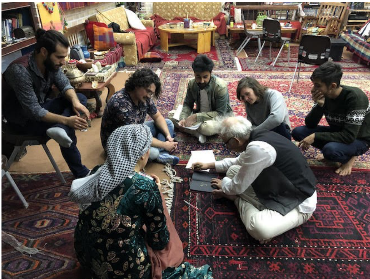
چرکاندن: پشتیوان که مال بابه کر

له وه که متر نییه. وهک که سایه تی چیرۆکه که ی به دنیا دا گه راوه، زیږی پاشه که وت کردووه و له گه ل خویدا هیناویه ته وه. فهره یدوون که سیکی هه یه چیرۆکه ی ده گێریته وه، به لام مخابن، پیربال خوی هیچ وه گێرکی نییه؛ پیاویکی ژیره و که وتووه ته ناو دنیا یه کی شیته وه.