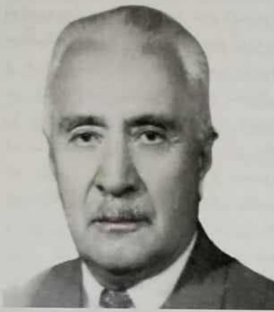
ره فیق حیلمی

خویان به نووسینه وه و ناردنی نامه ی دووردی ژوه خه ریک نه گهن، وه ک شهوی له بره گه یه کی نامه که یدا بو ناهیده ی کچی دهنوو سیت : «حه زیش ناکه م به کاغه زی دورودی ژ چاوه فکرت ماندویکه ی. پیویستی من شهویه که ئینشا الله له صحه تدایی و ئیهمام به دروس و واجباتی خوت بکه ی. کاغه زی موخته صه رود وابه دوا یه ک بنوسیت به سه.»