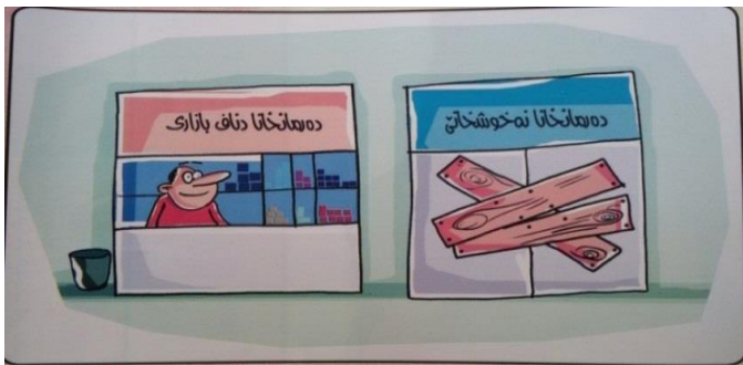
(گۆفاری گەپ، ژمارە 111، هەولێر، 2010)

ئەوی دەمی ئەم یلن د ناف سنووری پراگاتیکیدا؛ بەلێ ئەگەر چ باهخ بکارهینەری زما نی ههاته دان، ل ئەوی دەمی ئەم دئ د ناف بیافی واتاسازبێندا (بین) (شیرزاد سەبری عەلی : 2015 : 74). رەنگە ئەف گوتنا نافی بێ باشترین بەلگە بیت؛ کۆ ئەم بشیین سفاکتیکرێ د ناف پراگاتیکیدا شروفا بەکەین، چونکی د سفاکتیکرێندا بەردەوام گرنگی ب ئاخفتنکەری و واتایا مەبەستا ئاخفتنا ئەوی دەهینەدان، ژبو تیکەهشتن و دەسنیشانکرنا شیوازی سفاکتیکرێ. هەر وەسا ئیک ژ بەلگە یین دین سەلماندا هەبوونا رەهەندی پراگاتیکی د ناف سفاکتیکرێندا ئەفەیه، کۆ سفاکتیکرێ خودان واتایەکا کاریکەرە، واتە کاریکەرێ ل گوهداری دکەت و هەستین ئەوی دتازرینیت، ژرەهەندی "واتای کاریکەری راستەوخۆ دەرنابردی لەبەر رەچاوکردنی هەندی باری رەوشی کۆمەلایەتی یا شەرم و ترس... هتد(وەرگر) خۆی چەند زانیاریەکی دەرنەپراو تی دکەت، پشت بەستوو بە دەورووبەر و زەمینی ئاخوتن و زانیاری کەسی و هاوبەش... چونکە گوتن گرینگ نییه، بەلکو گرینگ مەبەستەکەیه بە گوێرە کەس و تاقیکردنەوه و هەست و ئارەزو و دەورووبەر دەگۆرین" (عەبدولواحید موشیر دزەبی : 2009 : 69). کەواتە دشیاندا یەهینتەگوتن، کۆ سفاکتیکرێ بەکەیهکا گرینگ و سەرەکیا پراگاتیکیه و ژ چارچۆف و سنووری دیارکری سفاکتیکرێ دەردکەفیت و ئەفە زانستی پراگاتیکیه، کۆ شروفا کەنەکا گونجای و دروست بو ئەفی شیوازی دکەت، واتە پراگاتیکی وەکی بازەیهکا مەزنتر؛ دشیت شیوازی سفاکتیکرێ و هەر پەيوەندیەکا ئەوی ب سفاکتیکرێه ب خۆفە بگریت و مۆرا خۆ ل سەر بەت. ل خوارێ دئ د چارچۆفە یێ چەند وینەیه کین کاریکاتریدیا ئاماژە یێ ب رەهەندی پراگاتیکی سفاکتیکرێ د کاریکاتریدیا دەین :