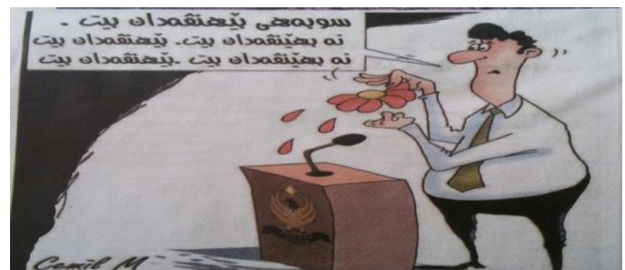
(رۆژناما ئەفرۆ، ژمارە 1350، دھوک، 2014)

ھەرەسا ئەگەر تەماشەیی ئەفی وینەین کاریکاتییدا ل خوارى بکەین :