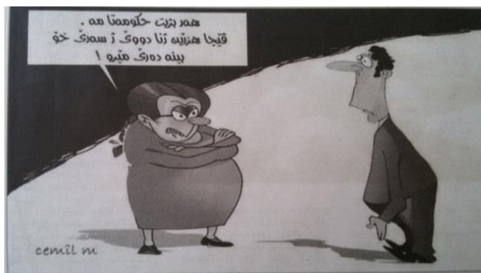
(رۇژناما ئەفرۆ، ژمارە 1364، دھوك، 2014)

د وئىنەي ب خۆ ژىدا دەرگەفئە ھەيە، كۆ سىڭاتىكرن تىدا ھەيە، ل سەر ئەوى بىناقى، كۆ ھەر زەلامەك پىنگېرىپ ب ئەوى ياساى نەكەت دى ھىتە سزادان و ھوسا ژن بېز دىت و زەلام بەرامبەر ژنى بېھىز دىت، لەورا خۆ راووستيانا ھەر دووكان ئەوى چەندى دياردەكەت.