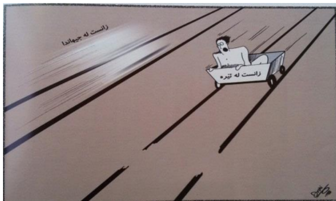
(گوفاری گپ، ژماره 160، هه ولیر، 2010)

نه گهر ته ماشه ی نه فی وینه فی کاریکاتیرین ل خواری بکهین، دئ بینین، کو دوو نیشانکارین هچي نهوژی (زانست له نیره) و (زانست له جیهان) هه نه، کو ب ئارمانجا سفکاتیکنی هاتینه بکارهینان و ب هاریکاریا دهوروبه ری ل مه بهستا فه شار تیا نهوان نیشانکاران دگهین، نهوژی نه فیه ل دهمی کاریکاتور فان راپووی ب بهراوردکرنا ئاستی پیشه که فتننا زانستی د نافه را (ل نیره) واته ل کوردستانی و ل جیهانی، نه فیه ژئ ب سفکاتیکنی که نیشاندایه، چونکی ل کوردستانی زانست که لهک هیدی و ل سهر خو، کو ل سهر عه ربهانه کنی ب ریقه دجیت، لی ل جیهانی زانست وهکی رونا هییا بریسینی نیشاندایه، واته که لهک ب لهزه و زور پیشه که فتنیه :