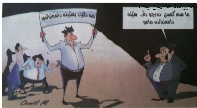
(رۆژناما ئەفرۆ، ژماره 1353، دهوك، 2014)

ههروهسا د پهيوهنديا د نافهرا سڤکاتیکن و کردهیا ئاخفتنا نهراستهوخودا، جهختی ل سهههندی دهینه کرن، کو ئەگهه کردهین ئاخفتنی ب تتی وهکی دهربرینهکا زارهکی سهههدهیپی ل گهل سڤکاتیکنی بکته، هینگی ئەفه دبیته شیوازکی بی رومیعی و فهگوهاستنا ههلوستهکێ رهتکریه، چونکی کردهین ئاخفتنی وهسا وهسفا سڤکاتیکنی دکته، کو جهختکن و نهریکنی ب خۆفه دگریت، شیوازکه یا ب زهحهته رهزاههندی ل سههههیتهدان، ژهر هندی کردهیا ئاخفتنی ل چهوانیا فهگوهاستنا دهرپین سڤکاتیکنی و چارچۆفهینی ئەوی . . . هتد فه دکولیت (Ramos : 1997 : 394). واته سڤکاتیکن شیوازکی تاییهته ژ شیوازین کردهین ئاخفتنی، کو بی پلان و نامادهکاری ناهیتته ئەنجامدان، چونکی گهلهک ههستیاره و ب ئیک کردهیا ئاخفتنهکا سڤکاتیکنی کار و کارفهدان دروستدین، کو گهلهک ژ کردهین دی کاریگهتره"ب ئەفنی چهندی بکارهینانا زمانی دهینههسالوخکن، کو چالاکیهکه ب دیارکنا مهبهستی ب ریکا کردهین ئاخفتنی رادیت" (شیرزاد سهبری علی : 2014 : 49). بۆ نمونه ئەگهه تهماشهه ئەفان وینهین کاریکاتیکیی ل خواری بکهین :