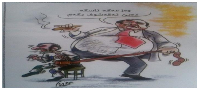
(گوفاری گەپ، ژمارە 167، ھەولێر 2015)

تەماشە ئەفی وئینی کاریکاتیربئ ل خوارئ بکەین دئ بینین، کو کاریکاتۆرفانی تواجەکا زۆر بپز ل دەستەھلاتی و ب تاییەتی ل بەرپرسین گەندەل دایە، چونکی کاریکاتۆرفانی ب شێوەیەکی ھونەریی جوان و بالکیش راستییەکا بەرپرسین گەندەل دیارکریە، ئەوژی ئەفەبە ل دەمی ئەف بەرپرسە بانگەشەیا(تەقەشوف) واتە دەستپشەگرتنا دارایی دکەن، ب تئی ئەف چەندە ل سەر ملین ھەزار و خەلکئی کیمدەرامەت ھاتیبە جیبەجیکرن و ھیچ تئشتەک ل داھات و ژيانا ئەفان جۆرە بەرپرسان کیم نەبوویە و بارگرائی ھەر بۆ خەلکئی ھەزار و روتە، بێگومان ئەف مەبەستا فەشارتی ب ھاریکاریا دەرووبەری دەھتتە زانین، کو ئەف تواجە ب مەبەستا سڤکاتیکرنی ھاتیبە لیدان :