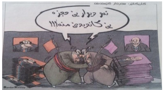
(رۆژناما وار، ژمارە 1069، دھوک، 2014)

3072 : 1996 : etal). ل خوارى دى ھەولەمین؛ سقکاتیکن د ناف گرمانین پێشەکییدا، د چەندین وینەین کاریکاتییدا دیارکەین : د ئەفی وینەین کاریکاتییدا ل خواریدا، سقکاتیکن ب ریکا ئەفان گرمانین پێشەکییدا ھاتیبە گەھاندن : 1. ھەلژارتن ھەنە. 2- شەر د ناھەرا لایەنگرندا بۆ حەجزکرنا دیواران ھەبە. 3 چ دیوار نەمایە بۆ ھەلاستنا وینەیان.