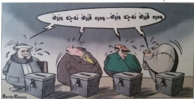
(رۆژناما وار، ژمارە 1080، دھوک، 2014)