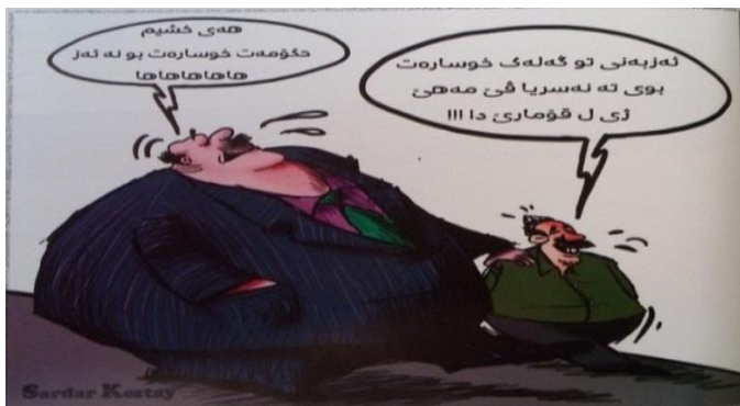
(گوفاری گهپ، ژماره 167، ههولیر، 2015)

دیسا ئەگهه تهماشهه ئەفنی وینهین کاریکاتیکیی ل خواری بکهین :