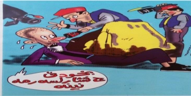
(گوفاری سیخورمه، ژماره 237، سلیمانی، 2015)

د ئه‌فی وینه‌ی کاریکاتیږیدا، کاریکاتورفانی ب شیوه‌به‌کې نه‌راسته‌وخو؛ سقکاتی ب ئه‌وان لایه‌نانگریه، کو مافین رۆژنامه‌فانان بنېدکهن و د ږاگه‌اندنا بڼېدا ورسا نیشان‌دندن، کو چ فشار ل سهر ئه‌وان نینه، ل فېری هه‌تا کو خه‌ک ل ئه‌فی وینه‌ی بگه‌هیت، دقیت ناگه‌مداری ره‌وشا سیاسی و نازادیا راده‌برېږنی و ئه‌وان بنېدکران بیت، کو ل دزی رۆژنامه‌فانان هاتینه‌کرن، له‌ورا ل فېری تواج و سقکاتیږنه‌کا نه‌راسته‌وخو هاتیه‌ ناراسته‌کرن، کو ب هاریکاریا دهوروبه‌ری ل په‌یاما ئه‌وی دگه‌هین.