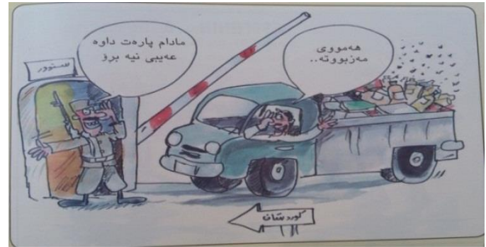
(گوفاری گه‌پ، ژماره 125، هه‌ولیر، 2011)

بۆ ههر دهرپینه‌کا سڤکاتیکرنی، چونکی سڤکاتیکرنی ب هه‌مان شیوه دهرپینه‌که، کو ههر چه‌نده واتایه‌کا ئاشکه‌را هه‌يه(کو ئه‌فه نه‌مه‌به‌سته)، لئ د هه‌مان دهمدا واتایا دهرکه‌فته‌ی هه‌يه(کو ئه‌فه واتایا مه‌به‌سته)، کو ب شیوه‌يه‌کي نه‌راسته‌وخۆ هاتیه دهرپین و ب هاریکاریا دهوروبه‌رى ده‌يته ده‌ستینشانکرن و زاین، که‌واته(دهرکه‌فته‌يین ئاخفتنی پیکه‌هاتینه ژ شروفه‌کرن و لیکدانا ئاخفتنی ب تابه‌تی ئه‌و زانیاریین، کو ب شیوه‌يه‌کي نه‌راسته‌وخۆ ژ ئاخفتنی دهرکه‌هفن)(ئه‌رشه‌د شوکری ئیسلام : 2014 : 21). ل خوارى دئ ئاماره‌ي ب چه‌ند وینه‌يه‌کين کاريکاتيری ده‌ين، کو چه‌ندین دهرکه‌فته‌يین ئاخفتنی و ب مه‌به‌ستا سڤکاتیکرنی تیدا هه‌نه :