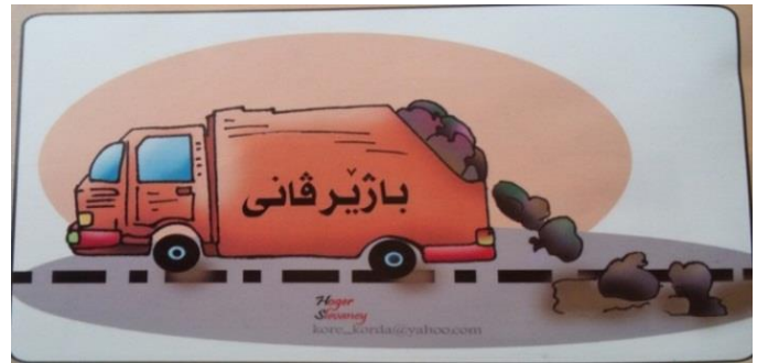
(گوفاری گهپ، ژماره 111، ههولیر 2010)

دشیین بیژن، کو بارا پتر یا ئەفی پهپن لایهنی بهرامبهر کهسهک نینه؛ بهلکو دهرگههکه یان فرهمانگههکه، کو ب گشتی سڤکاتی دهینته ئاراستهکرنا و زیدهتر توانجاندانه، بهلی توانجاندانهکا راستهوخویه، بۆ نمونه : (ههپهین حکوممهتا مه پین بووینه 60 رۆژ). د ئەفی جۆری سڤکاتیکرنا مهبهست و پهياما سڤکاتیکرنا ب ئاشکهرایی و راستهوخو و پین فهارتن؛ دهینته ئاراستهکرنا، چونکی " د ئەفی جۆریدا، مهبهستا ئاخفتنکهری ب ریکا واتا دهربرئ(واتا فرههنگی و واتا رستهپن) دیار و ئاشکهره دبیت و گوهدار بۆ گههشتنا ئەفی مهبهستی پیدقی ب دهربریه نینه، ژ بهرکو ئەف جۆری مهبهستی گریدای چهمنی ئاشکهرایه، کو سیانتيکیه و د شیاندايه ب نافئ مهبهستا سیانتيکی نافیکه" (شیزاد سهبری عهلی : 2014 : 45، 46). بیگومان ئەف جۆری سڤکاتیکرنا؛ راستهوخو گریدای ههست و سۆزین خهلهکینه و ژ ئەنجامی تورهپوون و ههلهچوون و ههپوونا کیاسیان و نهمانا ریزگرنا بهرامبهر. . . هتد. د ونهپن کاریکاتیریدا ئەف جۆری سڤکاتیکرنا بهرچاقدیت؛ چونکی خهلهک دشیین د مهبهستین ئاشکهراین کاریکاتیری بگههن و ل فیرئ خهلهک پیدقی ب دهربریه نینه، بهلکو پیدقی ب هندی ههیه، کا چ دکاریکاتیریدا، ژ پهپف و دمهنان ههیه، نهکو کا چ ل پشت کاریکاتیری ههیه(شیزاد سهبری عهلی : 2014 : 59). ههر وهکی د ئەفی ونهپن کاریکاتیریی د خواریدا دیاردبیت :