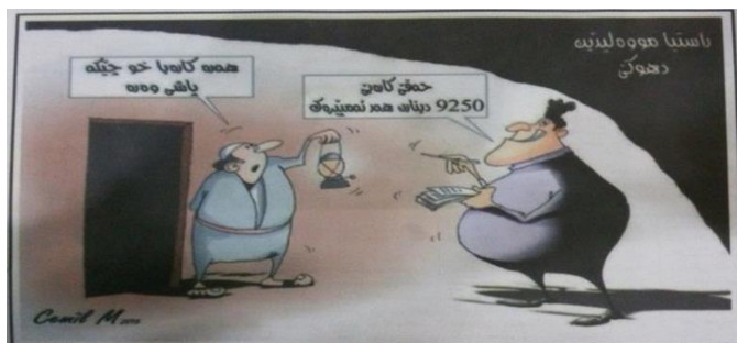
(رۆژناما ئەفرۆ، ژماره 1600، دهوك، 2015)

د ئەفنی وینهین کاریکاتیکیی ل سههیدیا دینین، کو سڤکاتیکن ب ریکا کردهیا ئاخفتنی لی وهک جوینهکا سڤک و ژ بهای کیمکرن ب مهبهستا سڤکاتیکنی هاتیهه ئەنجامدان، کو ئەوژی د دهرپینا(ههه خشیم)دایه، ل قیری دهمی ئەف بهرپسه ئەفنی بهرسنی ددهته بهرامبهری خۆ، سڤکاتیکیی ب تیکههشتن و ههلسهگاندا ئەوی