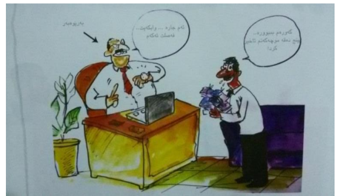
(گۆفاری گەپ، ژمارە 168، هەولێر، 2015)

د ئەفی وینەین کاریکاتێزێ ل سەریدا، کاریکاتۆرفانی ب هاریکاریا هەر دوو نیشانکارین دەمی(پیش هەلبژاردن) و (پاش هەلبژاردن) ب سڦکاتیکرێ بەراوردی د نافەرا ئەفان هەر دوو دەماندا کریه، کۆ ئەفەژی بۆ هەندەک جۆرین بەرێژان دیتە سڦکاتیکرێ، کۆ بەری هەلبژارتان گەلەک خۆ بۆ خەلکی دسکینن و خۆ کیمدکەن، ژ پیخەمەت ب دەستشەهینانا دەنگان، ئی پشتی هەلبژارتان خەلکی ژبەر دکەن و ئیدی پیدقیه خەلک خۆ پاقیزیتە بەر پینین ئەوان، هەتا کارەکی بۆ بکەن. هەر وەسا د ئەفی وینەین کاریکاتێزێ ل خواریدا، ب ریکا نیشانکاری دەمی(پینج دەفە) سڦکاتیکرێ هاتییە ئەنجامدان، ئەوژئ ل دەمی فەرمانبەرەکی گوتییە ریشەبەری : (گەرەم مەبورو. . . پینج دەفە مۆچەکەتم تاخیر کرد!) و د بەرامبەردا ریشەبەر گەلەک تورە دیت و گەفا فەسلکرێ ئی دکەت، ئەگەر جارەکا دی مۆچەین ئەوی گیرۆ بیت و بیکومان ب کارهینانا ئەفی نیشانکاری دەمی، سڦکاتیکرێ ب ئەفان جۆرین ریشەبەران، کۆ تەنانت نەشین پینج خۆلەکانێژی خۆ ل بەرامبەر گیروون مۆچەیی بگرن و توندترین هەلوێست نیشانددەن :