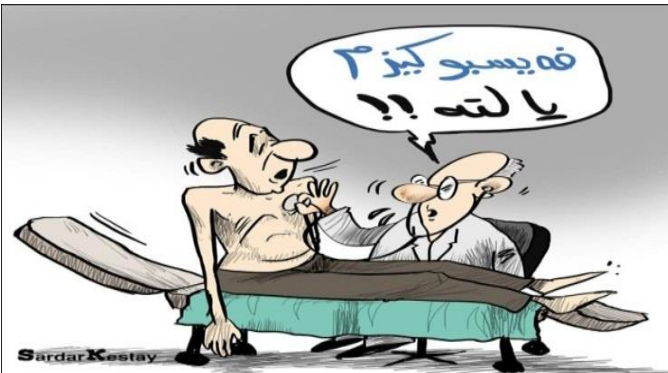
(رؤژناما وار، ژماره 1020، دهوك، 2014)

ديسان تهگه تماشه‌ی ئه‌في وینه‌ي کاريکاتيرپي ل خوارى بکين،