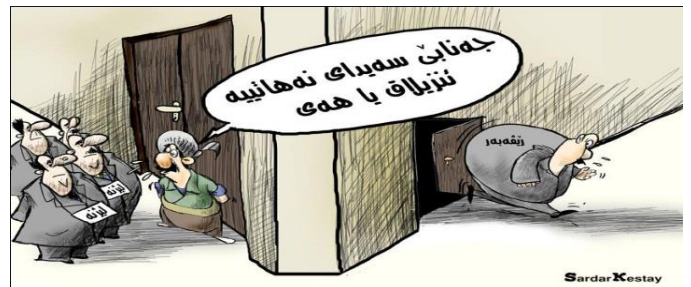
(گوفارى گەپ، ژمارە 125، ھەولەر، 2011)

د نافەرا دوو جۆرىن دەرمائخانان ھاتىيەكرن، ئەوژى : (دەرمائخانان خەوشخانى) ھە، كو بەردەوام گرتىيە و (دەرمائخانان د ناف بازاری) یدايە، كو بەردەوام فەكرى، ئەفەزى سەكەتەكەرنە ب لايەن پەيوەندىدار و ھزارەتا ساخەمىيى، كو بازرگانىيى ب خەلكى دكەن و بىگومان ئەف چەندەزى ب سەكەتەكەرنى بۆ ئەوان لايەن بەرپرسىار دزفەتەفە. ھەروەسا ئەگەر تەماشەى ئەفى وىنەىن كارىكاتىر ل خوارى بەكىن، دىشياندا يە ب ھارىكارىيا دەوروبەر و ھىيايىن نەزمانى، د پەياما سەكەتەكەرنى يا ئەويدا بەگەھىن، كو ئەفەزى سەلماندە ژۆ رەھەندى پراگاتىكى د سەكەتەكەرنىدا و نەخاسە د وىنەىن كارىكاتىر دى سەكەتەكەرنىدا :