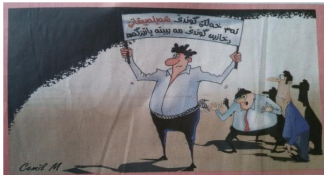
(رۆژناما ئەفرۆ، ژماره 1344، دهوك، 2014)

خودانین موولهیدیمان سڤکاتیکنه ب هاریکاریا تواج لیدانی، هر وهکی دهینه زانین ل دمهکیدا، کو رهوشا کارهین نهیا باشه و خهک یی بی کارهه، بهردهوام خودانین موولهیدیمان داخوازا پیدانا کرینا کارهین ژ هاولاتیان دکهن، ئەفنی چهندیژی نهپازییوون د ناف خهلیکیا دروستکریهه. ههروهسا د ئەفنی وینهین کاریکاتیکیی ل سهیدیا، سڤکاتیکن وهک کردهیا ئاخفتنی هاتیهه ئەنجامدان و د گوتنا : (ما ههه کەسی دەرچوو دی هیتته دامهزراندن مامو) دیار دیت، چونکی ل قیری سڤکاتیکن ب هزر و بۆچوونا دەرچووین زانکو و پهیمانگهان هاتیهه کرن، کو داخوازا دامهزراندنی دکهن، چونکی ئەم ب هاریکاریا دهورو بهری دزانین، کو ئەفه چهنه سالهکه ل ههزینا کوردستانی ههزارهکا زور یا دەرچووین هیهه و نههاتینه دامهزراندن و بهردهوام خۆنیشانانان بۆ ئەفنی مهبهستی دکهن، لی حکومهتی شیانین