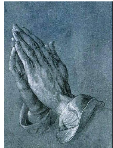
(۳) البرخت دورر (دهسته کان)