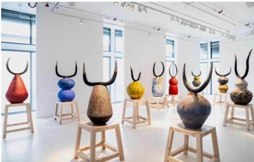
(۱۵) سیرامیکی هونه رمه ند زیزیفو بوسوا