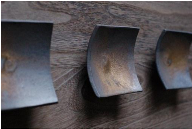
(۱۱) ته کنیکی راکو

یه کتیک له ته کنیکه زور به کاره پناوه کان ته کنه لوجیای راکویه به میتوده کۆن و مۆدیرنه کانی وه کو له وینهی (۱۱) کاری هونه رهنه ندی سیرامیکی ژاپۆنی (شینوبو هاشیمۆتۆ - Shinobu Hashimoto).