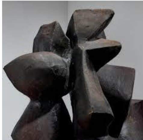
(٨) بیتر فولکس