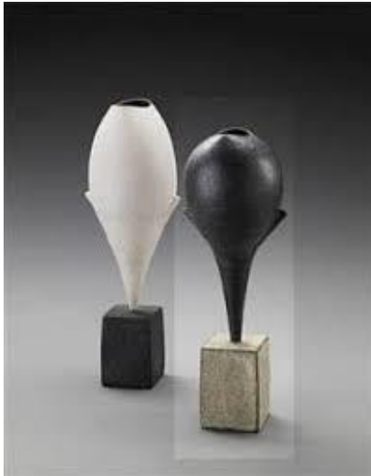
(٩) هانز کوبر