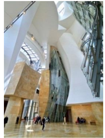
(٧) ته لارسازی هاوچه رخ