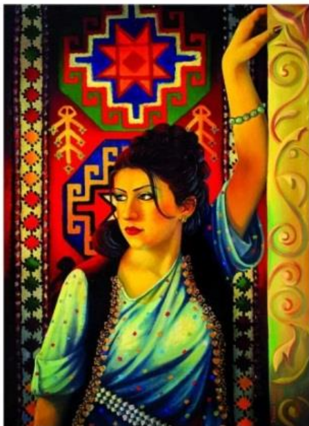
Artist's Wife 2008 Oil on Canvas 80 x 60 cm Artist's Studio

هونهرمه‌ند لیره‌دا نه‌ک ته‌نھا ماده، یان رینگیه‌ک، میتۆد یان شیوازیک، به‌لکو هه‌مه‌چه‌شینی له‌دامه‌زراندنی پیشه‌یی خۆی بۆ رووبه‌ری فراوانتر و قوولتر و گشتگیرتر، که‌جوانی زیادیکرد له‌کاتی زیادکردنی هه‌مه‌چه‌شینی و گۆراو په‌رسه‌ندنه‌کانی نیوان کۆن و مۆدیرن، "داهینان زۆرجار یارمه‌تیده‌ره بۆ ئینسان هه‌ر بۆیه ده‌بیت له‌نیوان نیگار کێشان و ئه‌ده‌بدا یه‌کیکیان ده‌ستنیشان بکات"، (سعید، ۲۰۰۴)، بێگومان له‌ناو وینه‌کێشاندا زۆر شت هه‌یه که ناکریت له‌ناو نووسیندا جینگایان بۆبکریته‌وه، لیره‌وه‌کاره‌کانی هونهرمه‌ند توانا مه‌رجان به‌گشتی کاری ئه‌م هونهرمه‌نده له‌م قۆناغه‌دا زیاتر دیمه‌نه‌کانی ژبانی کورده‌وارین وه‌ک له‌ وینه‌ی (۲۰_۲۱) دا دیاره.