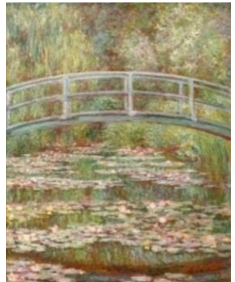
(۱۴) پردیک له سه رگومی لیلی ئاو