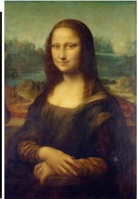
(۵) مونالیزا (دافنشی)