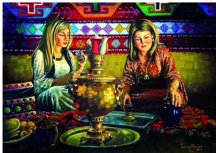
Women's Council 2014 Oil on Canvas 70 x 50 cm Kurdistan Regional Government Representation in Paris - France