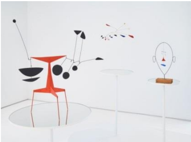
(۴) النحت الحرکی الکسندر کالدر

نه گهر سهیری تابلوکانی هونه رمه ندیکی نه لمانی بکهین (البرخت دورر) له سه ده ی شانزه هه مه وه، داهینه ر (دورر) کاری وینه گرتنی زهیتی زور شل و جوان گوزارشت فلجه ی هونه رمه ندیک ده کات به هه ستیکی باریکه وه. وینه کیشانی ته واو به قه له م و خه لوز، تابلوکان به هیله بیزارکه ره کان له زیندووی هیله کان و چۆنیه تی به کارهینانیان بۆ پیشنیارکردن له شیوه و قه باره دا، نه وه دهسته کانی به هه موو نه و ورده کاری و درز و شیواوییه ی هه ئیگرته بوو نه خشانده. وه کو له وینه ی (۲۱)، "هیله کان له گه ل جیاوازیه هه مه جو ره کانیان که له هیل ی راست و هیل ی چه ماوه هه ئده قولین گوزارشتی هونه رین که گوزارشت له هه مان دروستکه ره ده کهن و هه موو فورم و واتا کانی ده ور و به ریان ده که نه جیهانیکی تایبه تی ته نیا که به دوای هاوئا هه نگیدا ده گه ریت"، (زریبه، ۲۰۱۴، لا ۲۰۹)، وه ک له وینه ی (۲۲). هونه رمه ند و نه اندازیاری نه مریکی (ئه لیکسانده ر کالده ر) دامه زرینه ری په یکه ری حرکی.