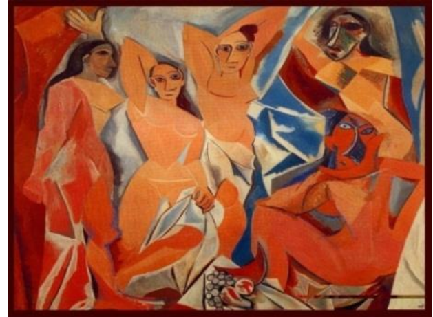
(۱۰) (انسان افینون)