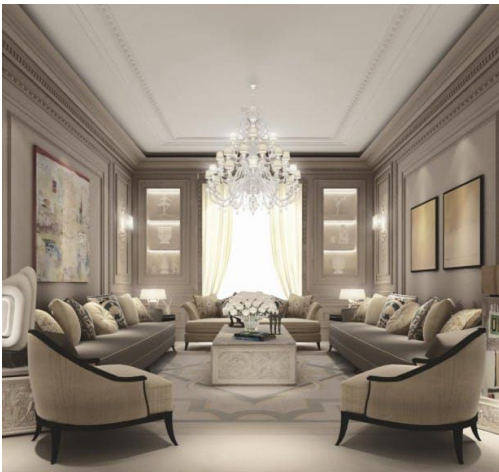
وينه ي ۳: (هارمۆنى و يونتى/ ديزاينى ناومه له لايىن نايونس له دوبه ي)

بۇ به ده سته پىنانى پىكخستنى به هاى جوانى له يه كه يه كخراو له دروست بوونيدا جهخت له سهر نه وه ده كه ينه وه كه نه و پلاناهى داماننا ههر له پىكخستنى پيكهاتهى هيلى ده ست پى بكات به ده ستنيشان كردنى بنكه يهك بۇ كۆكردنه وهى توخمه كان، بۇ نه وهى له پيكهاته كه دا يه كيتى به دى بيت، پويسته توخمه هيليه كانى خو گريدات و په يوه ندى هاوسه نك له نيوانياندا دروست بكات، چونكه "يه كه پيكه وه به ستنى به سته رى نيوان توخمه كانى پيكهاته كه يه" (ياغى، ۱۹۹۰، لا ۳۰۹) وه بۇ سهر هه لبدانى (يه كه) چهن رىگه يه كه هه يه بۇ كۆكردنه وهى يه كه ي بينراو، له وانه " شپواى به يه كه گه شتووى و په يوه ندى و به سه ريه كدا چون و له يه كترازان و ليكچنراو، هه موو نه مانه به تواناى كۆكردنه وه و دروست كردنى هه ستنى يه كبوونى فورم ديارى ده كرئت. هه روه ها " يه كه نه و سيفه ته يه كه وا ده كات توخمه كان سهر به يه كتر بن و ده توانن له رىگه ي خو شه ويستى نيوه وه له شپوه ي گشتيدا ده ركه ون" (ياغى، ۱۹۹۰، لا ۳۰۹) و پيكهاتهى سه رنجى بينين به ده ست به پىن. وهك له وئنه ي (۳) روون كراوه توه.