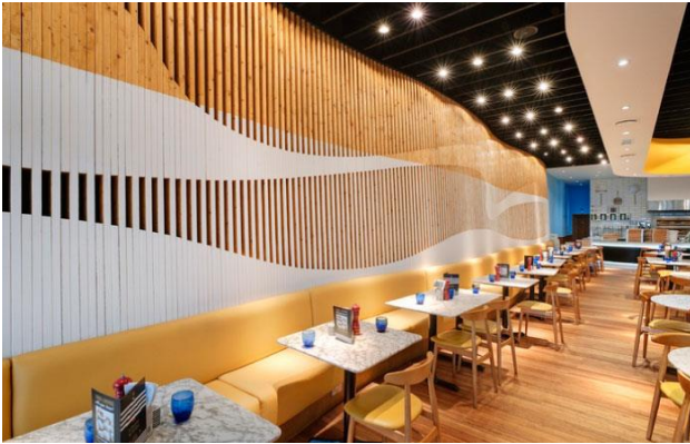
وئنهى (5): (بئهماكانى بهشى ديزاينى ناووه/ رېتم

ئهم وئنه يه پڭكها ته وه له بۇشاي ناووهى چېشخانه (كه به هوى پڭخستنى و دارشتنى ديواره كهى رېتم پيشان ده دات).