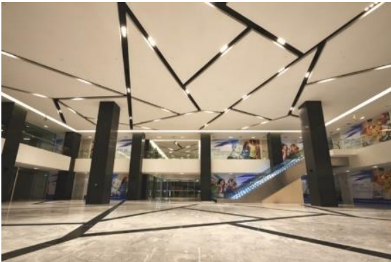
وئنهى) 9: (سىتى هه ب له سهنگاپورا له لايىن ئو ئىن جى و نه دىلتۆ دىزاین كراوه / 2013

ههروهها ئازادى دهكات به دىزاینه ر بۇ هه لباردى شپوهى ته واوى بۇشاييه كه و كۆنترۆلكردنى به رزى و ئازادى هه مه جورى له به رزايى بنمىچه كه دا و شپوه و رهنگه جياوازه كانى و ئازادى دانانى رووناكى له ئىو شپوازه جوراوجۆره كان كه ئەمهش له سه ريه كه به توخمىكى سه رنج پاكىش له به رچاو ده گرپت، له لايه كهى ديكهش ده تونرپت نه خشسازى و ديكۆركردن به كار به پىنرپت كه ده تواتپت گوزارشت له ناسنامه و شپوازه تايبه تمه ندى بۇشاييه كه بكات.