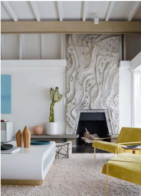
ويئنه ي 4): (دژه يهك : ديزاينى موديرنى سه ده ي ناوه راست له بيركلى هيلس گواستراوه ته وه

ئه م ويئنه يه پي كه اته وه له ژوورى دانيشتن (كه به هو ي په نك و ري كخستنى شيوه ي كه لوپه له كان دژه يه ك پيشان ده دات كه له لايه ن بيركلى هيلس گواستراوه ته وه).