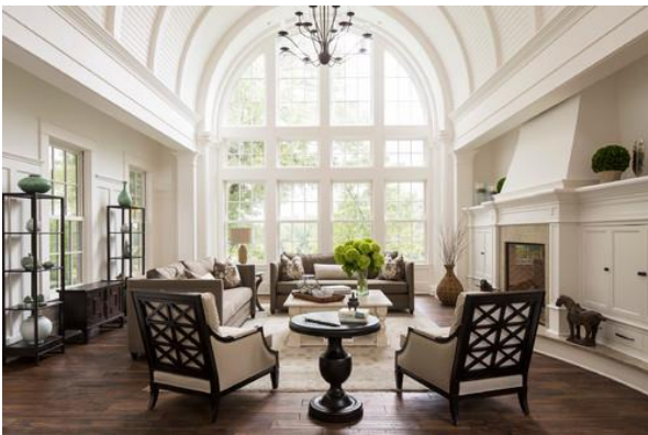
وئنهى (6): (هاوسه نڭى له ديزاينى ناووه دا / ديزاينهر تامارا

هاوسه نڭى په يوه ندييه كانى نيوان كيشه كان ده گرئته وه ههر پڭخستنيك بۆ ديزاين كه ئەوهى ده بېت بگه يه نرئته مرؤڧ هه ستى چيگيرى و هاوسه نڭيه، ئەگه ر شته كانى وهك شيوه به رجه سته له ناووه و كاره هاوشيوه كانى هونه ر هاوسه نڭ و په نڭى پووكه ش و به هاكان هاوسه نڭ بن، ئەوه ئيمه چاودپرى ده كه ين له كاتى ديزاينكردنى ناووه و هاوسه نڭى له پڭكه ي په نڭه كان و شيوه به رجه سته و شيوه پڭكه اته كانى توخمه كان و پروونكى و هه موو يه كهى ته واوكر يان كه لوپه لى ته واوكرى ديزاينى ناووه. وهك له وئنهى (6) پروون كراوه ته وه. (عبدالحليم، ۱۹۸۴، لا ۱۷۷)