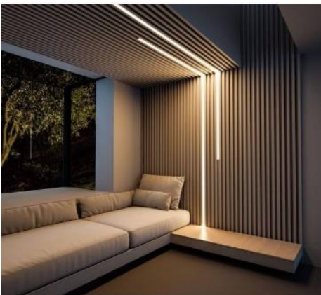
وئنه ي) 11: (ديزاينى رووناكى له لايهن/ نيلينا فايان

رووناكى له ديزاينى ناوه وه و جۆره جياوازيه كانيه وه رۆلىكى كارىگه ر ده بىتت له پىتاسه كردنى چۆنيه تى بۆشايه كه، كاتىك رووناكى به شيوه يه كى تايه تى داده به زىنرپته سهر كه لوپه لىكى دياكراو ئه وا هپزى سه رنج و تايه ته مندى پڻ ده به خشيت، وه به شيوه يه كى گشتى كارىگه رى ده كاته سهر لايهنى جوانى رنك و شيوه كان، وه ده توانرئ به هووى رووناكى چه ند به شىك دروست بكه يت له ناو يهك فه زا، وه به ده سته پنانى زۆرترين ژماره ي رنك دانه وهى رووناكى جا گه ر تيشكى سروشتى بىت يا ده ستركد. وهك له وئنه ي (11) روون كراوه ته وه. (عبدالرزاق، 2002، لا 34)