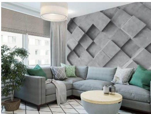
وینه ی) ۸: (بلوکی کۆنکریتی لوفت گره بی که وینه ی دیواری خود هه لگره /3

په چاوکردنی دیواره کان وهک یه کیک له گرنگترین توخمهکانی بۆشایی ناوه وه داده نریت چونکه نه وانه توخمه هه ره بهرچاوهکانی چاون وه دهکه ونه ئاستی بیننه وه، به گویره ی دیاریکراوهکانی تر وهک ( زهوی و بنمیچ )، وه دیواره کان به زۆری له سه بهش پیکدین (ئه زایر، به شه ساده که ی ناوه ند، فریزی سه ره وه). (البیاتی، ۲۰۰۵، لا ۹۳) وهیه کیکه له و په گه زه سه ره کیانه ی که وهزیفه و کرداری بۆشاییه کان له یه کتر جیا ده کاته وه، یه کیکه له و به شانیه که شیوه ی جوانی و سه رنجی رووکاره بازگانییهکانی بۆشاییه بۆیه پرۆسه ی دیزاینکردنی رووکاره پیشانده رهکان یه کیکه له شته سه ره کییهکانی دیزاینه ر و کاریگه ره له بواری بینه رادا چونکه به شیکی زۆری بواری بینه رادی به کاره پنه ر وه رده گریت. وهک له وینه ی (A) پوون کراوه ته وه. (البغدادی، ۲۰۰۴، لا V).