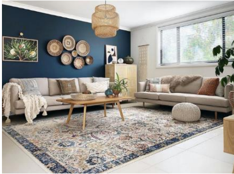
وئنه ي) 10: (ستايلى پالېشتى كراو له لايهن كانبيرا دهر چه شيواز ته خته ي رنك

رنگ كار ده كاته سهر پرۆسه ي ئىگه يشتن له فۆرم و ره هه ندى رۆحى بۆشايى ناوه وه، كه له بهر ئه وه ناراسته وخۆ كار ده كاته سهر مه شقه كانى مرؤف له ئه داي ئهرك و كاره كانى له و بۆشايانه دا، هه روهك ده كرپت هه سته شيوه ي بۆشايى بگۆر دپت له رىگه ي دابه شكر دنى رنكه وه، كه پشت به مه عرفه ي واقىعى تپروانىنى رنك ده به سته ي و ياسا و كارىگه رى بىژمار هه به بۆ به كار هپنانى رنك له شار دنه وهى كه مو كوپه كان. وهك له وىنه ي (10) روون كراوه ته وه. (پاسمۆس، 1986، لا 216)