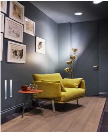
وينه (1): (سرومري/ قمنه فمى ديزاين ميلىك پنكهاته له لايهن نالان گيليس

دېرېك دههينته دهرهوه، گرنكى تايه تي پيدهدات بۇ پاكيشانى سه رنج و بوون به خالتيكى زال و جياواز له توخم و يه كه كانى تر. وهك له وينه (1) پروون كراوه ته وه.