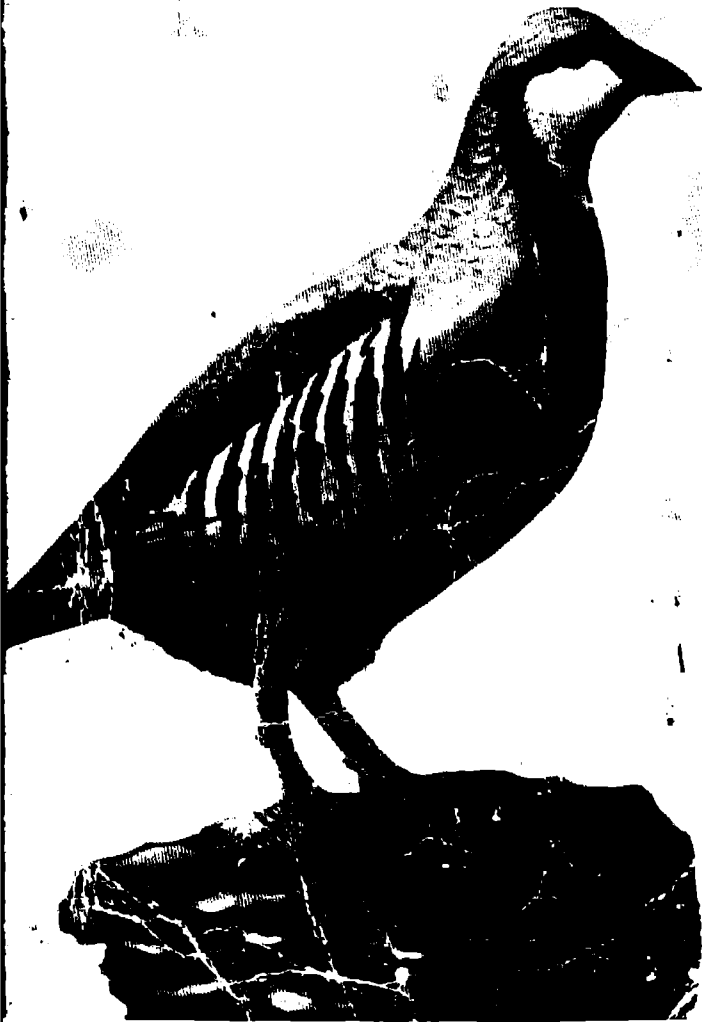
- پله -

نه م بائنده مام نلوه نجییه ، جوانه ، دهنګ خوشه ی به کوردی پیی دهوتری ( کهو ) . عه رهب به ( الحجل الرومی ) بان ( دراج الصخور ) ناوی ده بهن . تورک پیی ده لپین ( نۆکلک ) ه لای ئینگلیزه کان به ( Chukar partridge ) به ناو بانگه ، به لام به لاتینی - که ناوی زانستیانه یه - به کهو دهوتری ( Alactoris ) و کهوی کورده واریمان نساوی ( Alactoris Kurdistanica ) ی هه لگرتوه .