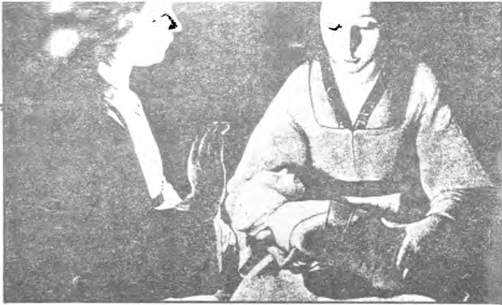
(له دايك بوون) . ساله گانسی . موورزدخانه ی ریز

دهربرینی زه مینه ی تراژیدی و کوشتنو برین له نیگاری : (سیاستیان) ی شهید . بهرچاو ده که وی . زه مینه ی شهو و تاریکی و وجهستی تیرباران کراوی شهید . . شینو گریان و فیغانی ثافره ته جهرگ سوتاووه کان . هینی نهو شهوه زهنگه یان پراو ناوه . . . هونه رهنه پند وهستایانه توانیو بهتی نهوه که ته نیا ههستی خه مگینی گشتی که (هه موو لایه کی له ژنر بالی ره شی کوکر دوه ته وه) ده ریبیری . به لکو له هسان کاتدا ههستی کاره ساتی جهرگ پرو تازاری ناوه وهو برینداری دهروونی هه ریه کی که له لی قه و ماوانهش بهرجهسته بکات . هونه رهنه مند . زه مینه ی تراژیدی له رینگای - جوولانه وهی شاتونی و - هه لپه رکی تی مهرگ - هوه درووست ناکات : به لکو به هوی جوولانه وهی سرووشتی : جهسته : دهست و په نجه : هیل دی ده ره وهی فیگور بهرجهسته ده کات و بهم جوهره ههستی کی قولتر به کاره سات ده به خشینه بینر که پاش - دوزینه وهو ههست پی کردنی - بو ماوه به کی زور له یادی ده مینی و له بیری ناچیته وه .