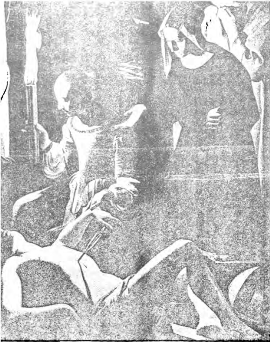
(سییاستیان) ، ۱۶۶۰ - ۱۶۵۰ مووزمخانهی بهرلین .

کردوه ، بهمه به سنی خویندن و شاره زا بوونی هونهری تم وولات . تمهش تهو نهی به مان بو ناشکرا ده کات ، که هونهرمه مند له سه ره تادا له ژیر کارتیکردنیکی به هیزی قوتابجانهی نیگارکیشانی (کارافادجق) ئیشی کردوه . به لام هونهرمه نندی ژیر ، کاروانی هونهری له م سنوره دوورتر لیخوریوه . زوربهی هه ره زوری نیگاره کانی لاتور دهر برینی ناوه پروکی تاینین ، ههروه ها ژبانی دپهات و لادی بووه ته کانی سروش بو به شیک تری به ره مه کانی ، تمهش له ژوره زی پاله وانه کانی هونهرمه مند دیارده به کی به رچاوه ، که سپای شاعیری و دل پاک و ساکاری و مرو قایه تی و دهوله مند دی دهر وونی یان پیوه دیاره .