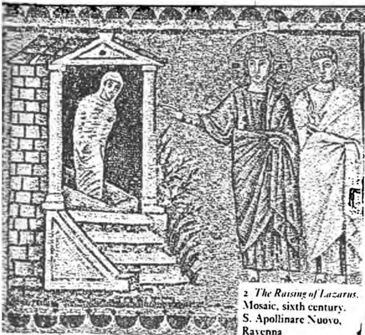
2 The Raising of Lazarus. Mosaic, sixth century. S. Apollinare Nuovo, Ravenna