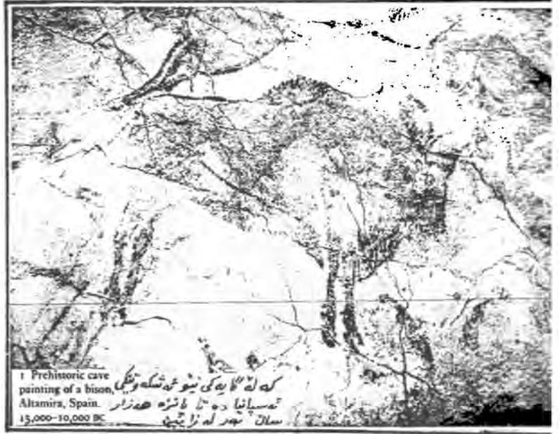
1 Prehistoric cave painting of a bison, Altamira, Spain. 15,000-10,000 BC

ویندی سهر دیواری ته شکوته که زیندوونی به، به لأم نهو هیزه‌ی تیدایه که ده‌ست به‌جی وا لهو که سانه بکا که سه‌یری ده‌که‌ن تم چیروکه‌یان بیته‌وه یاد.. به‌تایه‌تی نهو که سانه‌ی ناگایان له موعجیزه‌که‌ی عیساو زیندوو‌کردنه‌وه‌ی لازاروس - ه.