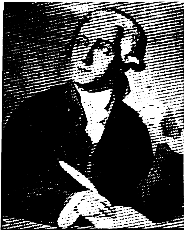
ئهننوان لوریه لافوازیه (باوکی کیمیا)

سهرهکی یانهی هموو ئه و شتانهی ئی پینک هاتوو که له بهرچاوماندا یه و ههستی بهی دهکین. جا مهسه له یهکی روئنبیری سهرهکی یه که بیخهینه روو مروف چون توانی رزگاری بیت له و بروا نابهجی یانهی ههزاران سال به ریکا پچاو پینچهکاندا خولی دمخواردوو مروف چون سهلماندی که ملیونه ها ماده وهک بهرد له کانهکاندا یان شانهی زیندوو له گیان له بهراندایان گازی کوشنده یان ئه و ئه سترانهی که به ملیونه ها سال رووناکی به که یان دهگاته ئیمه، ئه مانه همووی له چهند ته نولکه یهکی ئه له کتریکی یان ئه له کتریکی پینک هاتوو و له م ته نولکانه ئه تومی توخمه جور به جور هکان دروست بوون و له ئه تومه کان مولیکیوله کان پینک هاتوو و له م مولیکیولانهش هموو ماده هکانی تری سروشت پهیدا بووه.