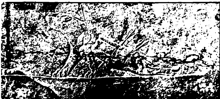
● گواستنمه وه ی بیکمیری گای بالدار . لاماسو به کملک له ناوچه سلخاوی یه که نه وه بوی کوشکی میری (۱)

نه وه ی سرنج راکیشمه وهرگبر له زمان بایلۆنه وه ده لی : نه م شاکره هونری یانه له زگرگرو ههریمه کانی کویسنجق دوزراونه توه وه به شی زوریشیان له موزه خانه ی بریتانی له له نده و لووفهر له پاریس پارێزگاری کران . . . . ۱۱ له پاشان وهرگبر ده لی : نه وه سهر پینج تابلۆشی وه که نمونه ی هونری له گه ل باسه که پیدا بلا و کردۆنه توه ئیمهش له (ناسوی هونری جیهانی) بلاوی ده که بنه وه . . نه وه ی شیای باسه چوار له م نموناته یشان دراوه ، جگه له ریلیفی - پلنگی بریندار - که خوی (ده له شیر ی برینداره) له رووی هونری یه وه باسی هیج تابلۆکیان ناکات ، وه نه م نمونه بهش خوی به شیکه له ریلیفی ناسور بانيال راوی شیر ده کات، که له کوشکی باکورره له نه نه وادا دوزراونه توه (۱) . نمونه ی دووه که وهرگبر ته نیا نه وه بنده باسی ده کات و ده لی : ناسور بانيال - کویسنجق - موزه خانه ی بریتانیا . . نه مه شیان ریلیفی که به