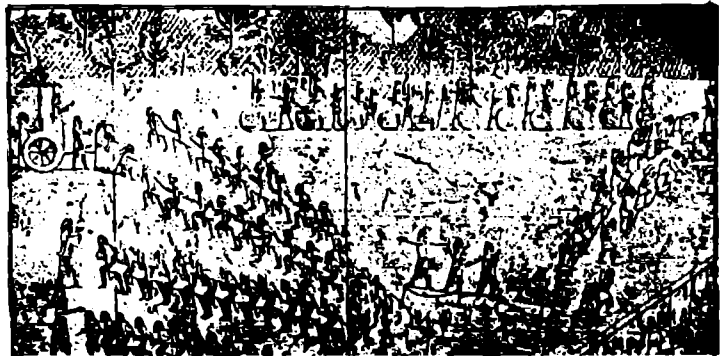
● ریلیفی ده له شیر ی بریندار، که له کوشکی ناسور بانيال له قوینجق له نینموادا، دوزراونه توه - له موزه خانه ی بریتانی هملکیراوه (۱)

له لاپره (۱۷) ی هه مان پرتووکدا دهر باره ی گردی قوینجق ده لین : نم گرده ده که وینه باکورری رووباری خوسر ، ههروه ها ده لین شیوه به کی هیلکه یی به خویهوه ده یینی که دریزی به کی نریکه ی کیلومه نریکه و پانانی به کی نیو کیلومه تره و به زایشی نریکه ی (۳۱) مه تره له رووی دهر یاهوه . . ههروه ها نه وهش ده لین که : قوینجق ووشه به کی تورکی یه و گورانکاری هاتوته سهر . . له م رووهوه رایه کی تریش هه به که نم ناوه واته ی (له وه رکای مهر) ده به خشی چونکه نم ناوچه به له زور به ی وه زره کانی سال دا ده یینه له وه رگایه کی زور ، ههروه ها دهر باره ی نم مه له بنده ناسور یی و توویانه گردی قوینجق زور کوشکی شاهانه و پهرستگاو ده زگای به رپوه بردنی تیدابوه . . بوی به مه له ندیکی سهره کی له نه نه وای پایته ختی ناسور یی یکان داده ندری .