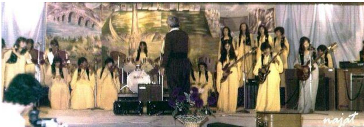
Koma Mûzîka Xanzad a Jinan