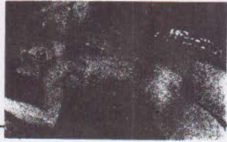
«ئهسپ سواری شین»