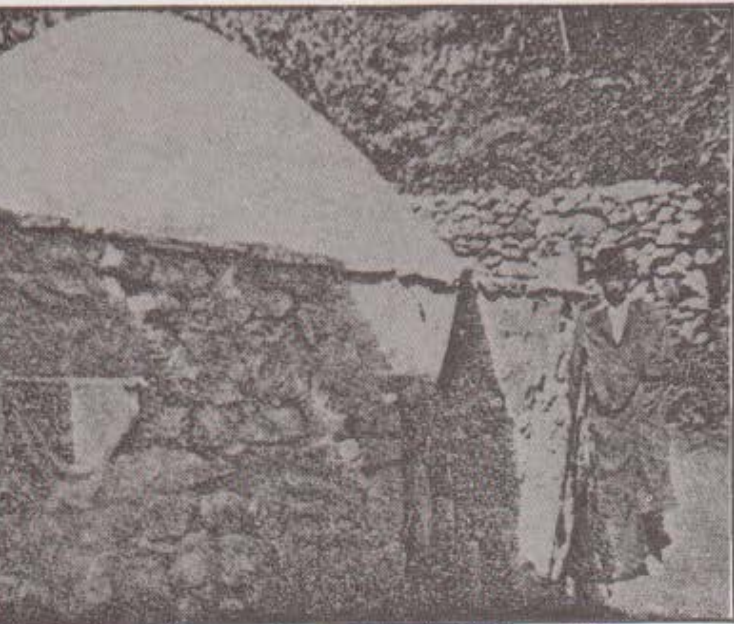
گورته سولتان ئيسحاق به زرنجه

ئاواز كەرد واتش ، ئەر ھەي شاسەھاك پەي چيش ئاماني تو ئى ماواو خاك قبولم ئى يەن تو نە (پەردپوهر) بسازى يانە بنانى ھونەر . . . (۷) سەرچاوەیەك مێژووی پیر میکائیل داودانی بەم جۆرە راگەیاندووہ : (ك٦٥٨) بۆ (ك٧٣٦) (٨) . ئەبێ مێژووی پەیدا بوونی ئیسحاقیش لە مێژووی مردنی پیر میکائیل تی نەپەری .