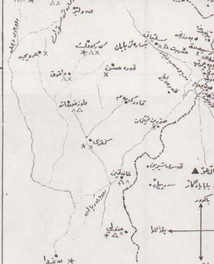
دیاری کردنی شوینی جوغرافی و دابش بوونی هوزه کانی کالهی ۸۰۰ کوی بی جو ۱۴۰۵ ک. شوینی نیشته بی بوونی کون . شوینی نیشته بی بوون له کون و نیستا . وری پیاوه پیروزو ئایی یه کانیان